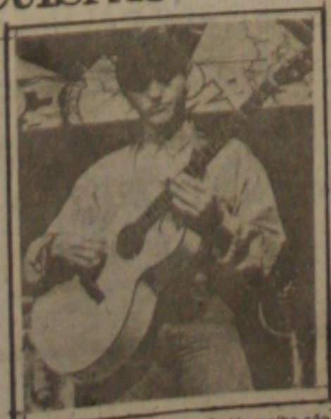
Nico Rezende e Barão Vermelho são atrações do Milk-Shake neste sábado