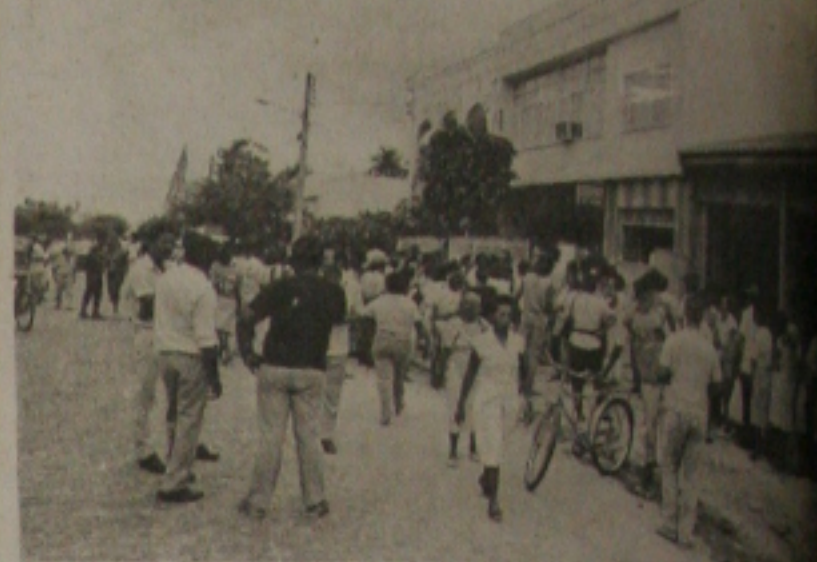
Na 27ª Zona Eleitoral formou-se extensa fila de pessoas para trocar o título.