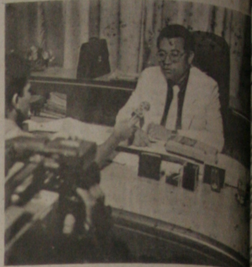
Secretário da Saúde, Edney Freire Caetano, concede entrevista coletiva sobre a campanha de vacinação Anti-Pólio. Governo Estadual. "Nós requisitamos nos precaver já que os funcionários 230 soldados do exército como forma de estavam em greve", finalizou o secretário.

A respeito da atuação dos grevistas da área de saúde que pretendem no dia de hoje desenvolver normalmente suas atividades durante a campanha de vacinação, Edney Freire Caetano assegurou que a categoria será bem recebida pelo