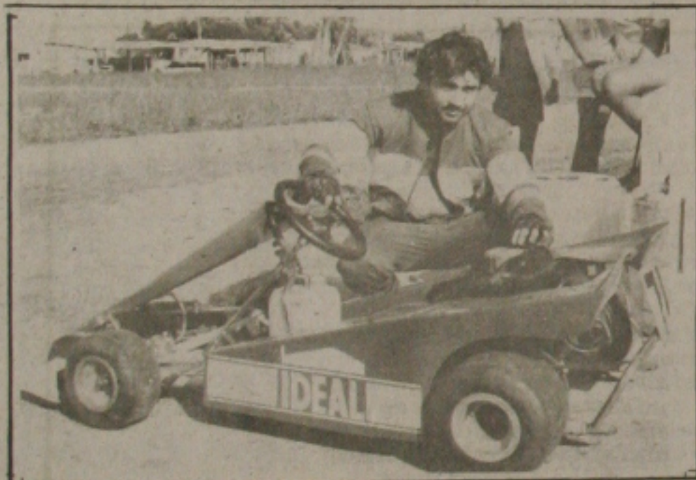
O kartódromo de Aracaju vai receber um grande público hoje e amanhã. E o torneio imprensa movimentando os aficionados.

Será hoje a partir das 16 horas a tomada de tempo para a prova de kart que vai reunir amanhã no kartódromo de Aracaju os cronistas esportivos de Sergipe. Organizada pela Associação Sergipana de Karts, a prova vem recebendo um tratamento especial dos jornalistas e radialistas esportivos, que estarão representando os seus órgãos de imprensa nas três provas programadas para os meses de outubro, novembro e dezembro.