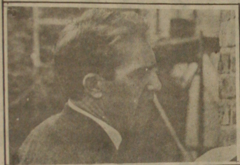
O filme E.T. O ator Kevin Costner estão em Cinemania.