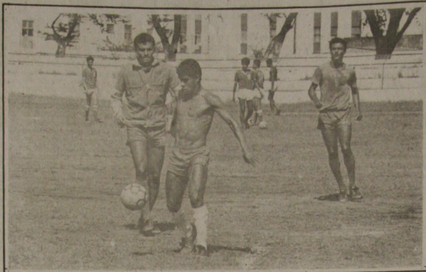
Balaninho agora titular no Sergipe, quer um lugar ao sol no futebol sergipano.

Segunda-feira é aniversário do Sergipe. A diretoria pretende organizar uma festa simples, mas não val deixar a data passar em