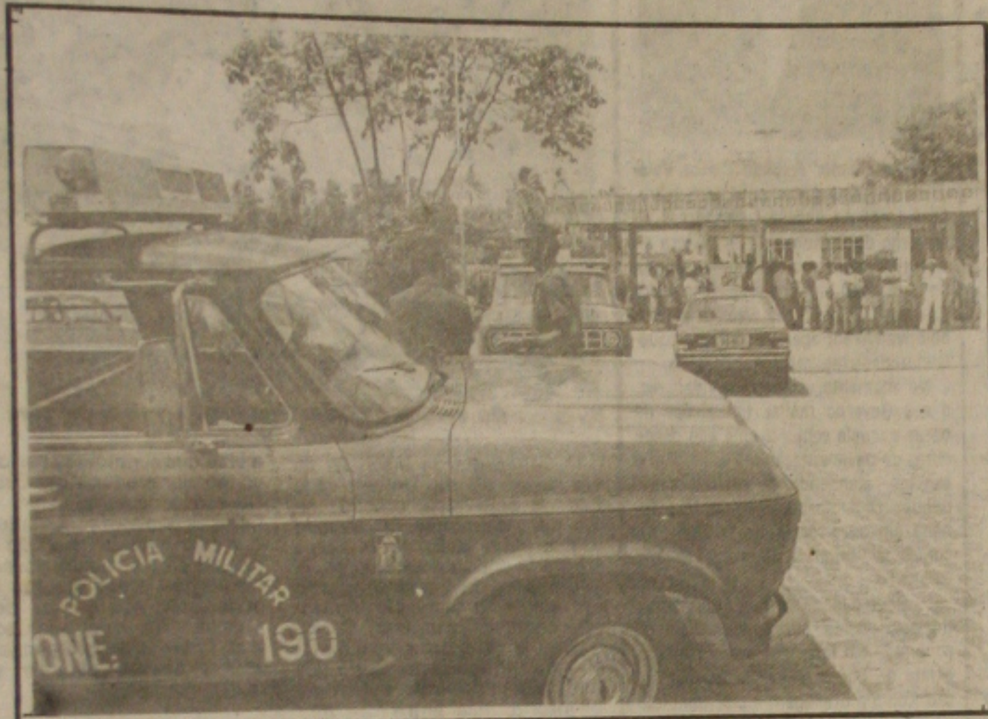
Policiais e grevistas entraram em conflitos na agência do Cesec do Banco do Brasil.

Os funcionários do Banco do Nordeste voltam hoje a trabalhar normalmente. A decisão de suspender a greve que durou três dias, foi tomada ontem durante assembleia conjunta com os grevistas do Banco do Brasil que aconteceu na AABB. Os bancários do BNB aceitaram voltar ao trabalho depois que a direção geral do Banco concordou em não cortar os dias da greve e estender aos seus funcionários a equiparação salarial com o Banco Central, caso o TST conceda a equiparação aos funcionários do Banco do Brasil.