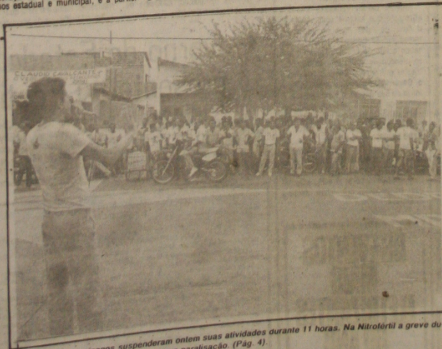
Os petroleiros sergipanos suspenderam ontem suas atividades durante 11 horas. Na Nitrofértil a greve durou duas horas e na Petromisa não houve paralisação. (Pág. 4)

de abertura do FASC, já as 19:30 horas, acontecerá a encenação do espetáculo "Vozes D'Africa", por grupo de terreiro, pagodes e opans, que exaltará o tema do Festival "Centenário da Abolição da Escravatura". (Página 02)