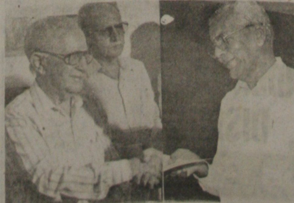
Augusto Franco foi homenageado pelo Sesi.

O Conselho Regional do Serviço Social da Indústria - Sesi, em sessão realizada no dia 28 de setembro último, por unanimidade, aprovou o nome do ex-governador Augusto Franco a ser dado ao Ginásio de Esportes que o Sesi está acabando de construir na cidade de Itabaiana. A proposição foi apresentada pelo diretor regional daquela instituição, Idalito de Oliveira.