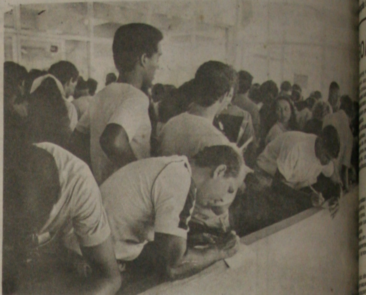
No último dia, mais de 4 mil candidatos se inscreveram para o Vestibular da UFS.