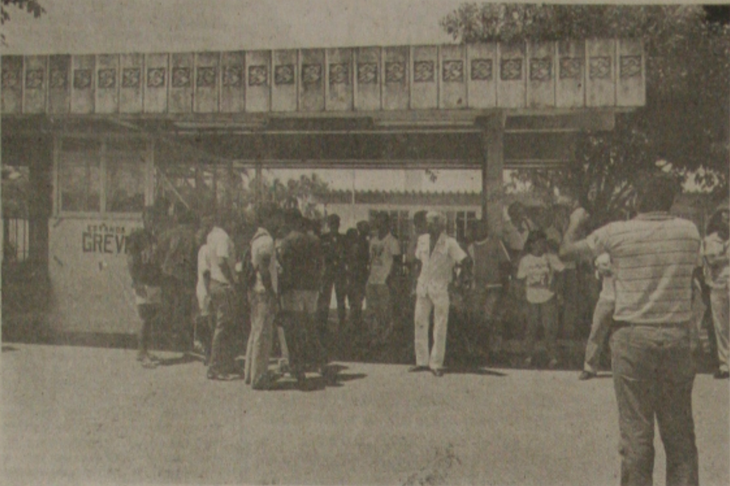
Policiais tentam impedir piquetes na porta da agência do CESES, no Banco do Brasil.

Ao contrário dos dias anteriores, o terceiro dia de greve dos funcionários do Banco do Brasil e do Banco do Nordeste foi marcado ontem por tumultos entre policiais militares e grevistas. Porém ninguém sofreu qualquer violência e os piquetes concentrados na agência centro do Banco do Brasil e no Cesec, no Siqueira Campos, impediram o funcionamento normal nestes dois locais.