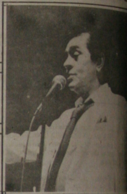
Chico Anysio prepara novos personagens.