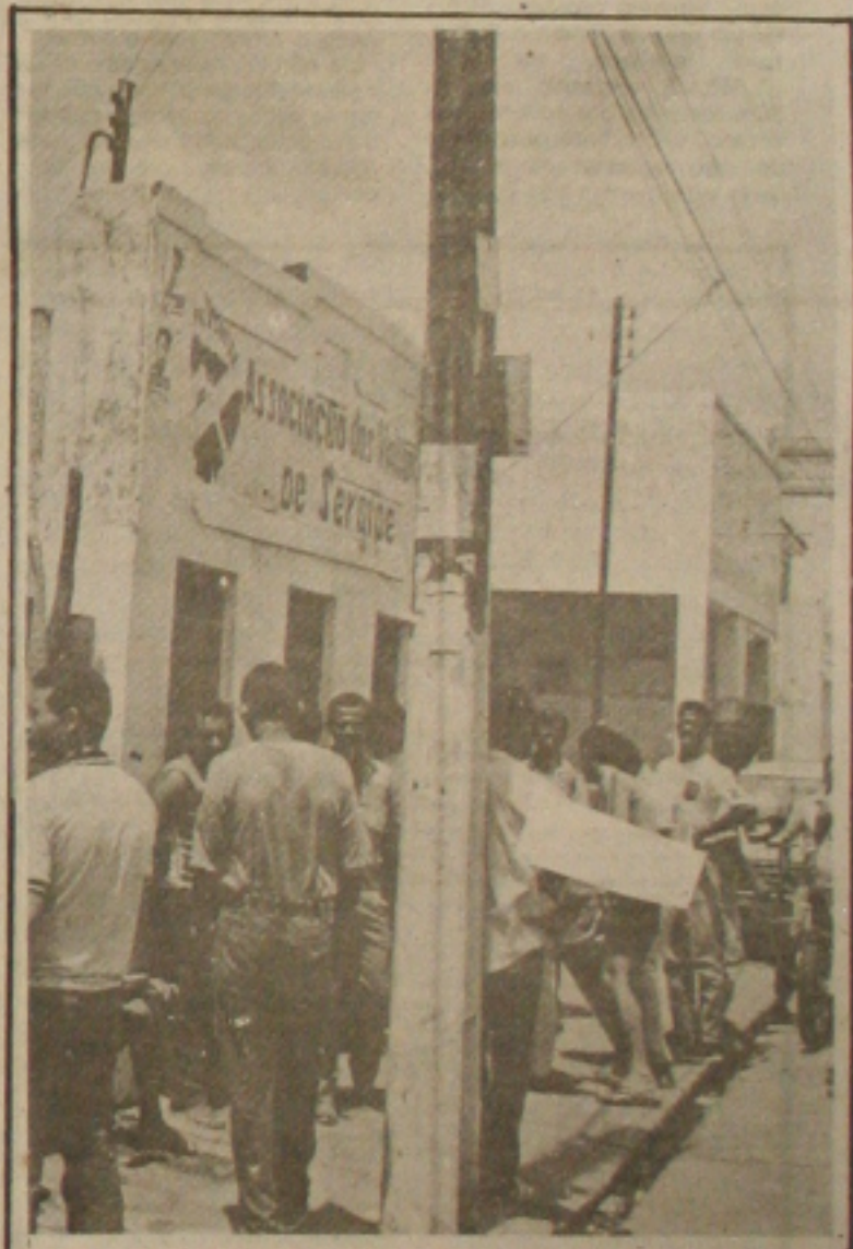
Vigilantes: greve com panfletagem

corregedora do Tribunal Regional Eleitoral, que procurada ontem pela imprensa, confirmou a possibilidade da cassação, "desde que as denúncias de abuso do poder econômico sejam confirmadas nas diligências efetuadas pela Polícia Federal. A representação foi ajuizada quando os prefeituráveis de então estavam se lançando candidatos. (Página 03)