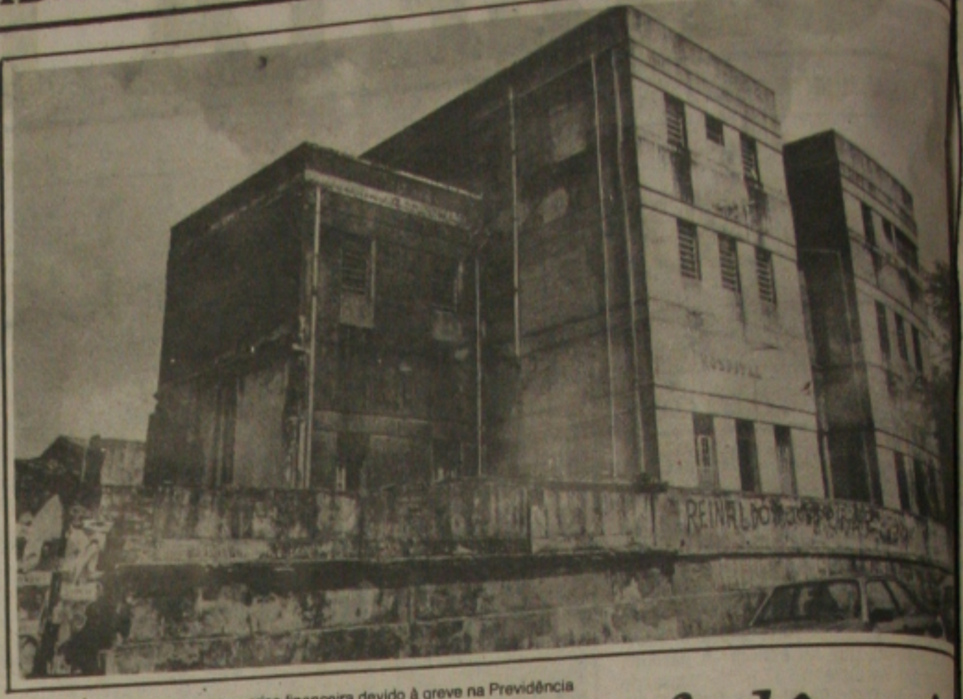
...hospitais que atravessam grave crise financeira devido à greve na Previdência