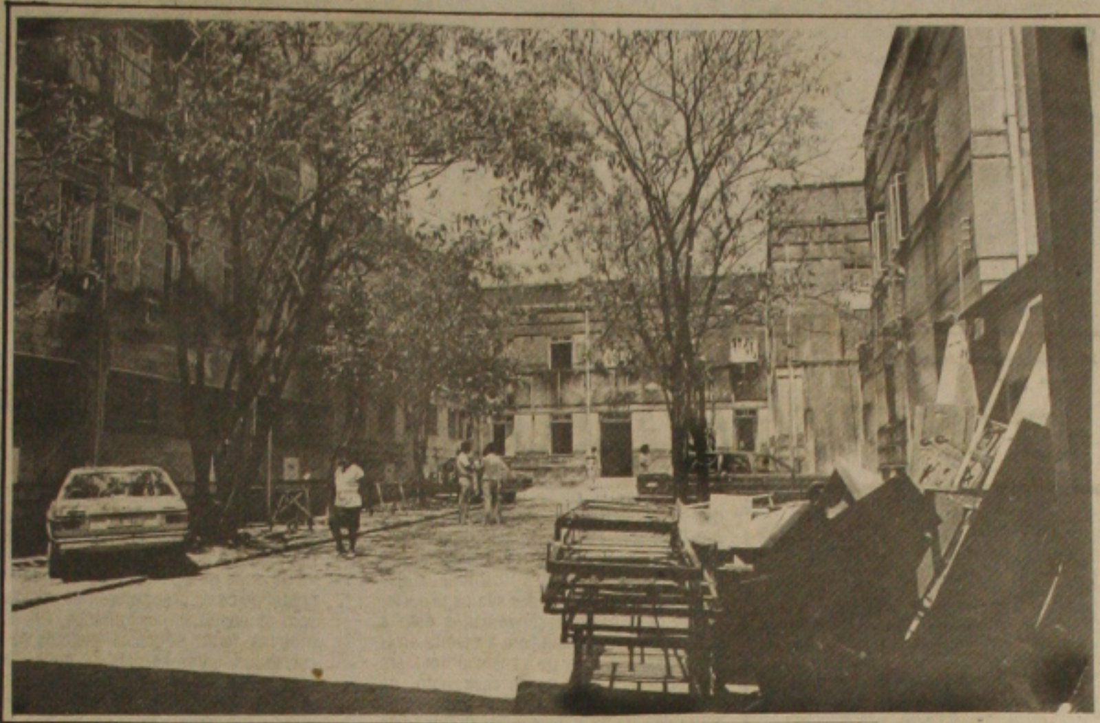
A situação dos hospitais é difícil e alguns deles estão em falência

Brasília, - O Governo autorizou um novo aumento médio de 23,5% para os combustíveis, a partir da zero hora de hoje, apenas oito dias depois de incorporar os preços os 28% correspondentes ao empréstimo compulsório sobre o álcool a gasolina que foi extinto. A gasolina teve um reajuste de 17,67%, passando o litro de Cz$ 198,00 para Cz$ 233,00, álcool foi reajustado em 17,51% e o litro passou de Cz$ 137,00 para Cz$ 161,00, enquanto que o óleo diesel teve um reajuste de 26%, superior a inflação de setembro, elevando o preço do litro de Cz$ 100,00 para Cz$ 126,00. Quando anunciou o fim do compulsório a incorporação do índice de 28% nos preços, o Secretário Geral do Ministério da Fazenda, Paulo Cesar Ximenes, assegurou que o próximo aumento dos combustíveis só seria autorizado em novembro, mas a promessa não foi cumprida. Com o reajuste de hoje o botijão de gás de cozinha, que teve um aumento de 25,4%, passou de Cz$ 905,00 para Cz$ 1.135,00, o querosene de aviação passou de Cz$ 68,34 para Cz$ 86,11 o litro, com reajuste de 26% e o querosene Iluminante passou de Cz$ 104,00 para Cz$ 132,00, com reajuste de 26,9%.