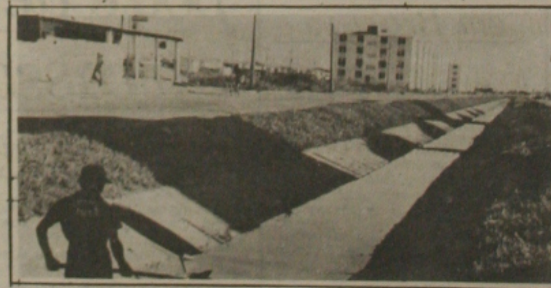
Conjunto Augusto Franco