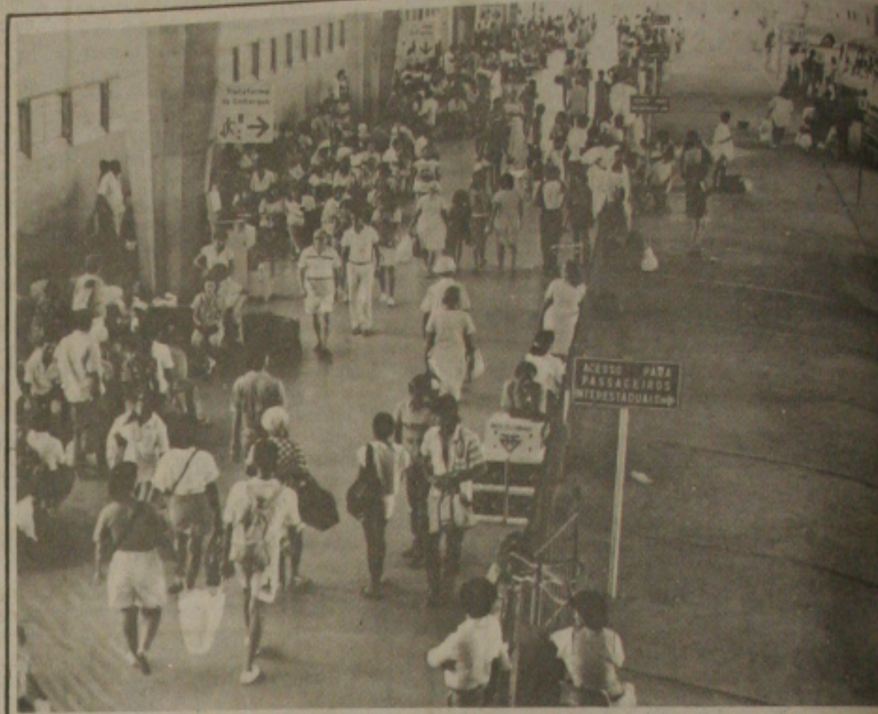
As empresas de ônibus colocaram linhas extras em decorrência do fim de semana prolongado.

Por outro lado, os servidores não estão preocupados com o dia e sim em fazer uma homenagem aos parentes e amigos que também com o que restou de finados, elogiarão a memória do feriado, por um grande significado religioso só é válido quando se celebra.