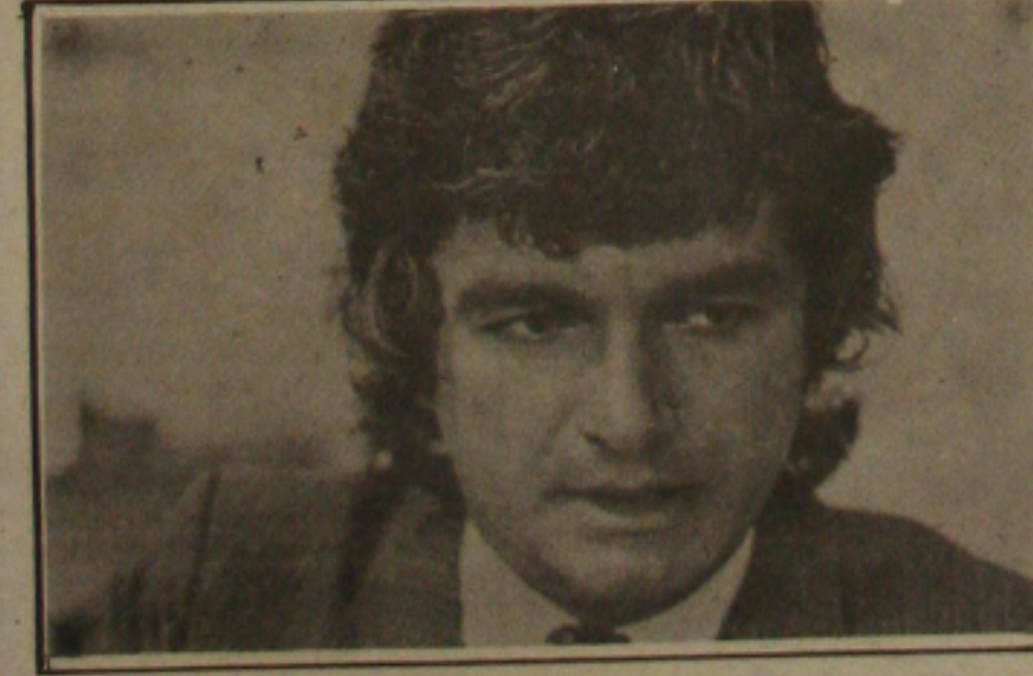
Carlos Alberto acredita que a coligação com o PSB irá até as eleições presidenciais, quando espera que Leonel Brizola seja eleito.

o presidente nacional do PT e ex-governador do Rio de Janeiro e candidato à Presidência da República, engenheiro Leonel Brizola, neste sábado a fim de fazer o comício da Frente Progressista (PSB-PDT-PSDB-PC do B) no Siqueira Campos, confortado por Carlos Alberto Menezes, chefe de chapa de Wellington Paixão, será para consolidar a campanha vitoriosa da coligação e derrotar a força que a candidatura de Paixão, a proporção que o tempo for, chegando e chega a proximidade do pleito. ogador Carlos Alberto Menezes, que o governador Antônio Carlos Valadares já entrou na fase de desespero, porque sente que a vitória é uma questão de tempo e que a ameaça de Paixão, quando sua intenção de transferir os recursos para o interior, quando o médico Lauro Maia perde as eleições na capital.