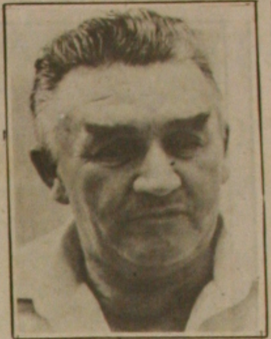
Adenisio, fim da perseguição