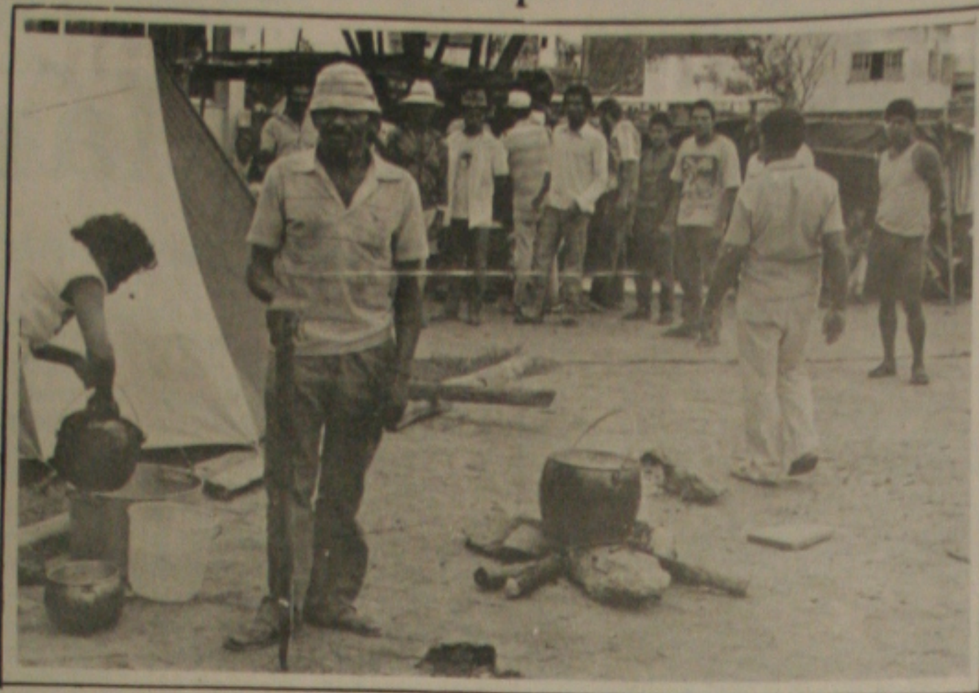
Sem terra acampam em frente ao Mirad

Advogada Av. Rio Branco, 186 - Sala 211 Edif. Ovídio Teixeira Fone: (079) 222-9582