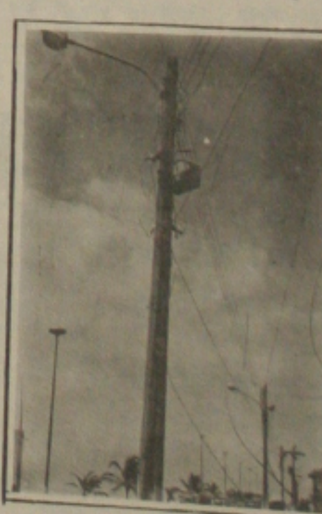
Mudança na rede elétrica