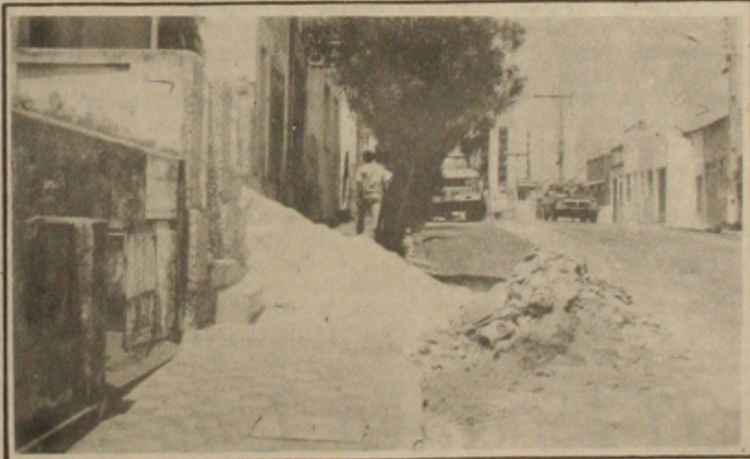
Os responsáveis por entulhos nas artérias da cidade pagarão multas em OTN