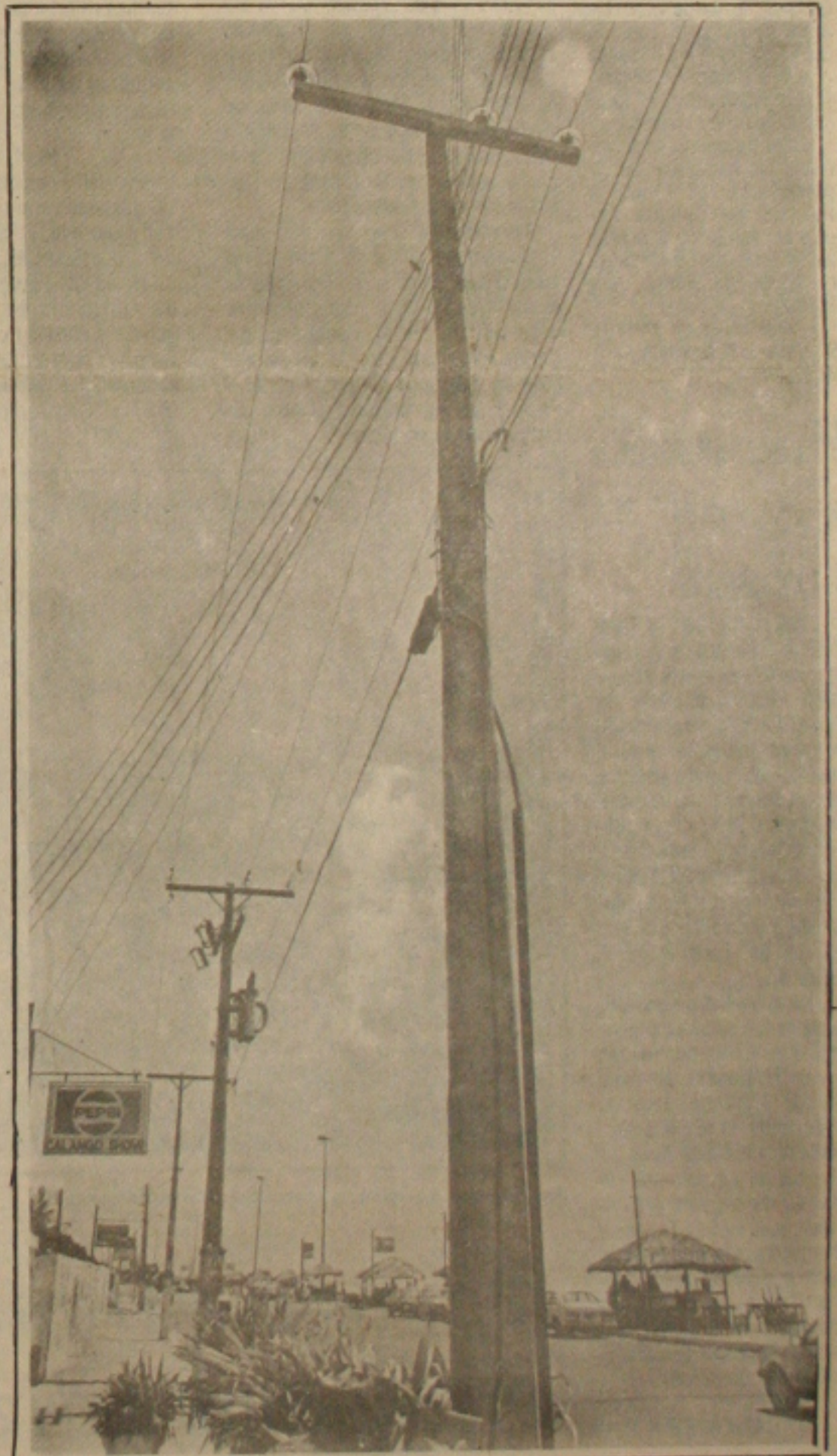
Mudanças na rede de energia elétrica na praia de Atalaia

Agora os técnicos da Energiepe estão fazendo o recondicionamento de 12 quilômetros de cabos da rede primária e 8 quilômetros da rede secundária, além da substituição de 150 postes. (Pág. 4 - 2º Caderno).