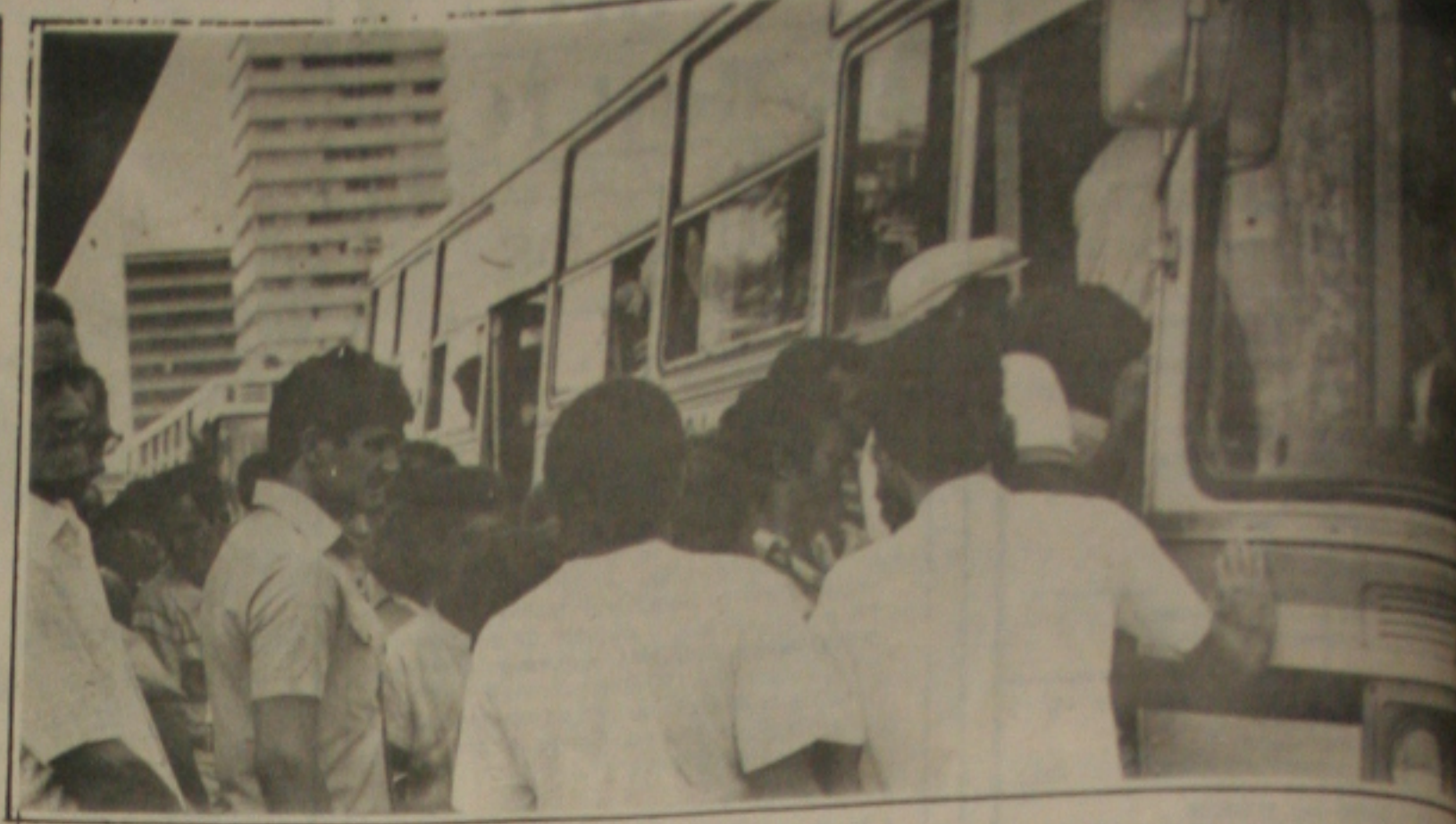
Falta de troco nos transportes pode beneficiar usuário

"A crise brasileira não é de insuficiência de recursos, é de impropriedade das decisões". De Claus Offe, economista alemão, autor de "Problemas Estruturais do Estado Capitalista".