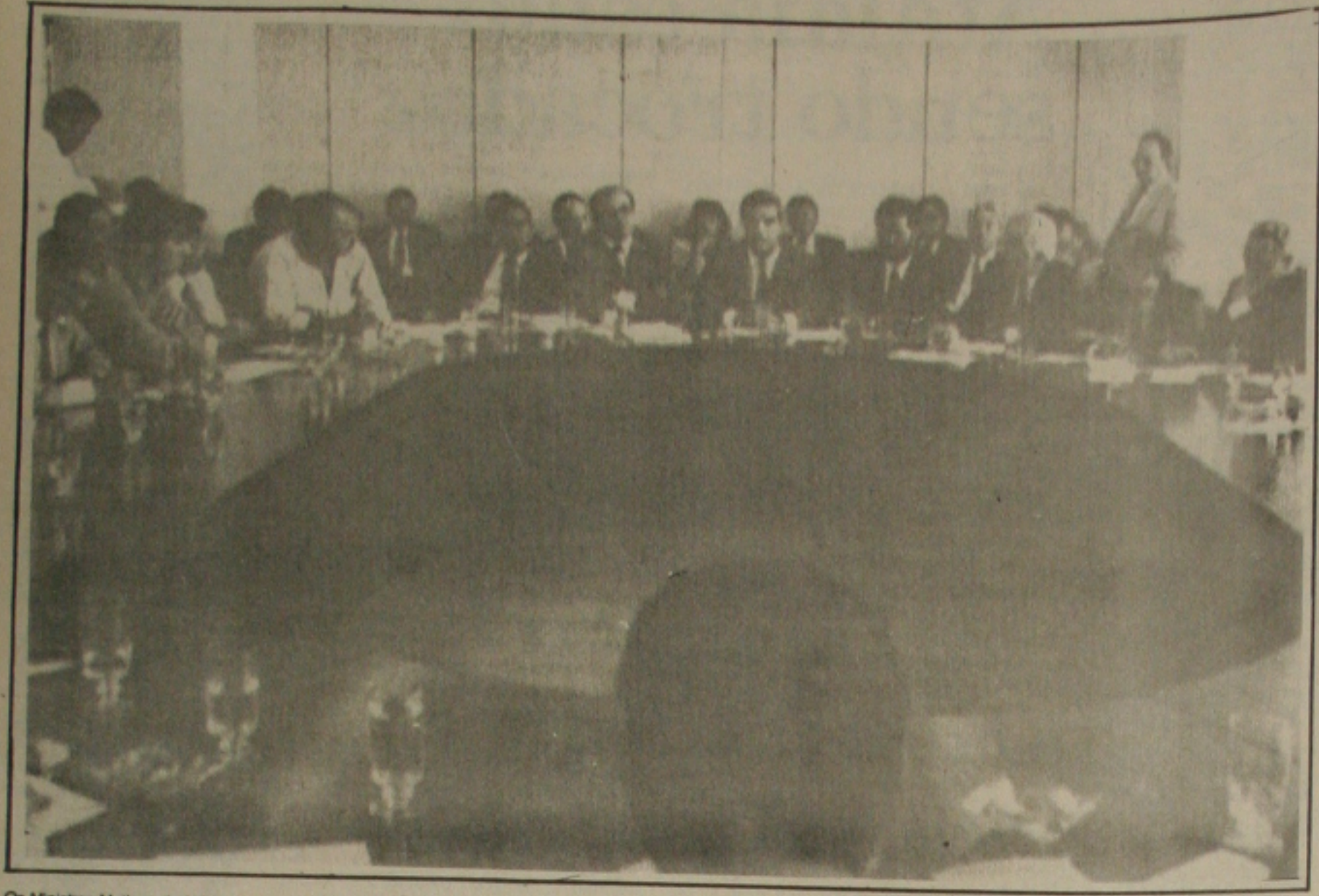
Os Ministros Mailson da Nóbrega e Costa Couto (ao centro) reúnem-se no Ministério do Trabalho com empresários e líderes sindicais para tratar do pacto social.

Brasília. - Até as 22 horas de ontem nenhuma medida havia sido tomada no âmbito das negociações do Pacto Social pelo governo para viabilizar a redução da inflação e a retomada do crescimento do País. Os três pontos que esta estratégia são a política de saneamento das finanças públicas, a política de investimentos. O Ministro explicou aos 20 participantes do encontro que o objetivo das negociações, envolvendo preços e salários, é "desatrelar o sistema econômico passado". Os outros dois pontos da estratégia traçada pelo governo são a redução básica do déficit público e a política monetária, cabendo ao setor de investimentos aumentar a produtividade e estimular o desenvolvimento da economia brasileira. Ao reafirmar que a inflação não é mais da economia brasileira, Costa Couto traçou um quadro francamente otimista do "lado real" da economia, com o crescimento do Produto Interno Bruto e a queda da taxa de desemprego, apesar do perfil de distribuição de renda. A "excelente vitalidade" da economia, segundo o Ministro, estende-se também ao setor externo, agrícola e industrial.