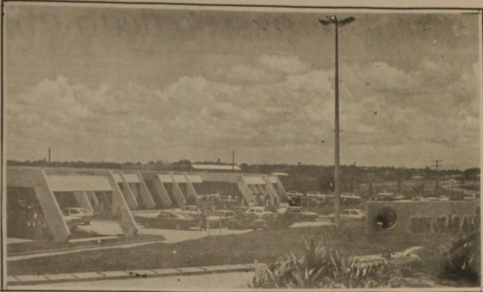
Hospital registra muitos atendimentos