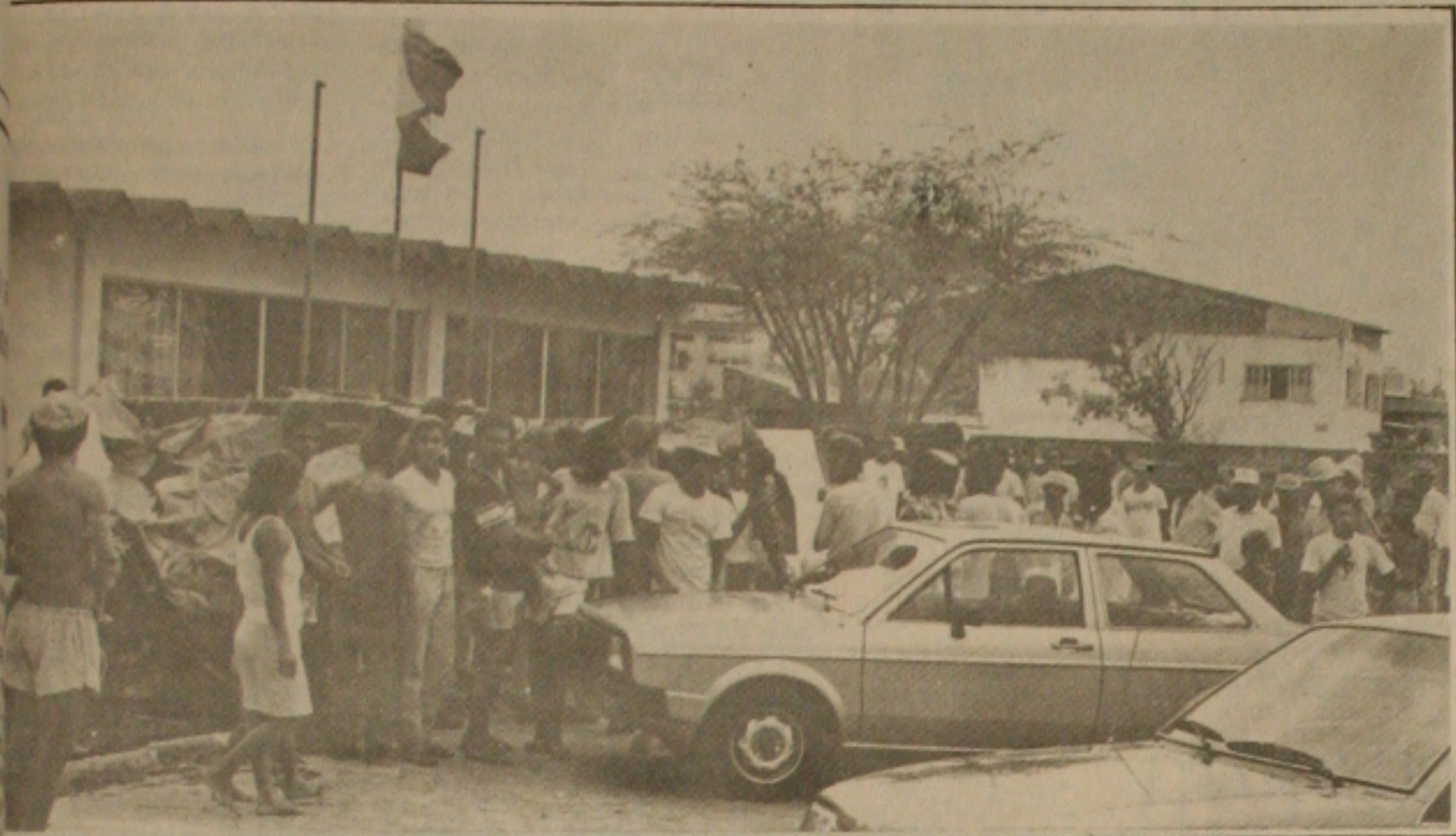
Invadidos invadiram a sede do Mirad e de lá só saem com uma solução para seus problemas.

Trabalhadores, empresários e Governo concordaram que os aumentos devem ser correlatos