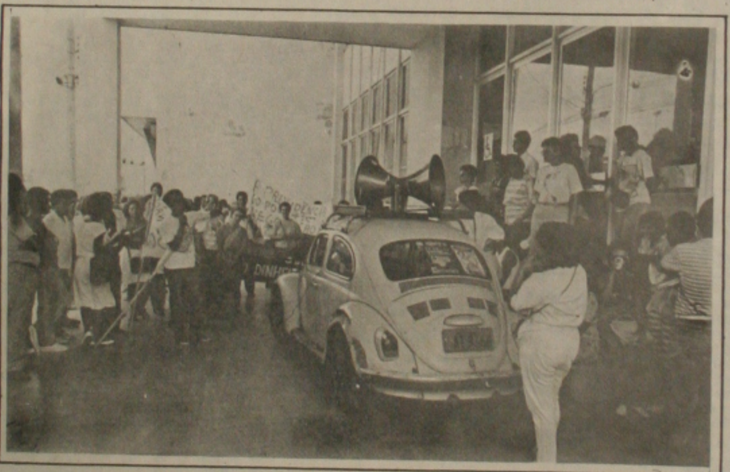
Previdenciários realizaram ato público com as demais categorias.