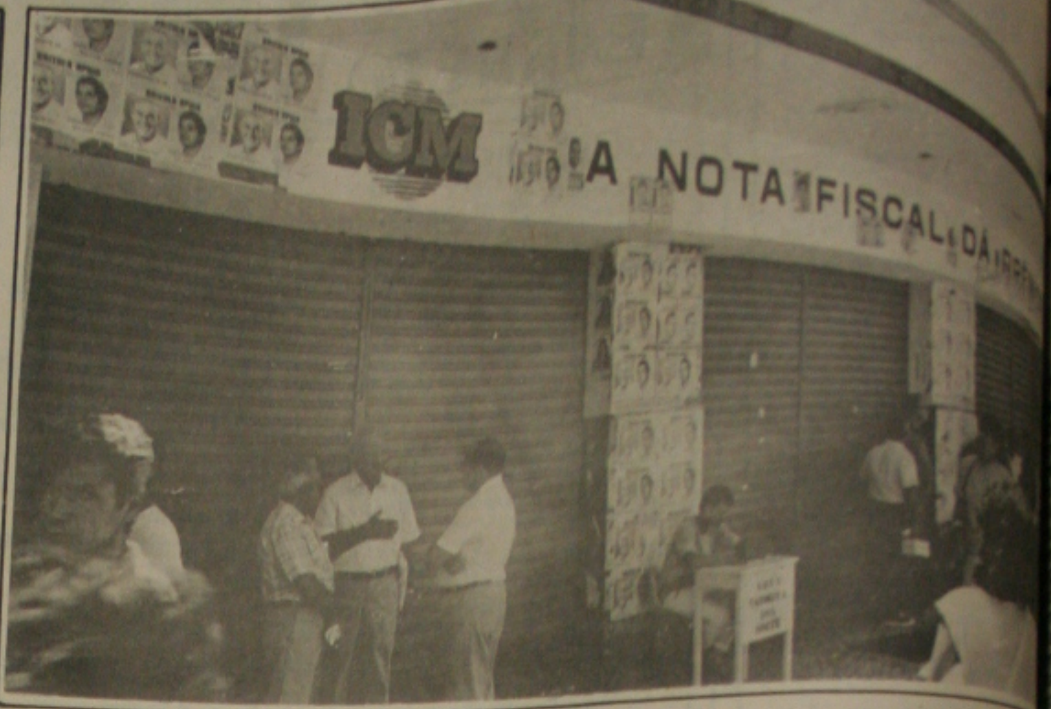
O local de troca do ICM ainda está fechado