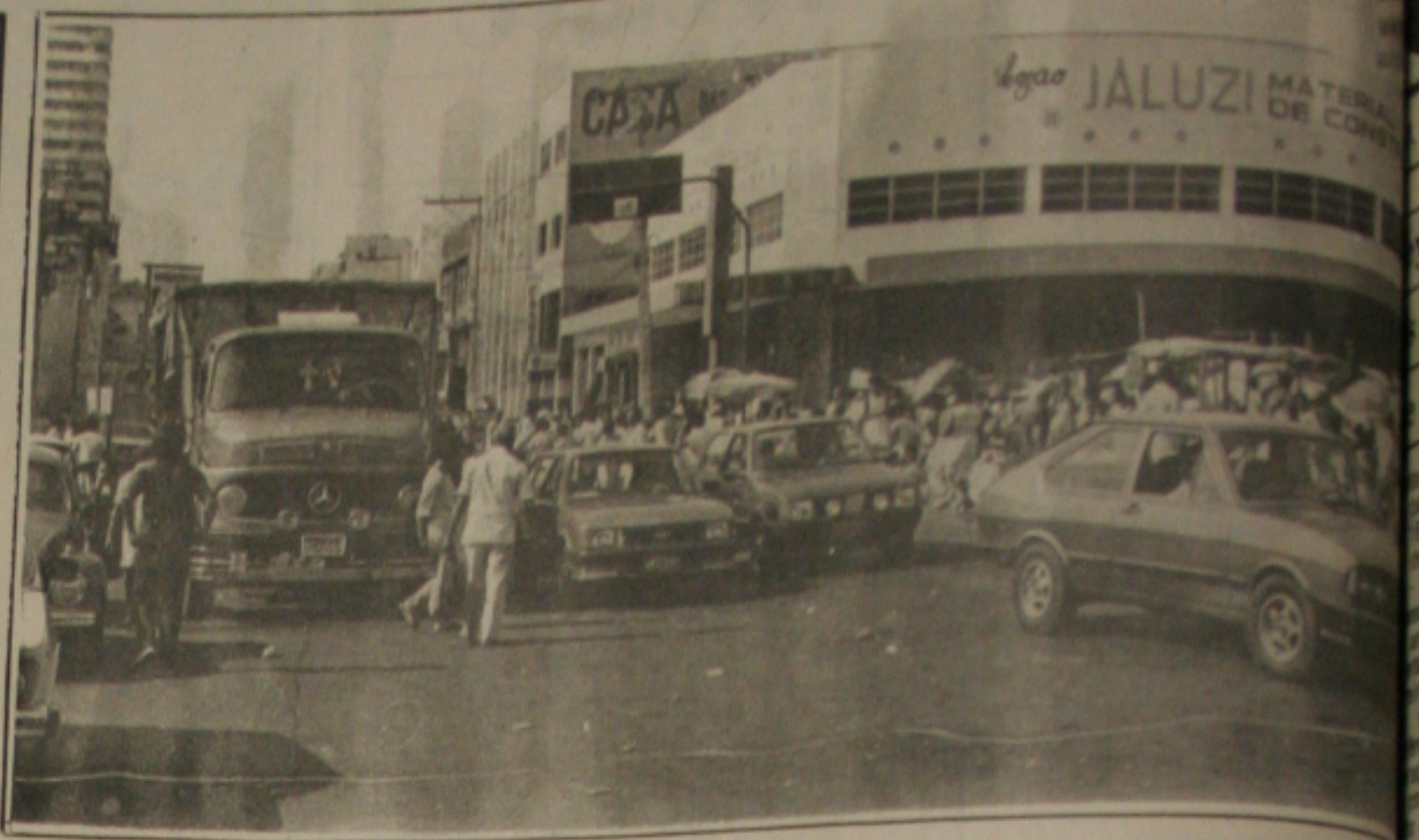
Mesmo com o trânsito mais organizado, o número de multas aumenta

"As coisas devem mudar para que permaneçam as mesmas". Do Conde de Lampedusa, em "Il Gattopardo".