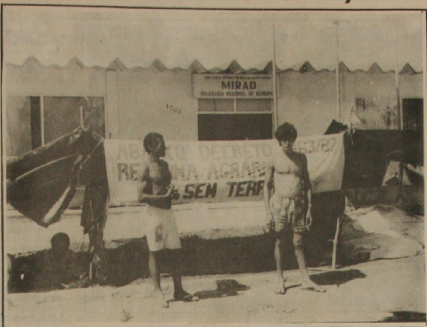
Acampados em frente a delegacia do Mirad, desde a semana passada, os sem terras reclamam solução urgente.

Os sem terras que estão acampados em frente ao Mirad - Ministério da Reforma e Desenvolvimento Agrário de Sergipe -, desde a última quarta-feira, continuam afirmando que somente sairão do local, quando forem assentados na Fazenda Betânia, localizada no Povoado Olhos D'Água, a 18 quilômetros do município de Lagarto e na Fazenda Telha, na cidade de Itabaiana. Eles estão reivindicando também segurança pois alegam que, durante a expulsão em Lagarto, foram agredidos fisicamente pela Polícia Militar, que ainda, segundo os sem-terras, queimaram seus colchões e esteiras, e apresentaram instrumentos de trabalho.