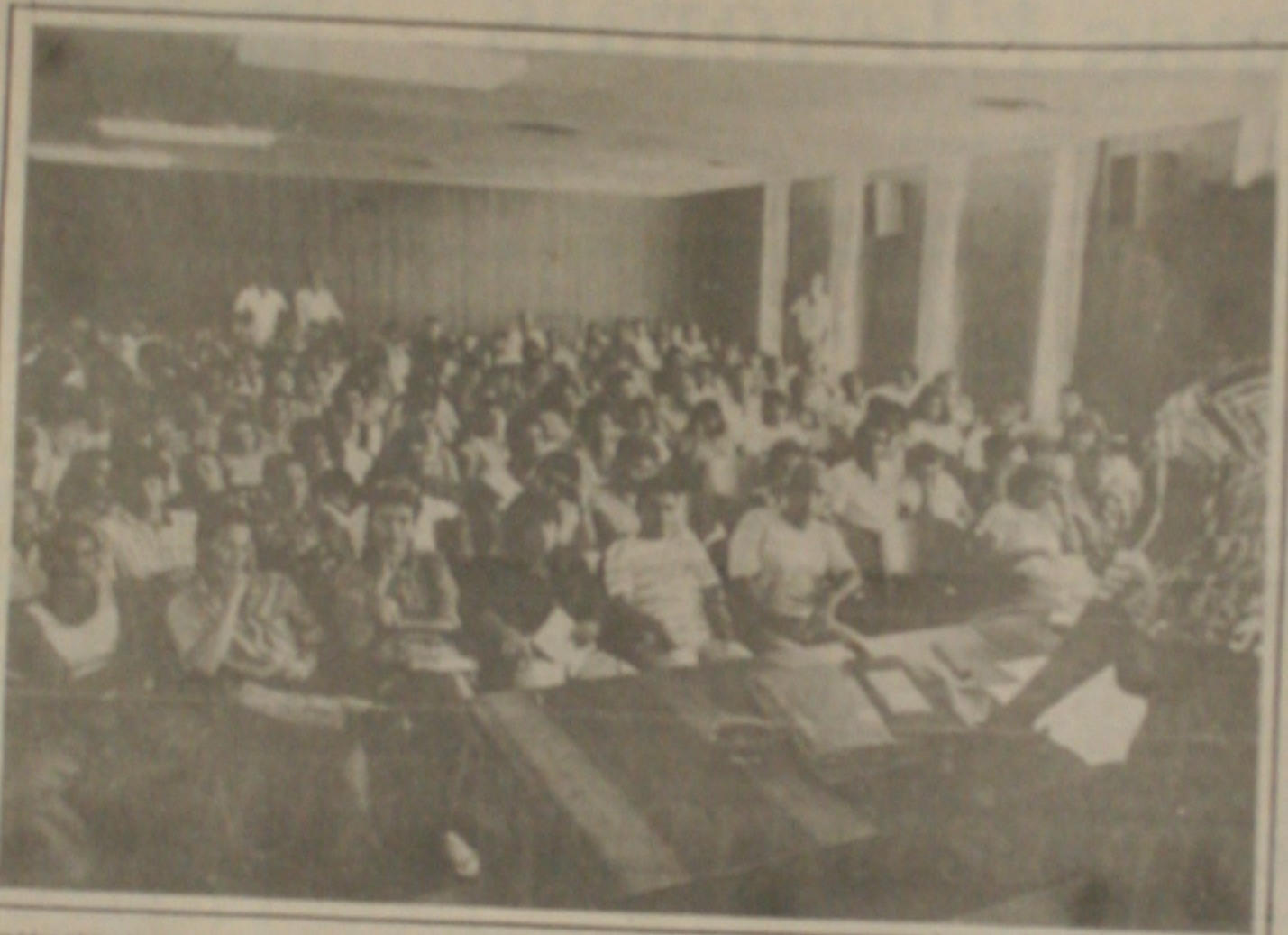
Previdenciários realizam assembleia geral e rejeitam contra proposta do governo.

Ele revelou que a greve dos professores e técnicos administrativos será mantida até que o Governo Federal responda às reivindicações dos servidores.