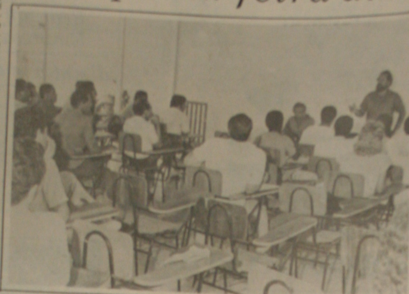
Universidade Federal de Sergipe deflagra greve de 24 horas.

As atividades da Universidade Federal de Sergipe estarão paralisadas nesta quarta-feira. A greve dos professores, estudantes e técnicos, organizada pela UFS, será de apenas 24 horas, segundo o comunicado divulgado pelo reitor da instituição. A decisão dos técnicos administrativos foi tomada apenas pela manhã durante a reunião geral realizada no auditório da reitoria com a participação de aproximadamente 200 servidores, em atendimento ao movimento dos estudantes durante a greve já assegurada desde a semana passada.