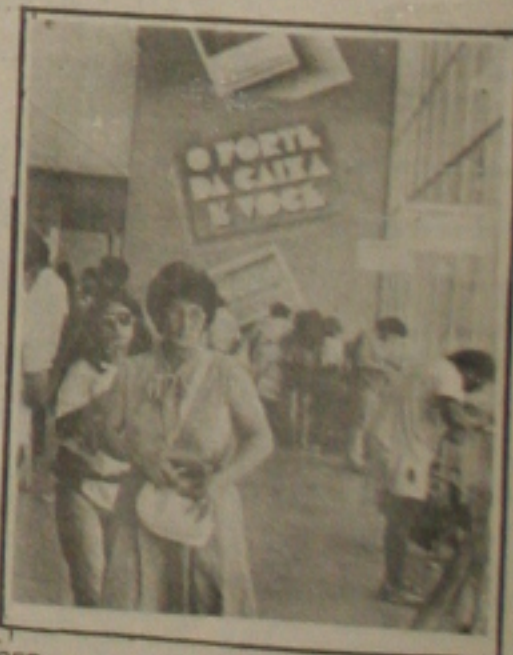
CEF: movimento fraco

Em virtude dos juros baixos, os propensos mútuos preferem investir seu dinheiro em outro negócio e espe-