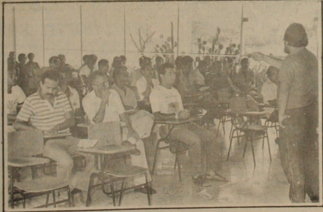
Pessoal da UFS, em reunião, resolve entrar em greve por 24 horas.