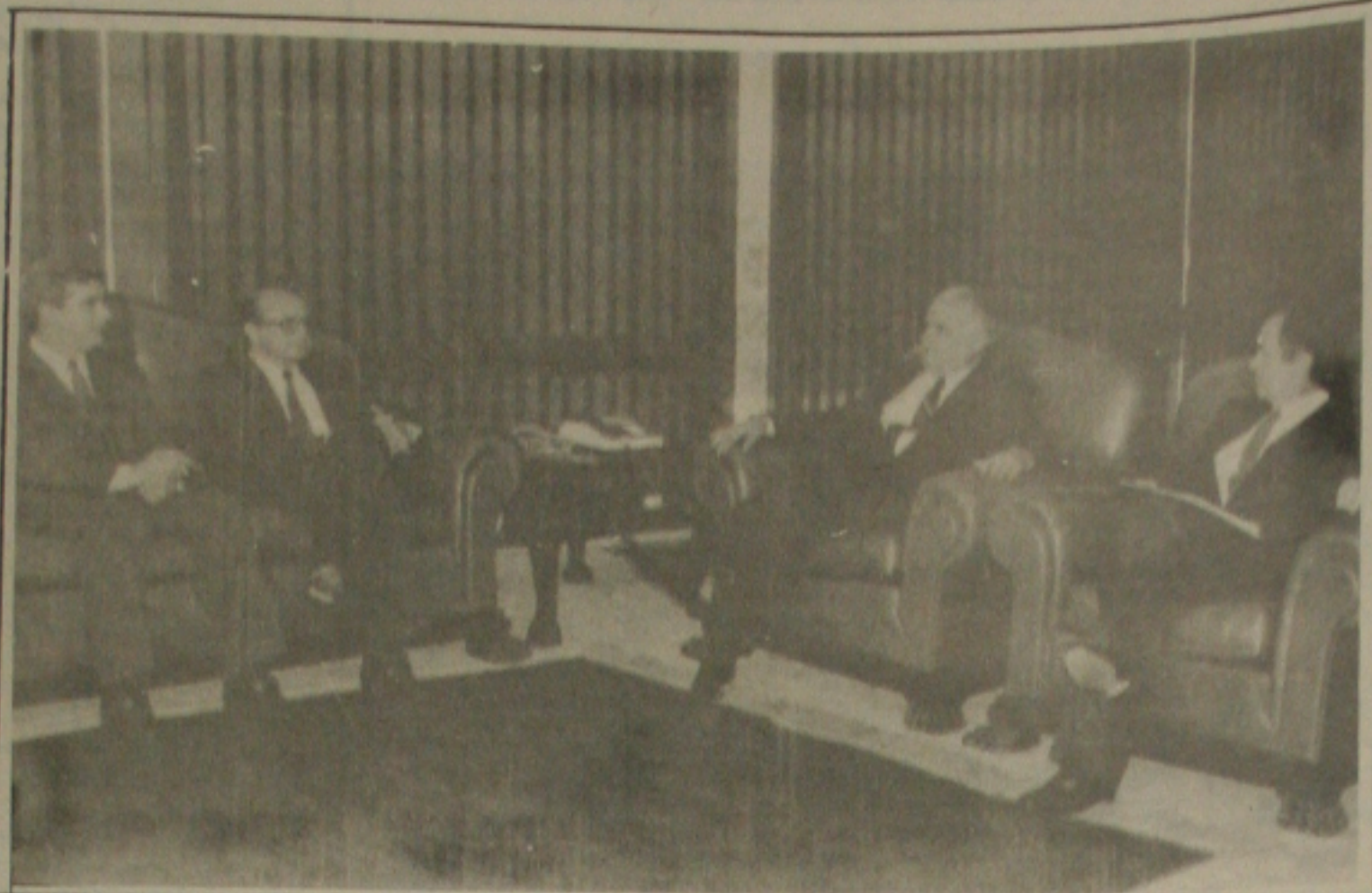
O Presidente José Sarney reuniu-se ontem com os Ministros do Planejamento João Batista de Abreu, da Fazenda Mailson da Nóbrega e do Gabinete Civil Ronaldo Costa Couto.