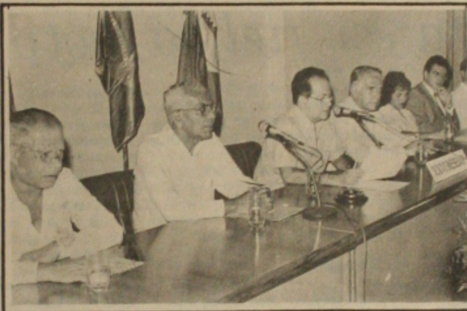
O senador Albano Franco, presidiu a solenidade de abertura da Reunião Nacional Senai/Empresa.