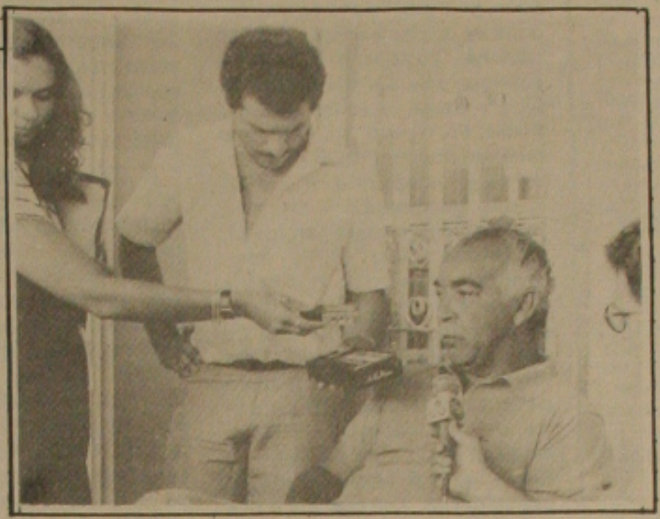
Paixão quer um governo participativo