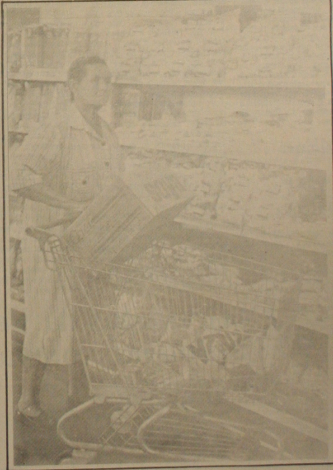
Aracajuano não acredita na tabela do Pacto

O consumidor sergipano não está acreditando no controle de preços a partir do pacto social. No meio da semana o governo liberou a relação dos produtos básicos que terão seus preços controlados, mas para os sergipanos os preços apresentados na lista originária do pacto social estão bem defasados e são diferentes dos que estão sendo praticados pelo comércio local. O consumidor apresenta como principal produto onde os preços da lista divergem dos praticados, a carne bovina. Enquanto a população reclama. (Pág. 4 - 2º Caderno).