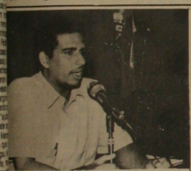
Paixão quer um governo participativo