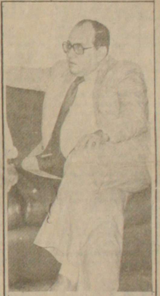
Teixeira explica Caderneta