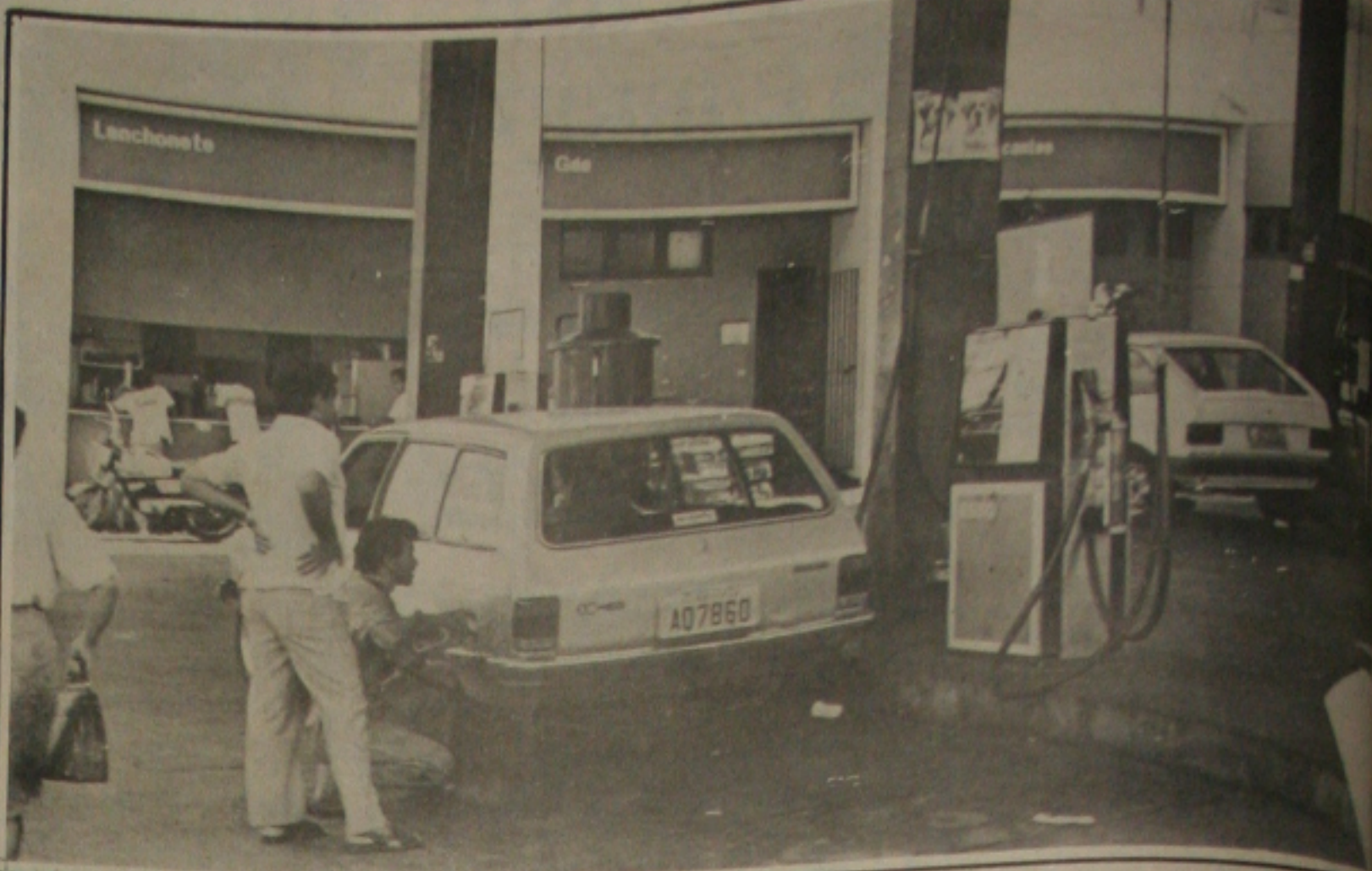
Alcool terá uma nova proposta para sua manutenção como programa viável.

De José Reynaldo Tavares, Ministro dos Transportes.