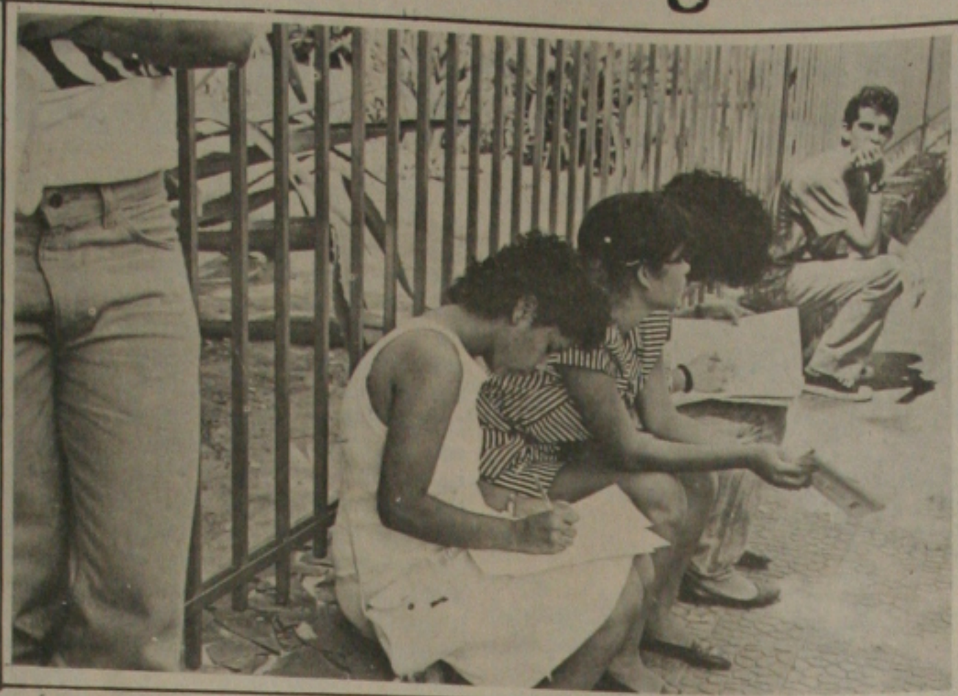
Estuantes se preparam para o Vestibular