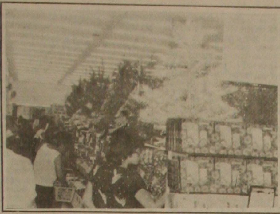
Arranjos natalinos: preços não muito convidativos.