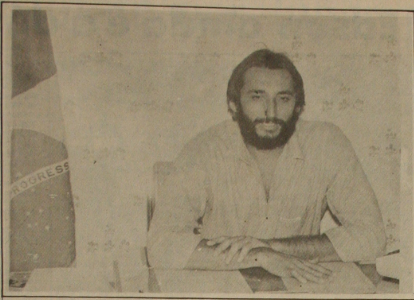
Néviton esclarece o crime do estudante praticado por soldado