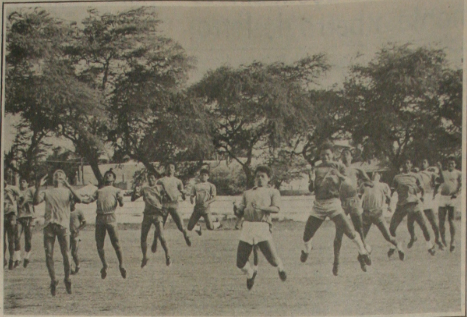
O elenco do Sergipe já tem reforços para a temporada de 89