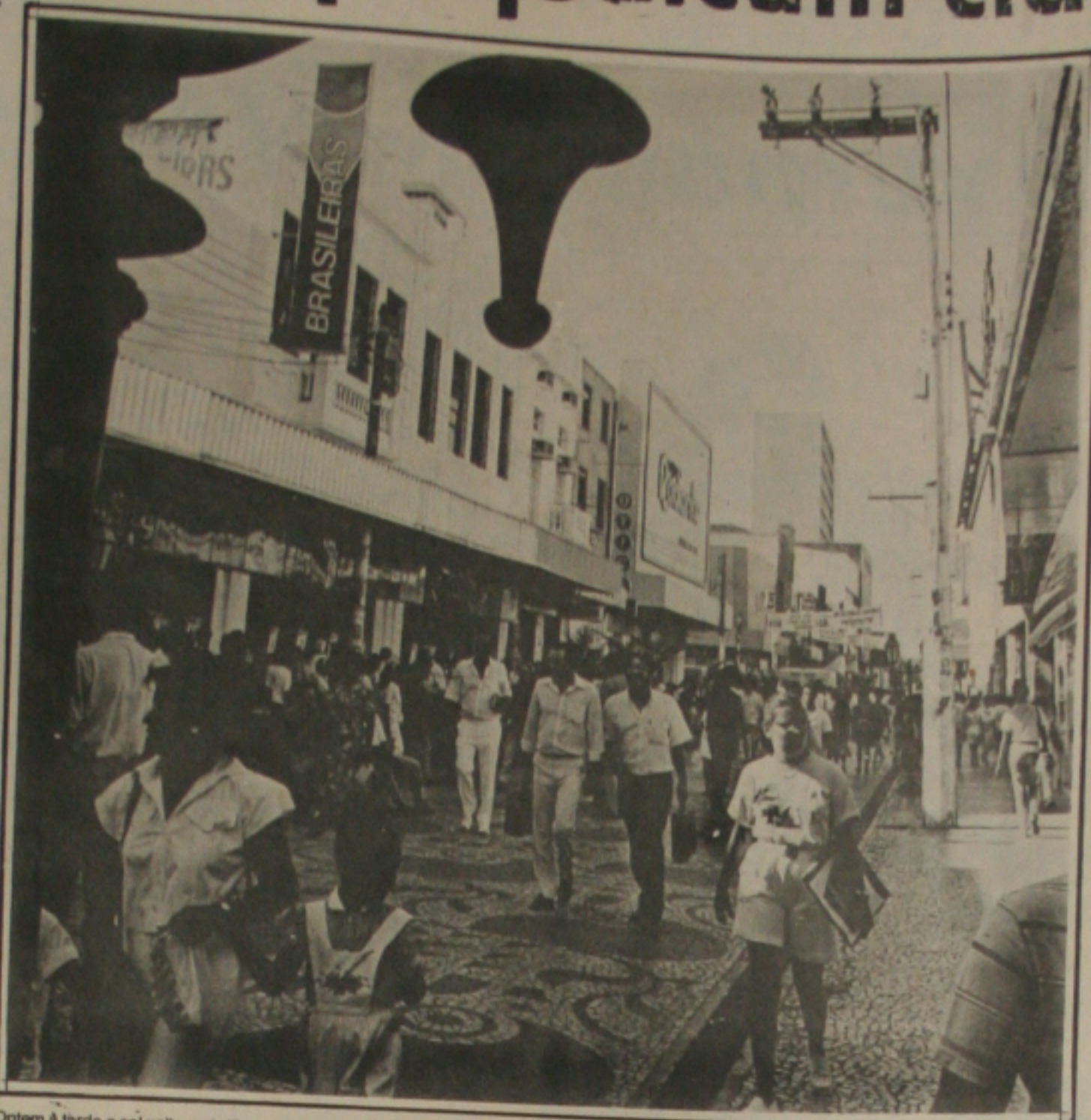
Ontem à tarde o sol voltou a brilhar e o Calçadão teve uma movimentação muito grande.