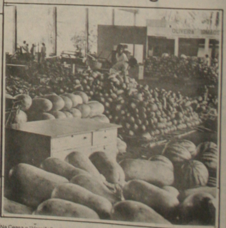
Na Ceasa o "Varejão" vai liquidar atravessadores

Para o diretor Geral do Ceasa, a idéia do "Varejão" não é nova, e desde que assumiu o cargo que vem pensando em implantá-lo. No São João foi feita a primeira experiência com sucesso, agora fez com que a idéia se tornasse realidade.