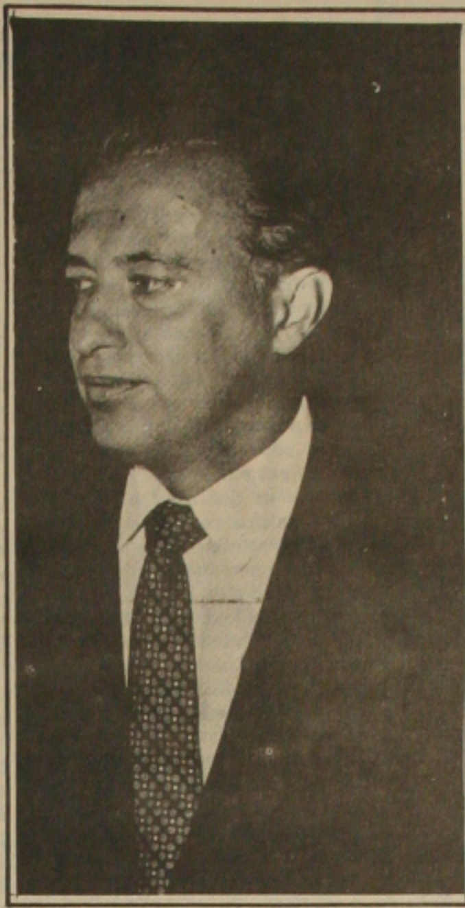
Paixão vai bater na porta do Olímpio Campos... e Valadares diz que quer governar com todos.