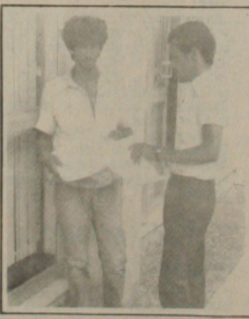
Foi grande a procura por cartelas ontem, no calçadão.

Para quem já está acostumado hoje é dia de festa no Batistão. Para quem ainda não participou de nenhum bingo a expectativa é que participando hoje como a primeira vez, não vai ficar fora de mais nenhum. É que o bingo tem um poder de atração sobre o torcedor e o adquirente das cartelas, pois com apenas C$ 3 mil, é criada a oportunidade de se ganhar um prêmio de mais de C$ 7 milhões.