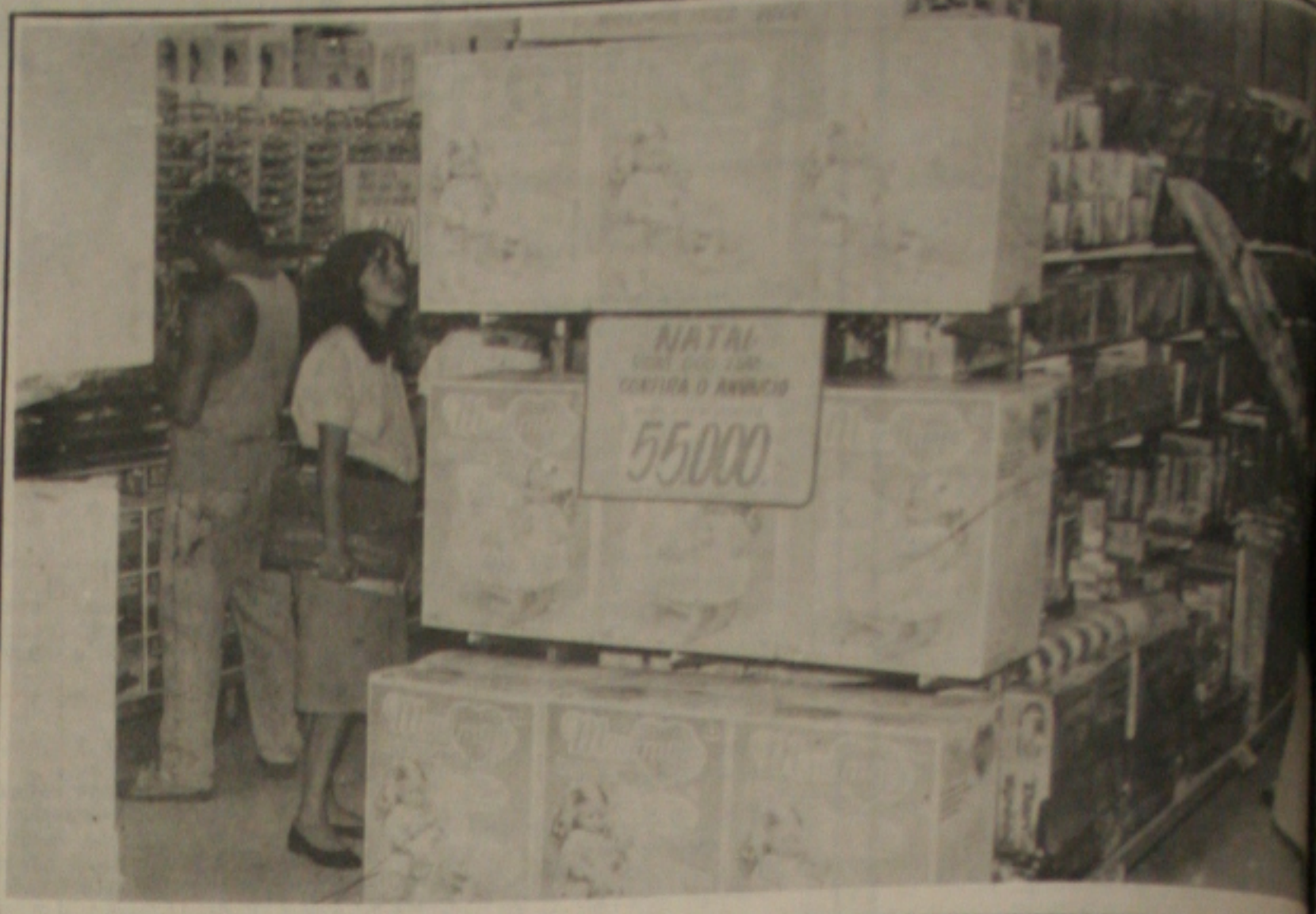
As vendas no comércio têm melhorado muito nestes primeiros dias de dezembro

"Quanto custa uma banana no Brasil? Nenhum brasileiro tem a resposta. Nem o Ministro da Fazenda". Do "The Wall Street Journal", em nota de primeira página, edição de quinta-feira.