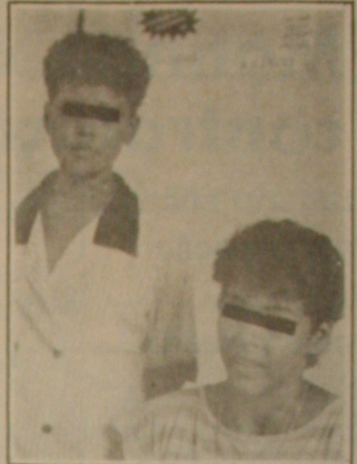
As duas menores também foram presas