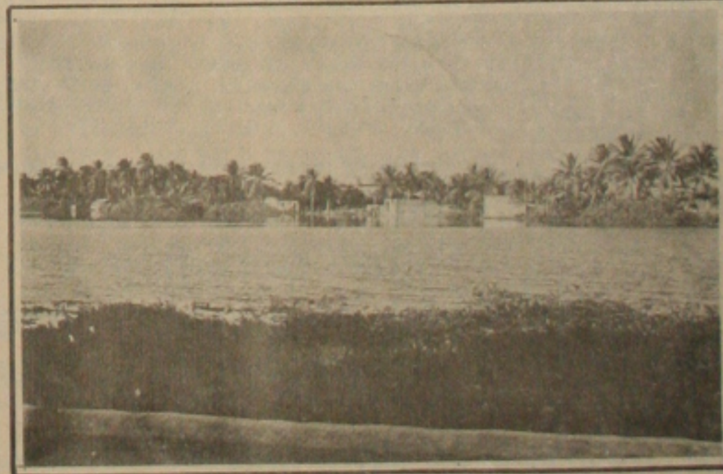
Os mangues podem desaparecer com os prédios (Página 2)