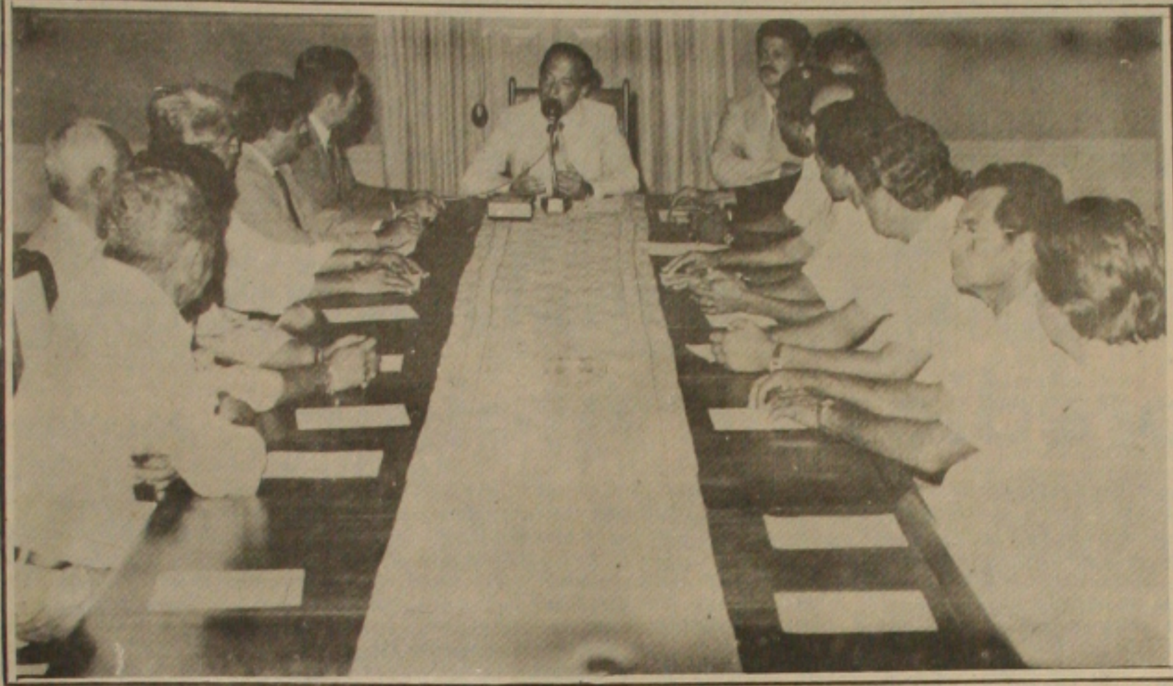
Na reunião do governador com os prefeitos do PL e PDS, foi lembrada a prioridade para o interior.