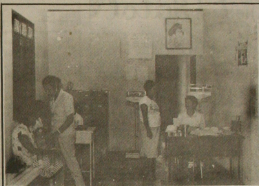
A Maternidade Dra. Maria do Carmo Nascimento Alves, também funciona como Posto de Saúde.