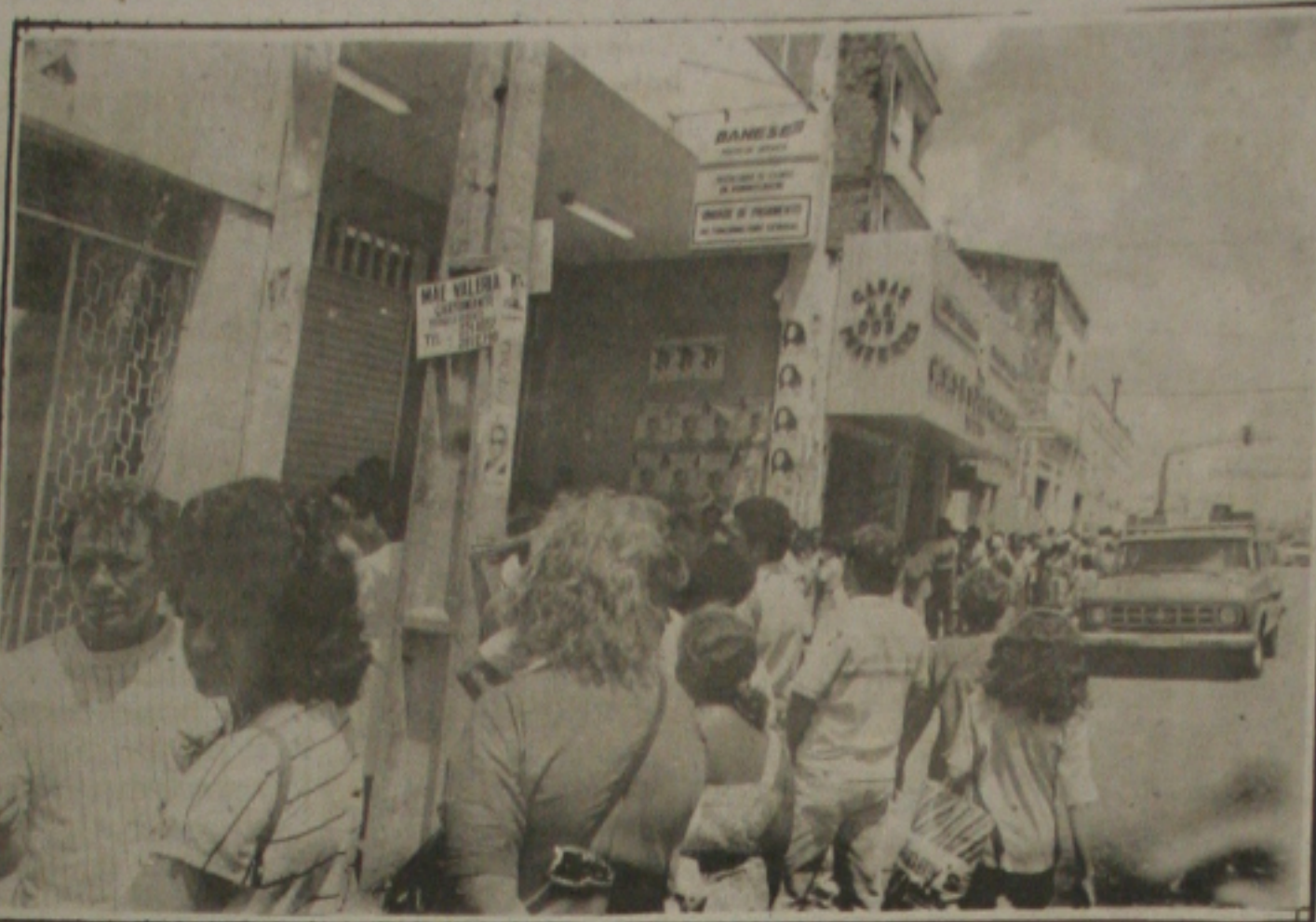
Servidores do Estado formam uma extensa fila, na porta do Banase.

A banda de música da Secretaria de Cultura do Município animou a inauguração e arrastou uma multidão para a rua deputado Antônio Torres. A música "Viana, Aracaju Pré Valer" foi cantada repetidas vezes, por todos os moradores. A rua se transformou numa só família e todos festejaram a ação da Prefeitura de Aracaju que realizou o que as outras administrações municipais prometeram.