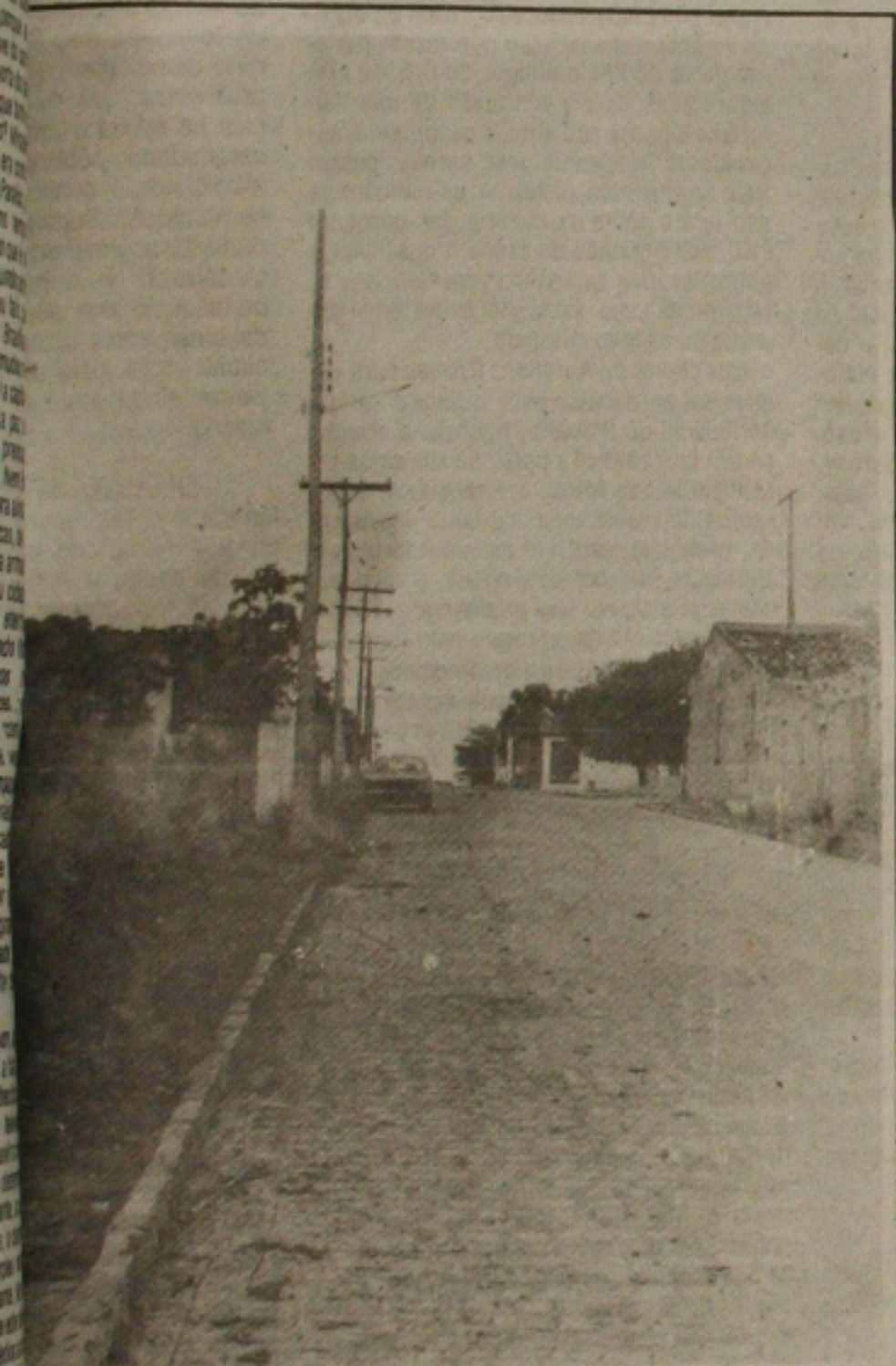
A cidade conta hoje com energia elétrica e iluminação pública.

Nesta década, pouquíssimas cidades deste País tiveram a sorte de Pinhão, fundada em 25 de novembro de 1953, pelo Decreto Lei 525-A, assinado pelo então Governador Arnaldo Garcez.