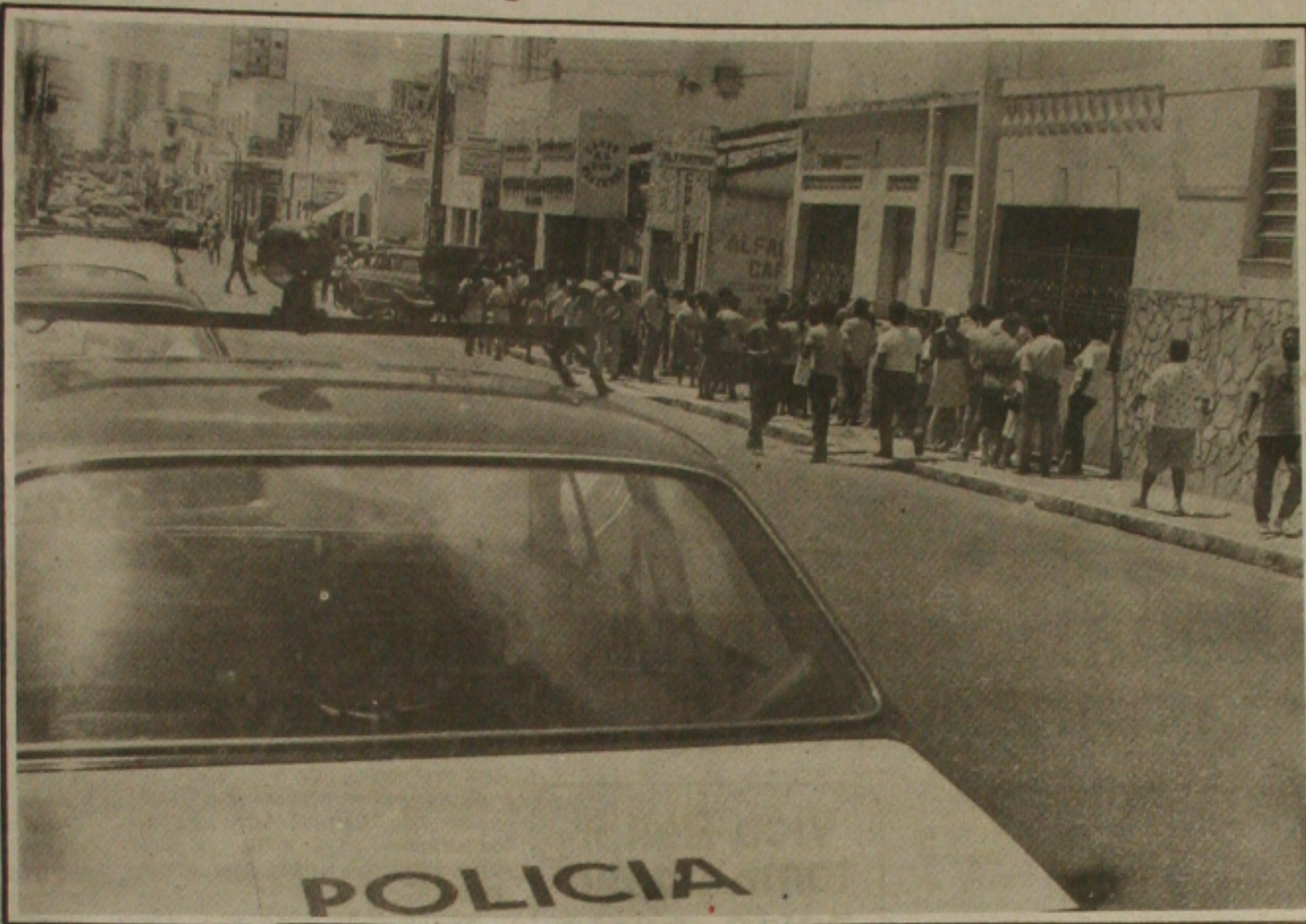
No pagamento do 13º salário, ontem, na rua de Capela, foi preciso a intervenção da Polícia.