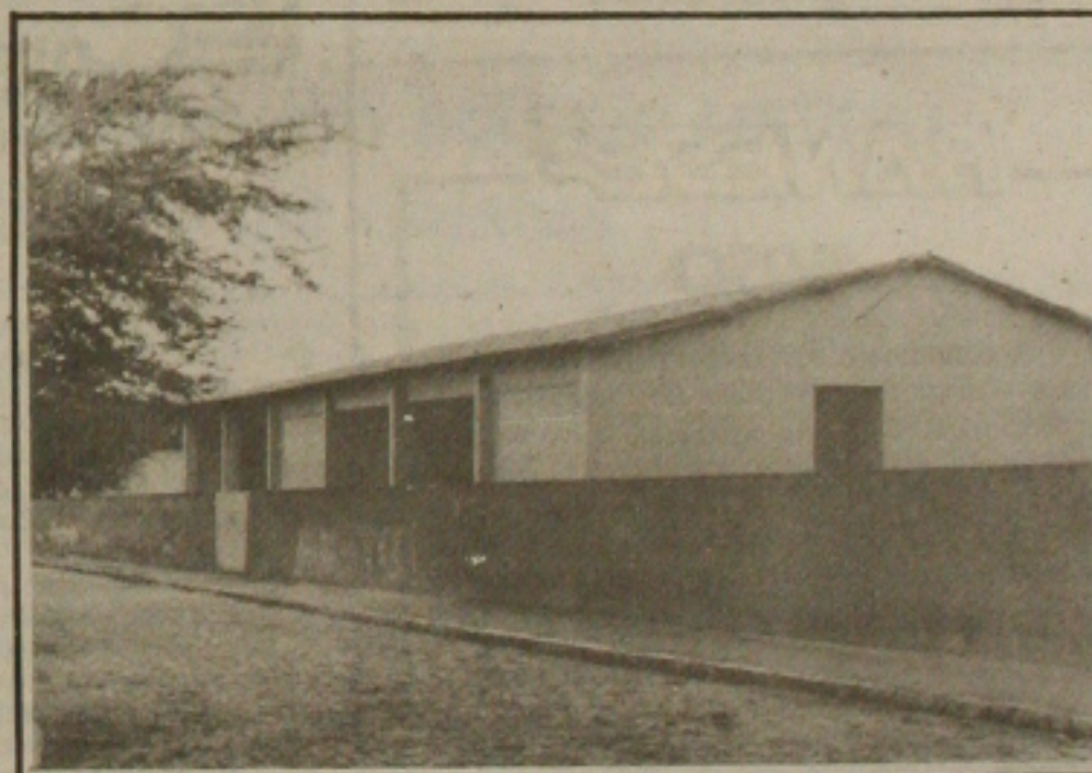
Escola Municipal de Pinhão.