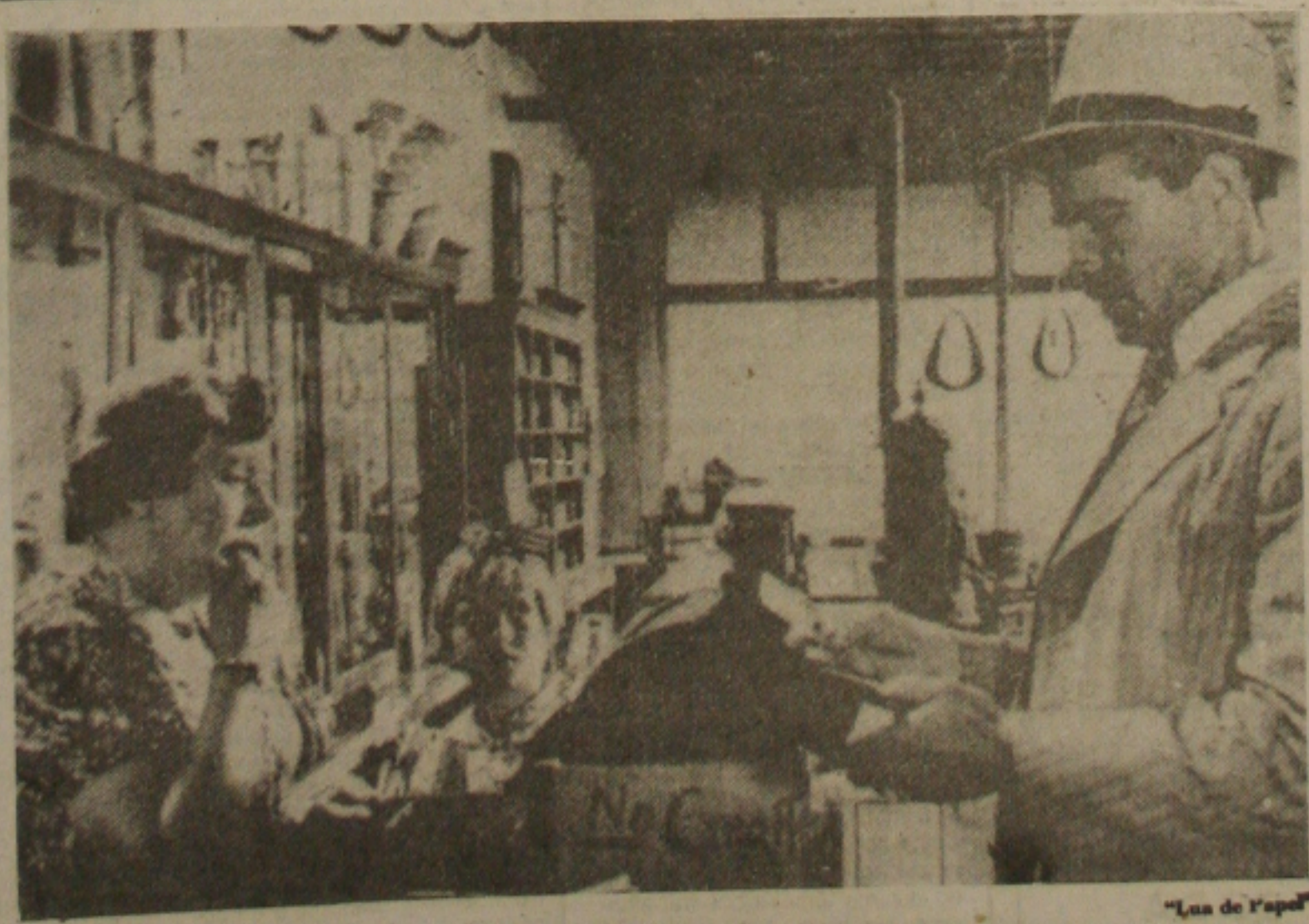
"Lua de Papel"