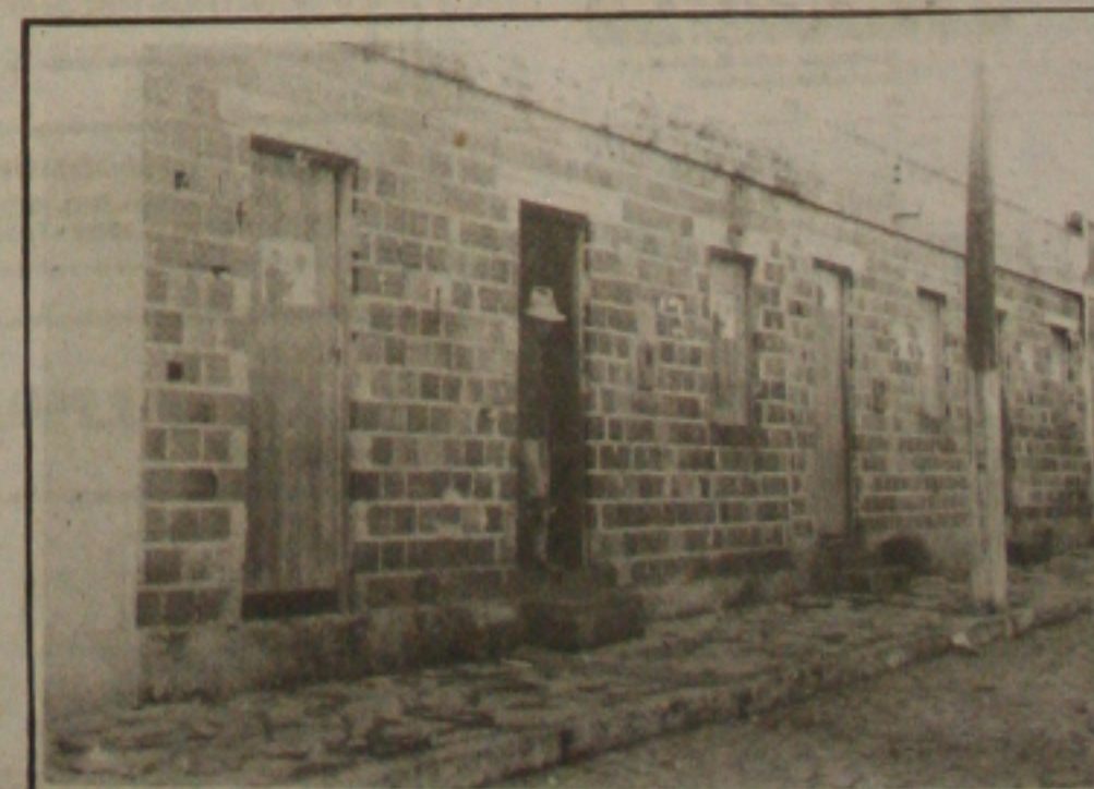
Fachada padronizada de algumas das centenas de casas que foram reformadas com materiais doados pela Prefeitura Municipal de Pinhão.