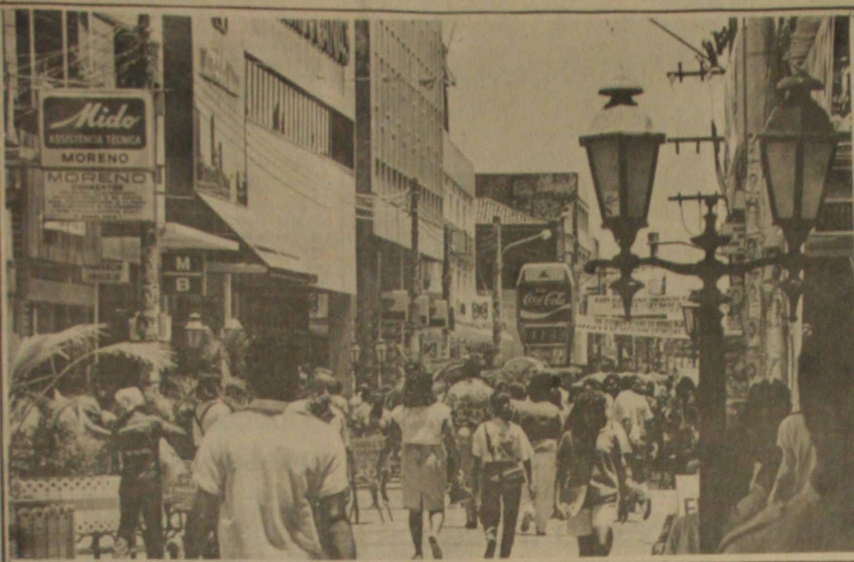
O Calçadão teve ontem um grande movimento e ficou praticamente intransitável.

Quando os jogadores de futebol gozam mais um dia de férias, o noticiário esportivo termina por focar nos cartolas. Eles sim, não tiram férias e principalmente para quem vivem mais de vinte dias antes do acontecimento do jogo brasileiro, que é considerado para a sucessão presidencial na Confederação Brasileira de Futebol. O jogo em si já desperdiça o tempo, mas quando se trata de uma eleição que se determina a maneira de rota do esporte popular do Brasil, a realidade pega fogo e não para de chegar ao povo, pois, o que interessa é simplesmente a vitória. Quem realmente tem chances de chegar na presidência? Ricardo Teixeira parece ser o favorito e o líder da tendência dos jogadores de 19 Joz 26 privilegiados eleitores, entre os jogadores de futebol. O presidente da Federação Sergipana, Alceu Alves, que não caindo dentro da esfera de Otávio Guimarães. (Página 12)