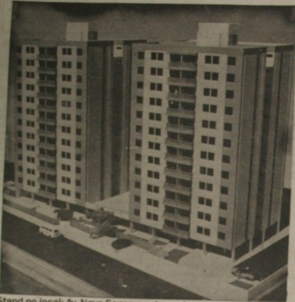
Stand no local: Av. Nova Saneamento - próximo a Av. Hermes Fontes

O clube é um clube de verdade. Com piscina para adultos para crianças, quadra esportiva, sauna, um grande bar, amplo salão de festas, copa, cozinha e sanitários. O Condomínio Bahia Sol será construído em 5.000 m 2 de área. Agora, você sai do trabalho e vai direto para o clube, em vez de deixar a família esperando em casa.