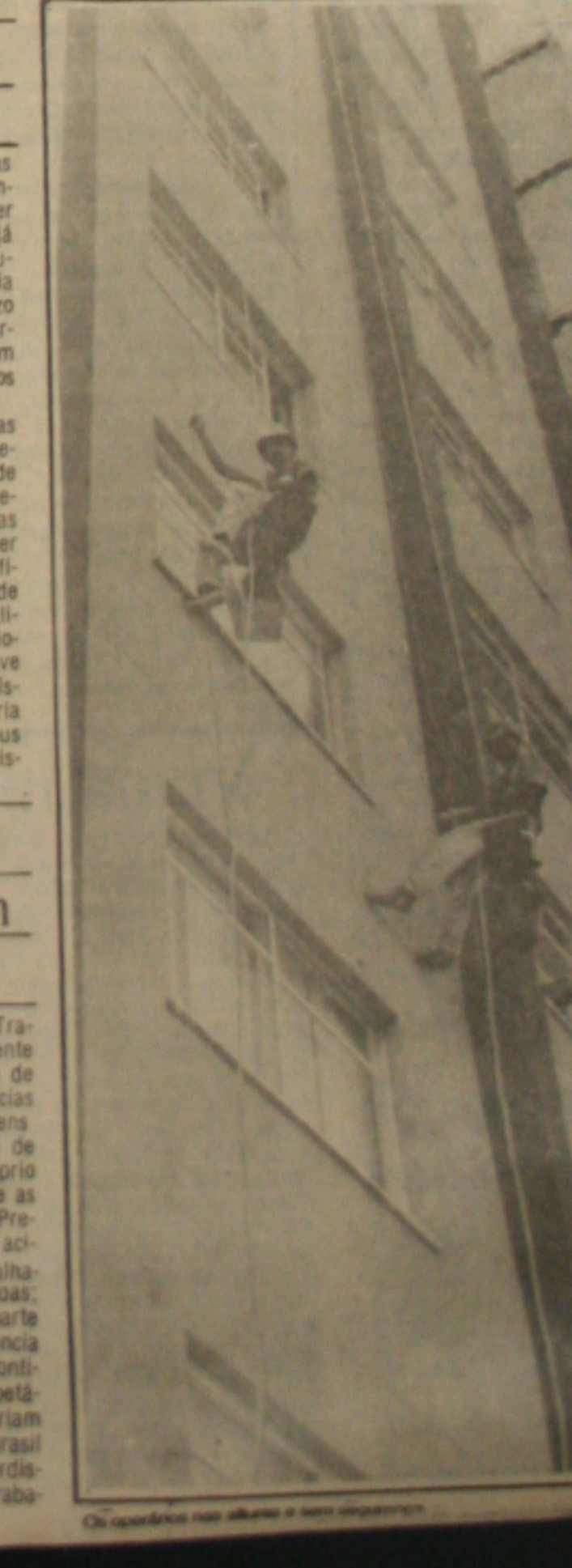
Os operários não sabem o que aconteceu.