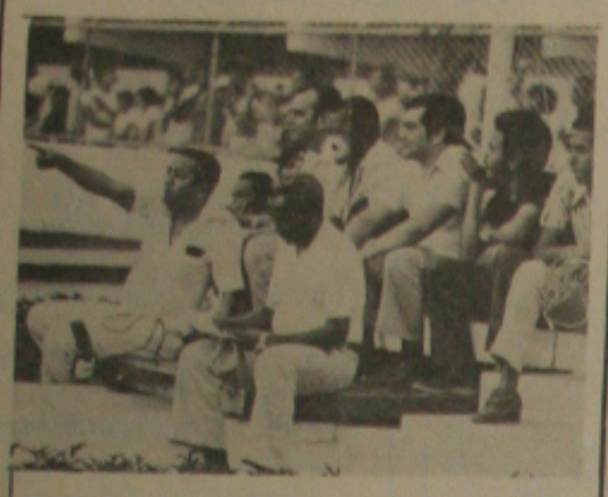
RELEMBRANDO A JORNADA