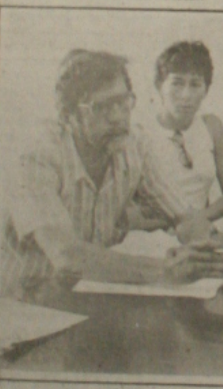
Pesquisadores da UFS se reúnem.