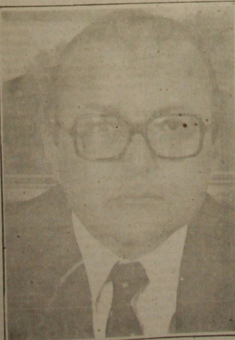
Mailson: queda na inflação com reforma administrativa.

raes vai aproveitar contro de hoje para fundar suas conversa- com os governadores estinos sobre a viabili- o de sua candidatura residência da República hoje de uma articula- que já tem o apoio do ernador do Rio, Morgel- franco - que visa tam- a assumir o controle PMDB na convenção partido em março pró-