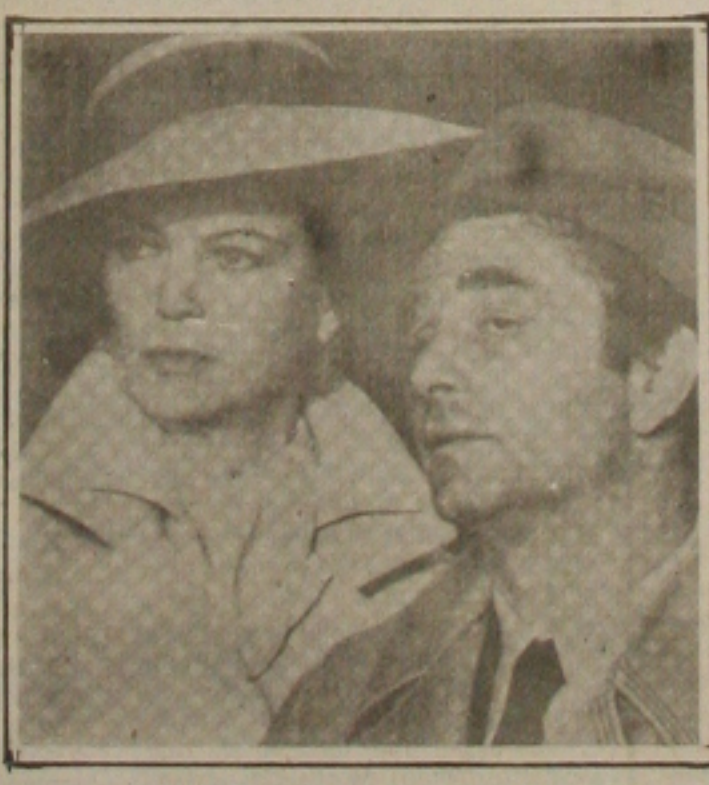
O Detetive Desastrado

FESTIVAL DE FERIAS (CANAL 4) ROBUR, O CONQUISTADOR (Master of the World). 95. mm. EUA, 1961. Direção: William Withey. Roteiro: Richard Matheson, adaptando os romances "Mestre do Mundo" e "Robur, o Conquistador" de Jules Verne. Com Vincent Price, Charles Bronson, Henry Hull, Mary Webster. Price faz um invento megalomaniaco que sai numa estranha máquina voadora - em 1848! - à caça dos armamentos, para garantir a paz mundial. Produção barata e curiosa.