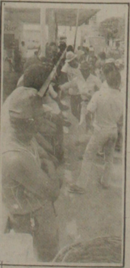
Pescadores decidem continuar em greve.