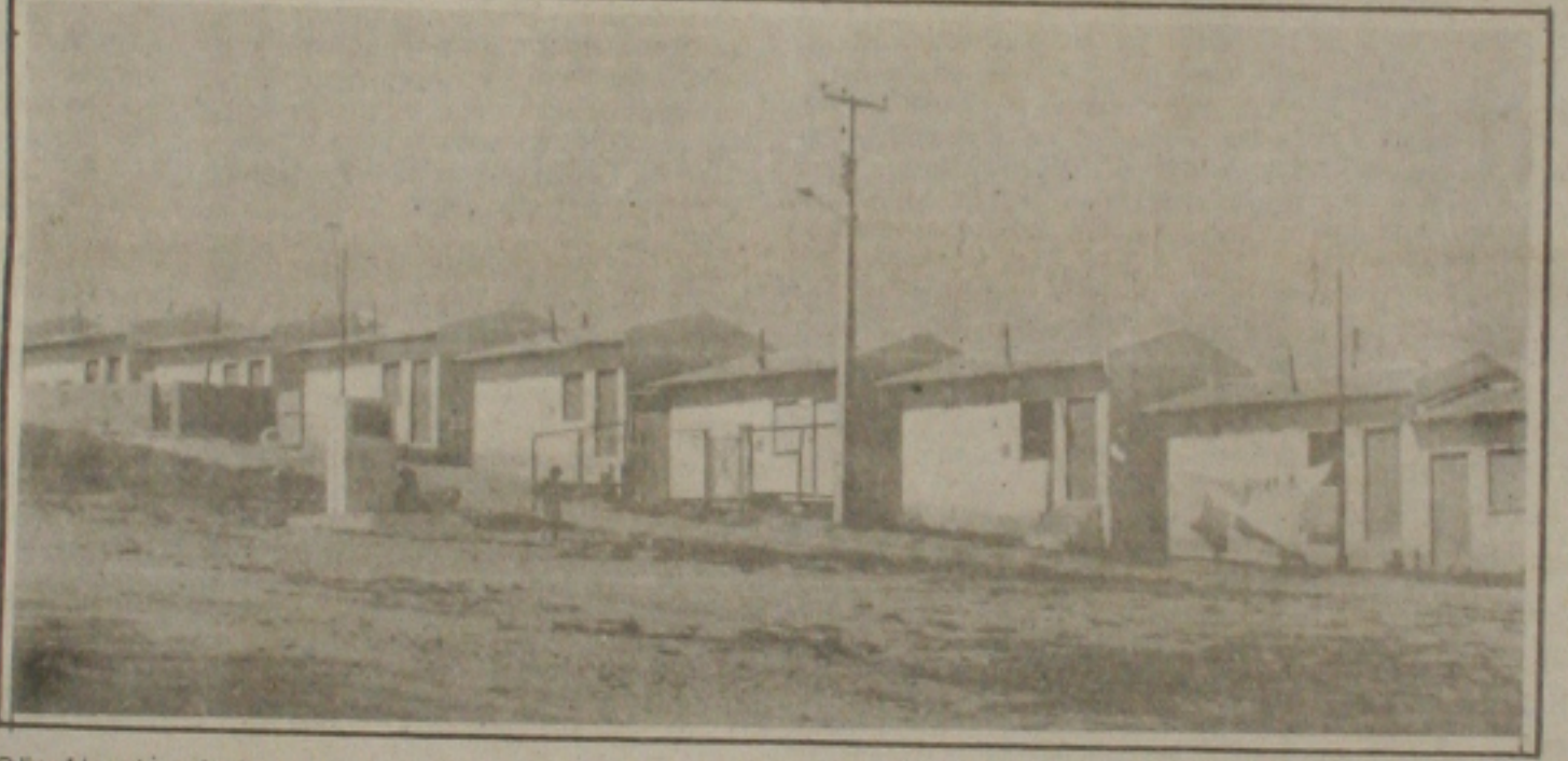
O lixo é jogado em frente das casas.