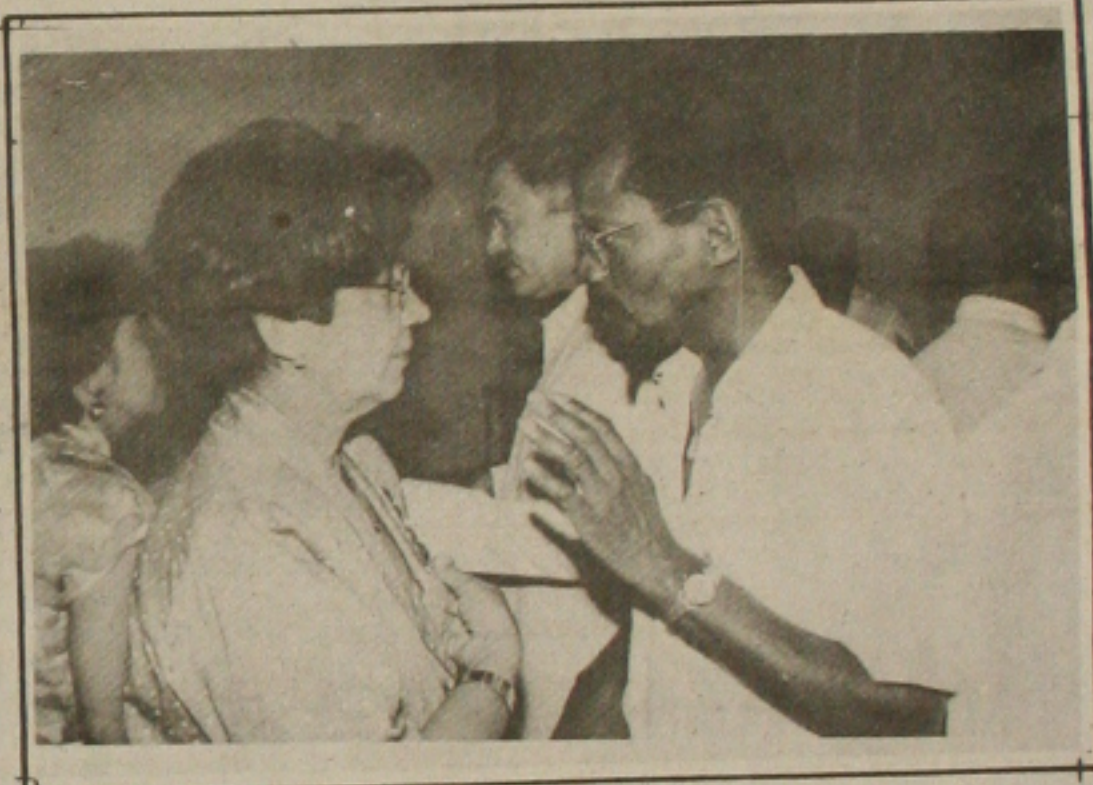
Intelectuais discutem a situação do negro e a contribuição na cultura brasileira.

O presidente da Energipe, João Fontes, salientou que, 95% dos brasileiros interessados em saber quem matou a milionária Odete Roitman ao passo que apenas 5% estão interessados em descobrir quem matou o líder sindical e ecologista Chico Mendes, há cerca de 20 dias no Estado do Acre.