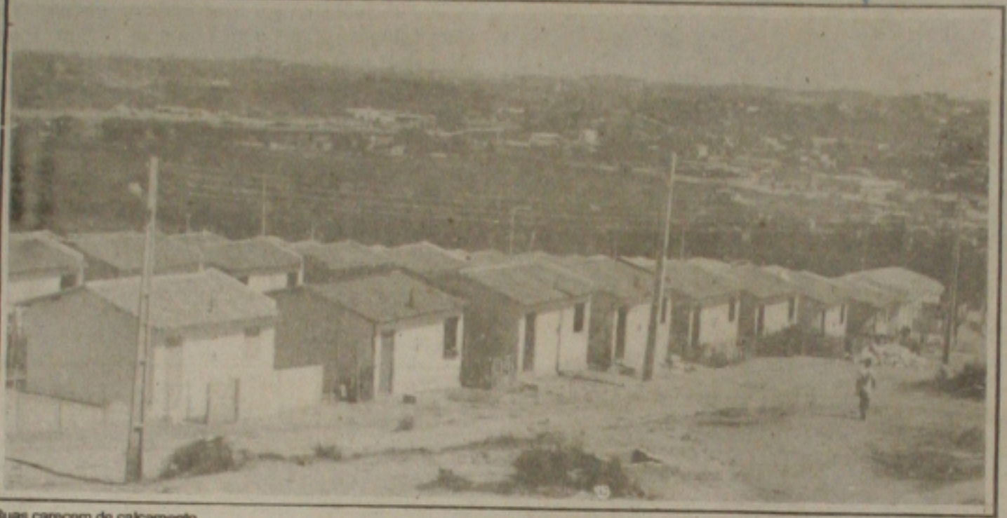
Ruas carecem do calçamento.