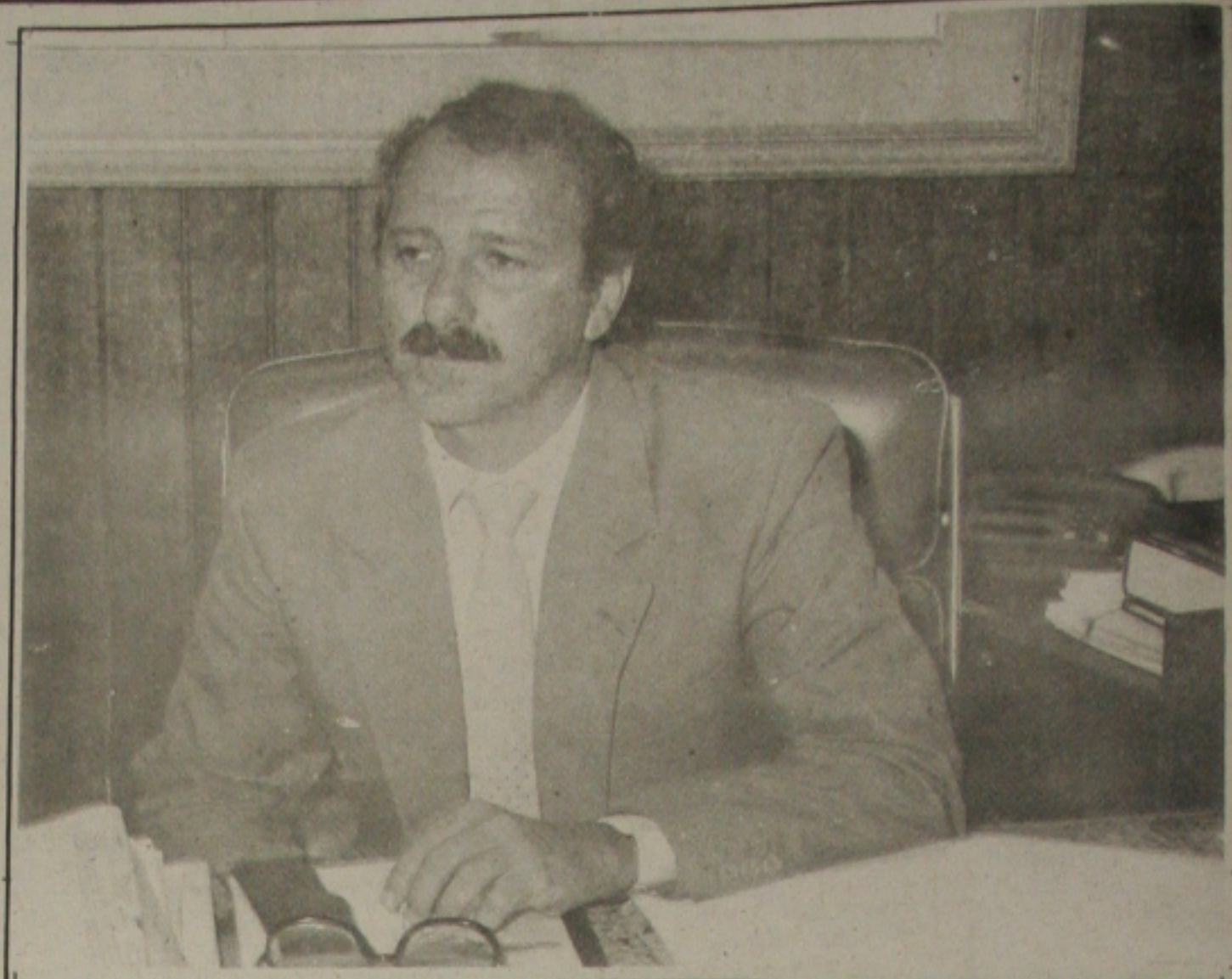
Carlos Borges já foi convidado a deixar o Banese.

De Octávio Gouveia de Bulhões, em janeiro de 1985, últimos suspiros da Velha República.