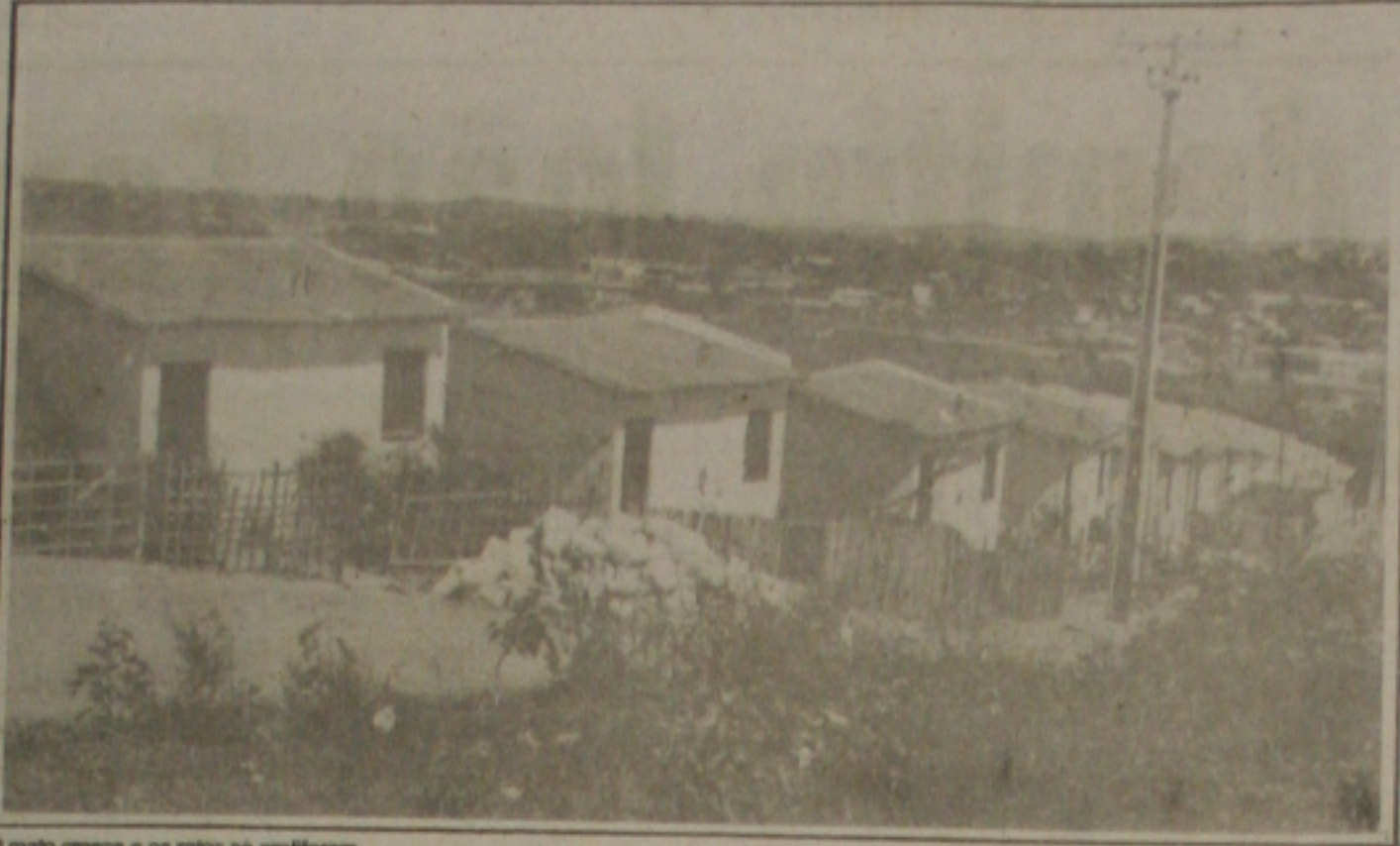
O mato cresce e os ratos se proliferam.