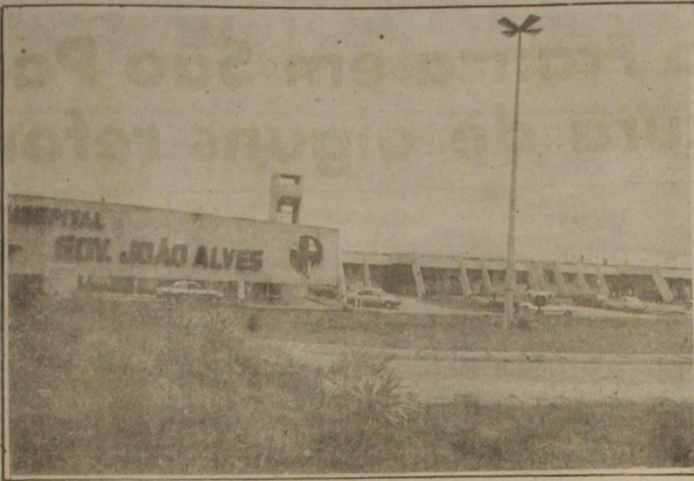
Hospital de Pronto Socorro Governador "João Alves Filho".