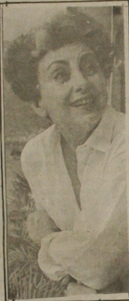
Odete Roitman (Beatriz Segal)