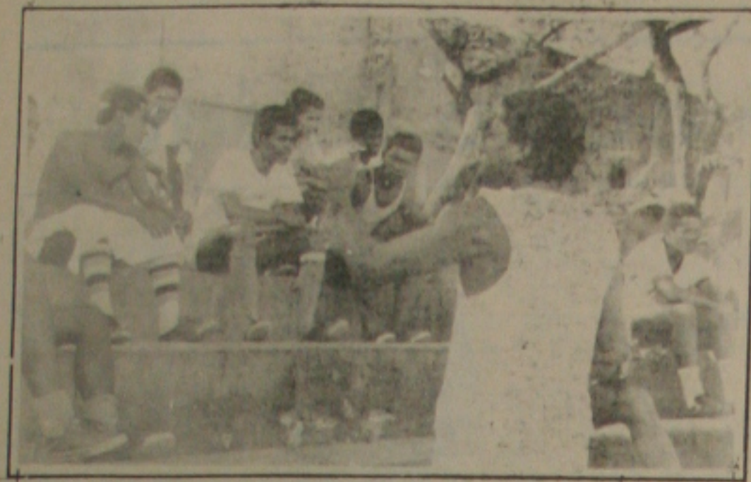
Duda fez a preleção e depois comandou...