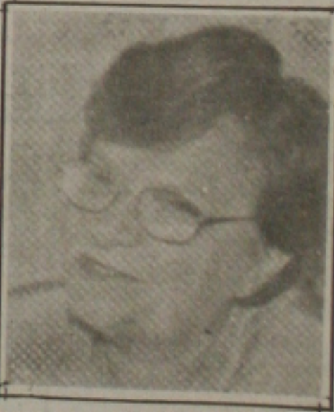
Prefeita de São Paulo, Luisa Erundina.

A nível interno, o problema do déficit municipal está sendo negociado com o Banco de Desenvolvimento Econômico e Social (BNDES), que deverá destacar, ainda esta semana, um técnico para examinar a situação da