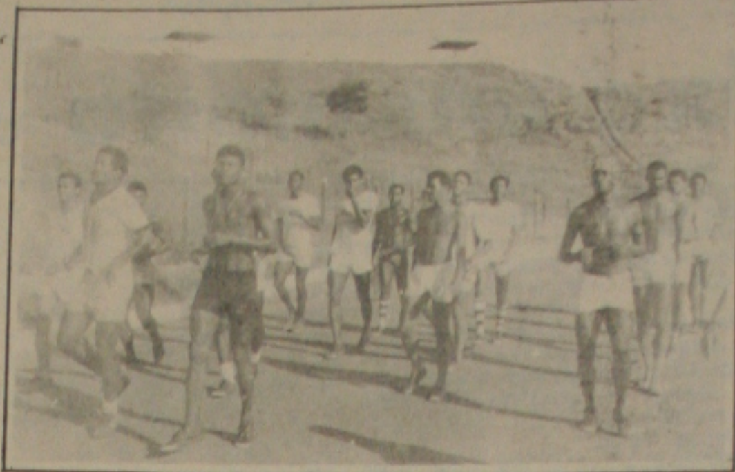
uma comida no Parque da Cidade.