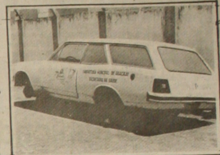
Ambulância abandonada evidenciando a falta de recursos na Secretaria de Saúde do Município.