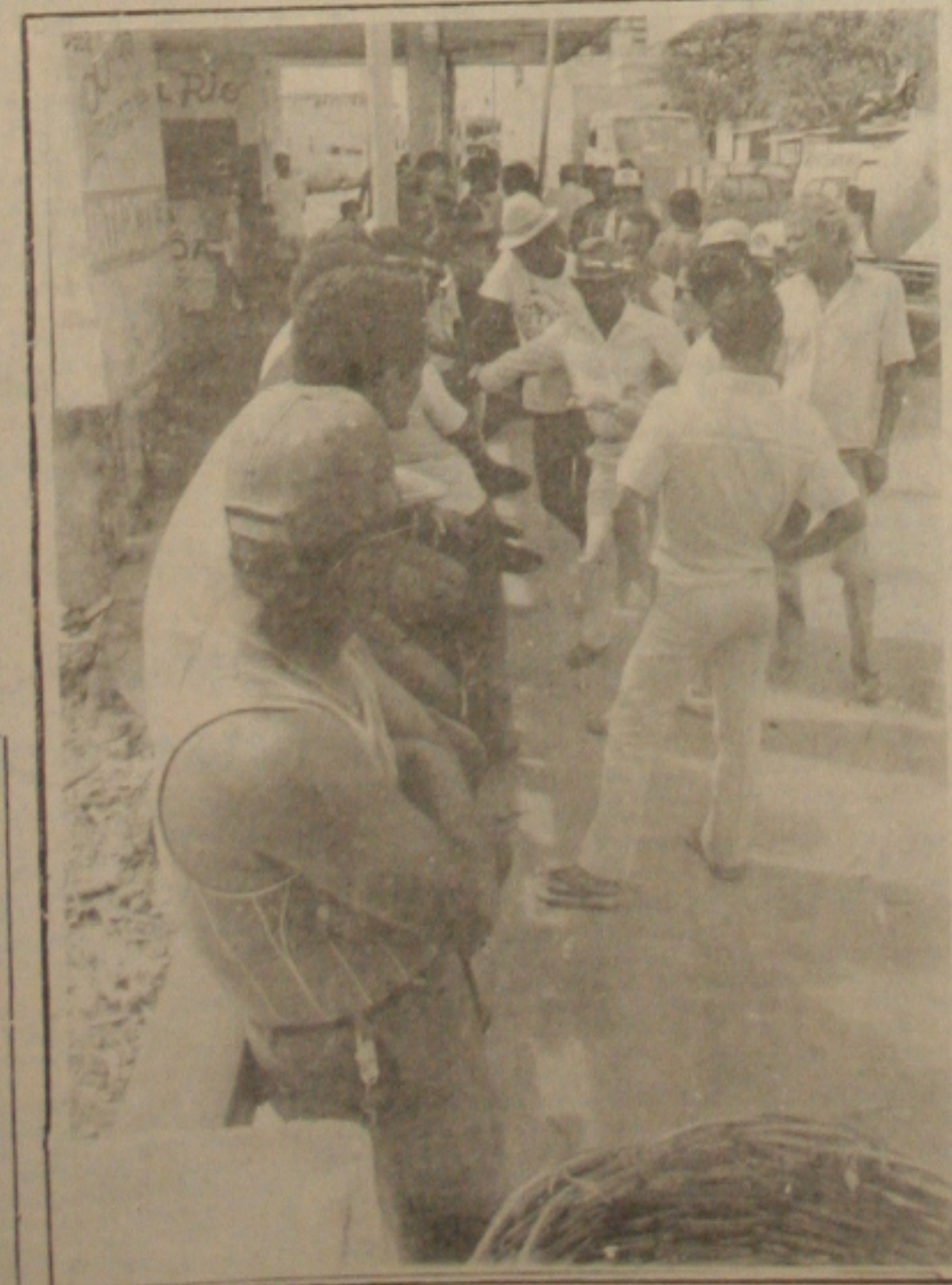
Pescadores fizeram greve e reduziram a oferta de peixe no mercado.

Governador Antônio Carlos Valadares deverá convocar a Assembleia Legislativa durante esta semana, para aprovar os projetos de lei que vão materializar oficialmente a reforma administrativa, que extinguirá 10 secretarias, desativará algumas delas, como também o desativará órgãos públicos da administração direta e autarquia. Além disso, o governador do Estado passará expediente da tarde em despacho com o atual secretário de Estado, Deoclécio Vieira, que será substituído pelo colega. O despacho foi para tirar da elaboração dos projetos e fazer comentários nos corredores do Palácio dos Governadores, que a própria reforma administrativa anunciada no dia, poderá começar a ser alterada, com a criação de secretarias extraordinárias: uma para ser ocupada pelo governador, e a segunda, em substituição a anunciada anteriormente, a ser ocupada pelo professor Eivaldo Camargo, assim a ser status de secretário e não de assessor pessoal do próprio Valadares. No entanto, as especulações confirmadas, já que o governador do Estado não fez nada a imprensa neste sentido. (Página 3 e Informe GS).