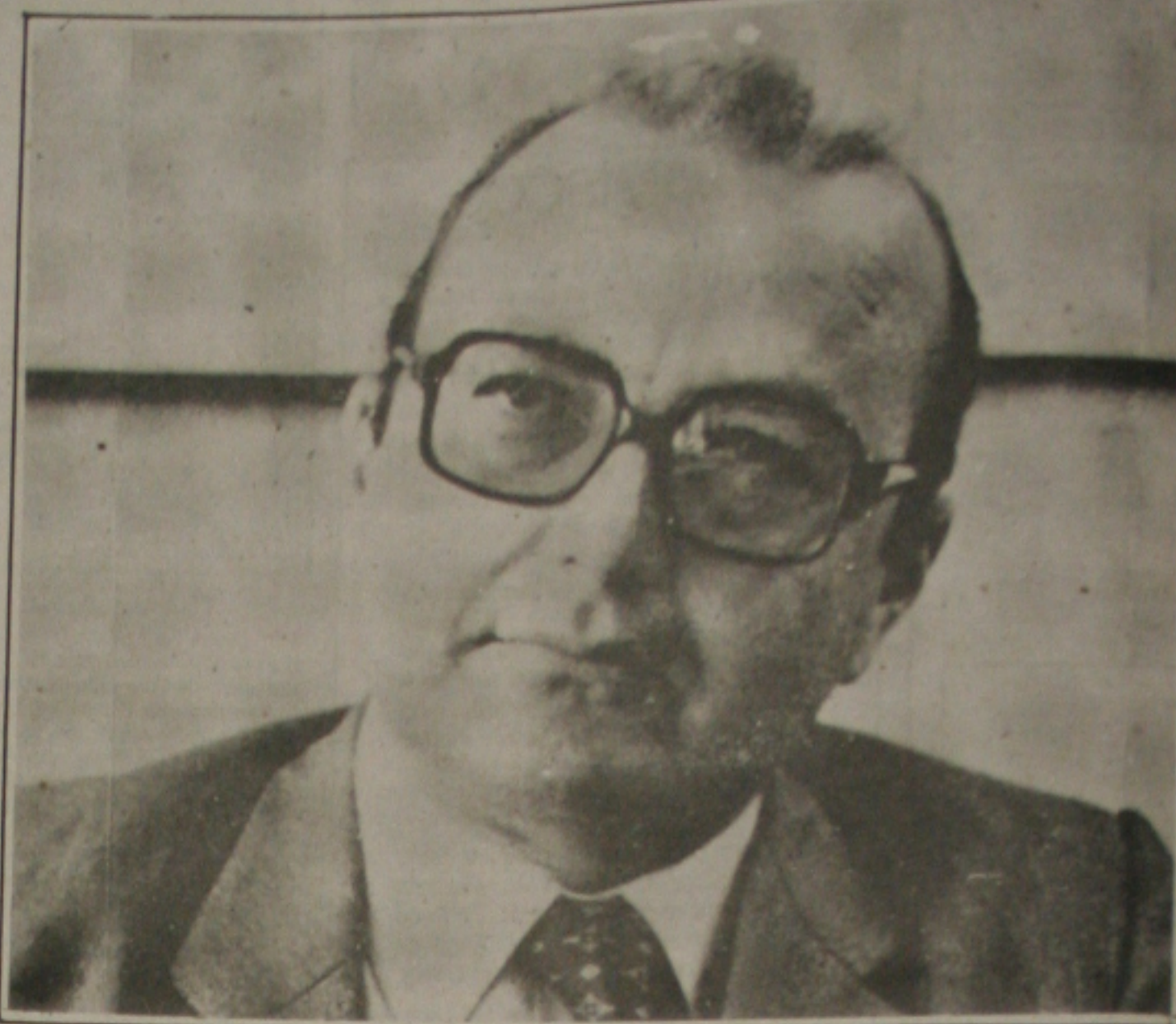
Ministro da Fazenda, Mailson da Nóbrega.

De Derek Bok, reitor da Universidade de Harvard.