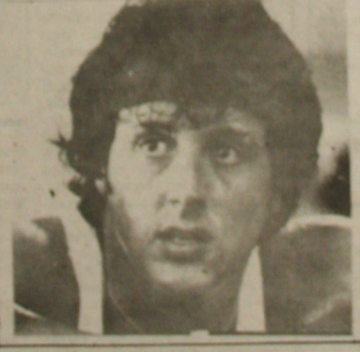
Sylvester Stallone está em Rocky II