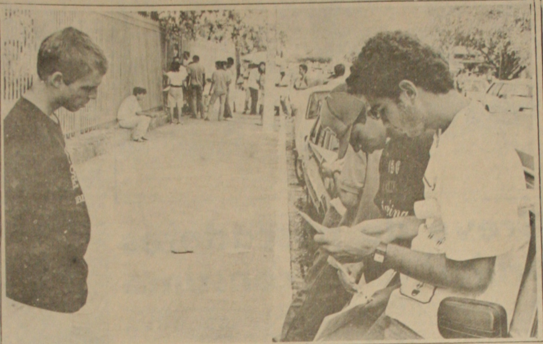
Os estudantes conferem os gabaritos depois de cada prova e muitos deles até começam a vibrar.