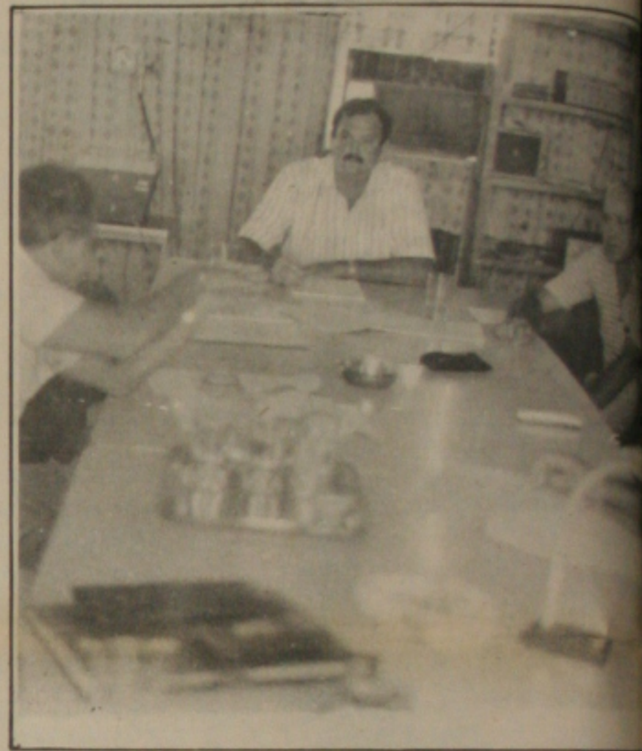
Veterinários discutem como cumprir determinação do Governo.