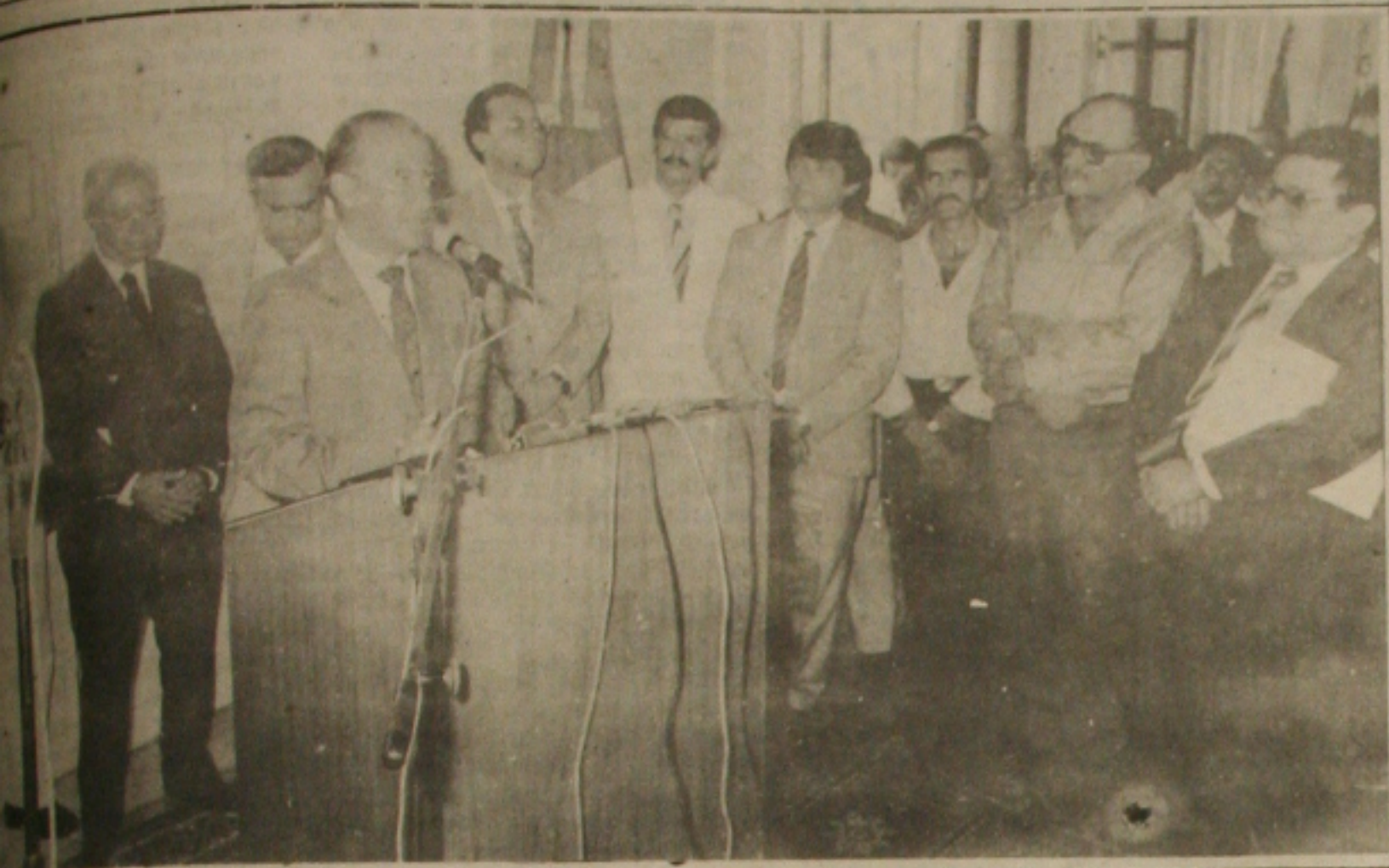
Carney apresenta novos secretários e fala de austeridade em seu Governo.

O presidente Sarney anuncia hoje, às 11 horas, a Reforma Administrativa do seu Governo, com a extinção de Ministérios e empresas públicas. No domingo, através de uma cadeia de televisão, o presidente anuncia um novo pacote econômico, em sua última tentativa para ajustar a economia do País. Ontem, em Brasília, o Banco Central decretou feriado bancário para a segunda-feira, decisão destinada a permitir que as instituições financeiras adaptem-se às medidas que os técnicos do Governo estão elaborando para sustentar o Plano de Verão. Essa necessidade decorreu, primeiramente, da opção das autoridades econômicas e monetárias pela utilização da tabela para a correção dos contratos fechados até o dia da decretação das medidas, já que os bancos terão de adaptar-se para operar como índice de deflação de 28% e para a realização de resgates antecipados. Não bastasse a reedição da tabela, os bancos terão de reprogramar de seus sistemas informatizados em face da decisão do Governo de criar o Novo Cruzado, com o corte de três zeros da moeda atual. Outro motivo que levou a decretação do feriado bancário para o pú-