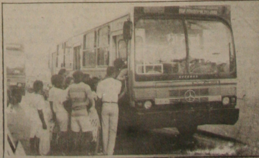
Ônibus mais caro hoje

Já detasados, pois o reajuste aprovado ontem foi para compensar o último aumento dos combustíveis praticado no dia 27 de dezembro passado; entram em vigor a zero hora de hoje o reajuste de 20 por cento para os transportes coletivos de Aracaju. Com a majoração a passagem do ônibus comum de Aracaju passa a custar 120 cruzados, enquanto que o do tipo jardineira, custa agora 180 cruzados. A bandeirada no táxi é 447 cruzados e 80 centavos. O quilômetro na bandeira 1 custa 199 cruzados, enquanto que na bandeira 2, custa 248 cruzados. Segundo revelou o Superintendente da Seturb, Bosco Mendonça, só não foi definido ainda o novo valor da passagem no táxi lotação, mas que a depender de acordo com os proprietários desses taxis, deverá ficar em torno de 240 cruzados. Este é o primeiro reajuste das tarifas dos coletivos aprovado pela administração Wellington Paixão.