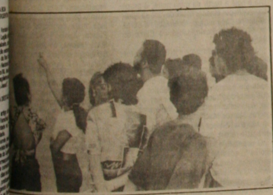
Procuram os seus nomes na relação afixada no Campus da UFS.