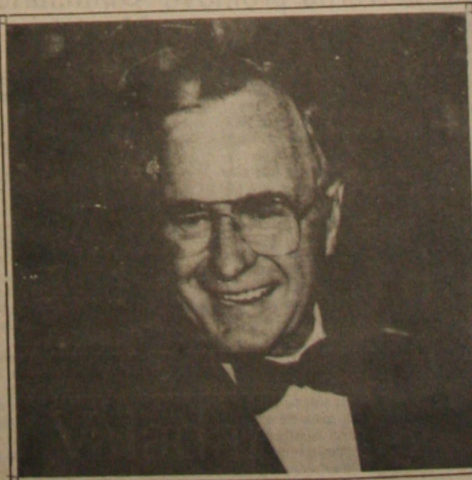
George Bush foi empossado ontem como o novo Presidente dos EUA.