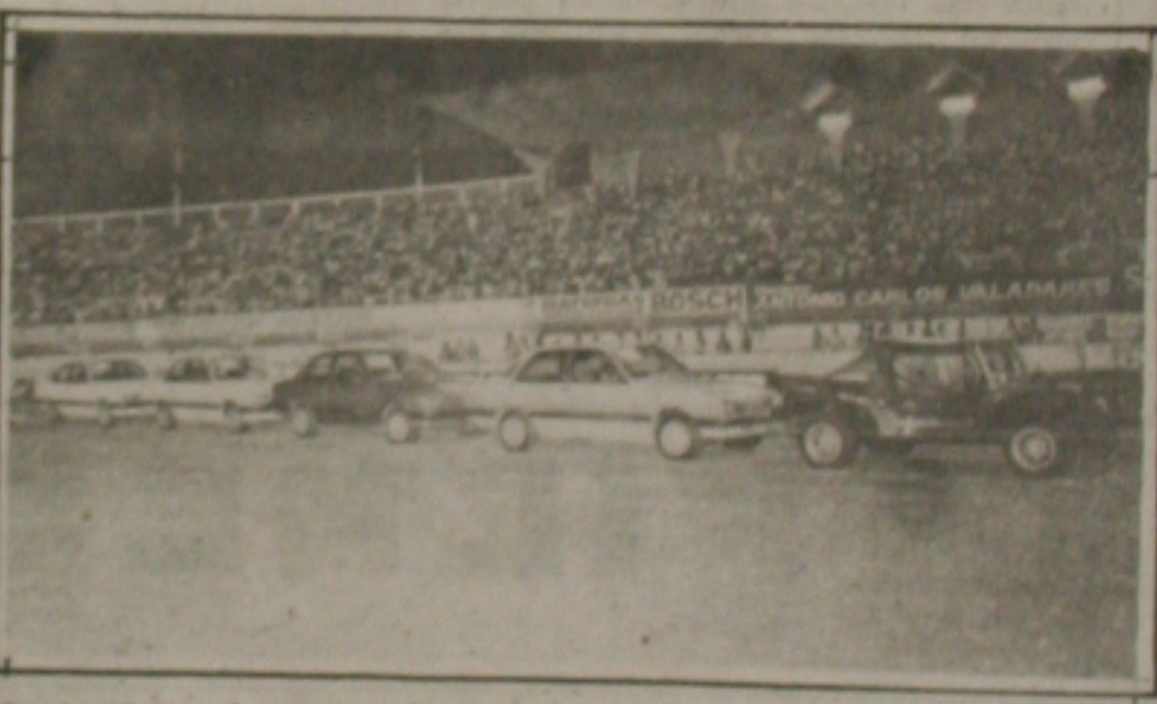
Grandes prêmios serão sorteados no Bingo da Integração no próximo sábado.

Segundo os dirigentes sergipanos a fórmula deu certo no Campeonato Brasileiro