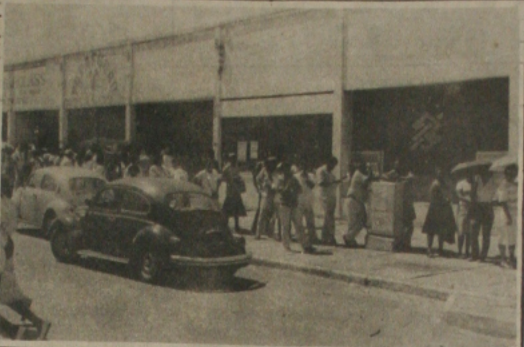
Pis/Pasep: o sacrifício para receber rendimentos.