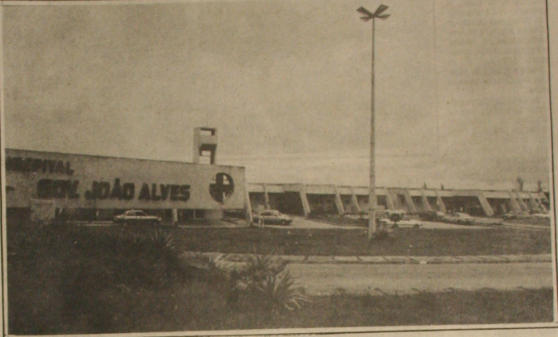
O Conselho de Medicina denuncia a precariedade do Hospital João Alves Filho.

O Hospital João Alves Filho foi fundado há três anos, como opção, de atendimento de emergência para a população sergipana, que contava apenas com o Pronto Socorro do Hospital de Cirurgia. Desde o ano passado, que o novo Pronto Socorro vem atravessando uma grave crise, denunciada até por seu corpo de médicos e funcionários, o que chegava a comprometer até mesmo a credibilidade do atendimento prestado pelo Hospital, com denúncias inclusive de mortes por falta de material e equipamento. Os servidores chegaram até a fazer greve de quase dois meses, exigindo inclusive a reposição dos estoques de remédios e material hospitalar. (Pág. 5).