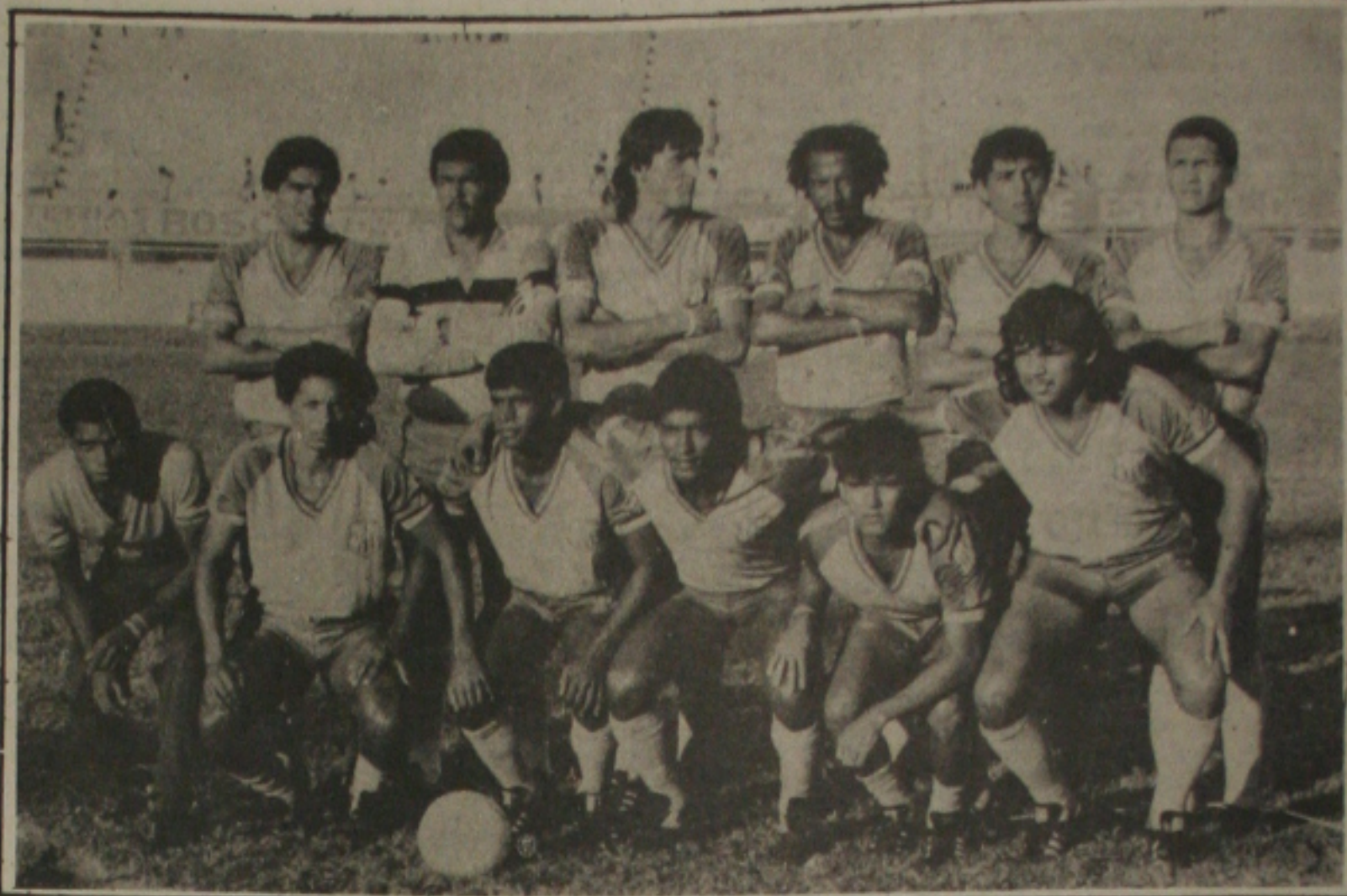
Uma das boas formações do Estanciano que em 89 não vai disputar o certame de profissionais.