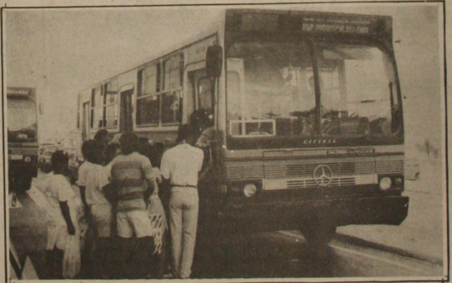
Ônibus urbano: os empresários pedem novo reajuste da passagem e alegam defasagem do preço provocada pelo aumento dos combustíveis antes do Plano Verão.