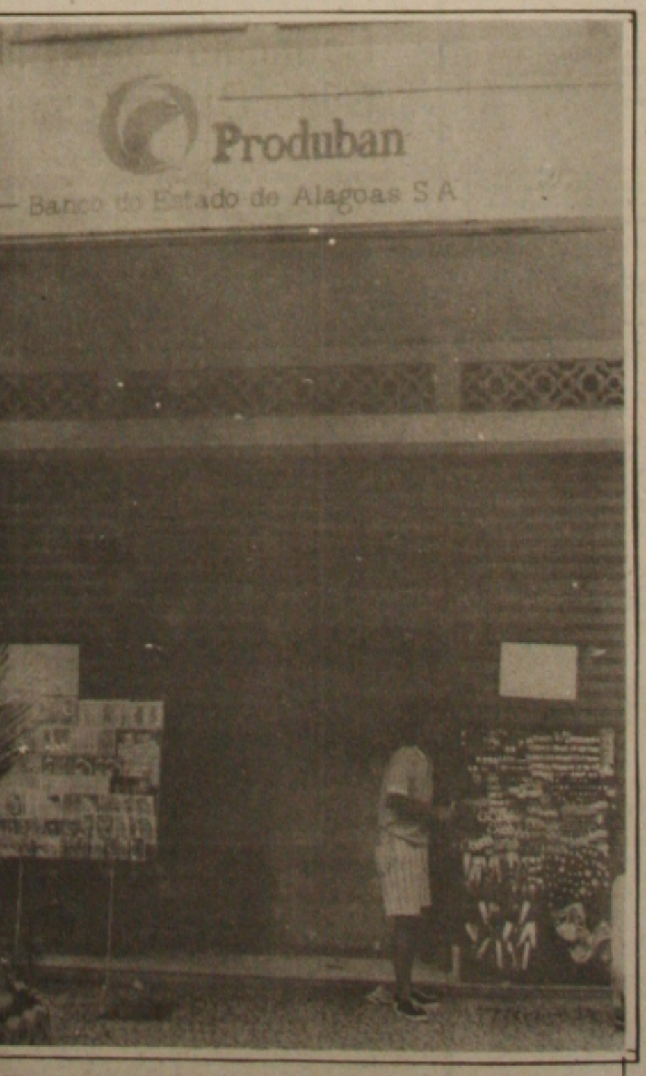
O Produban ainda não tem data para ser reaberto.

Além da venda do açúcar a empresa inglesa, os usineiros assumiram o compromisso, através de uma retenção pela Cacex do Banco do Brasil de pagar 10 milhões de dólares. Informou Siqueira, que também ficou acertado para completar a dívida serão pagos 26 milhões de dólares, através de prestações mensais, que serão iniciadas a partir de 1991, com recursos oriundos do crédito que os usineiros tem junto ao Estado referente ao ICM da casa própria.