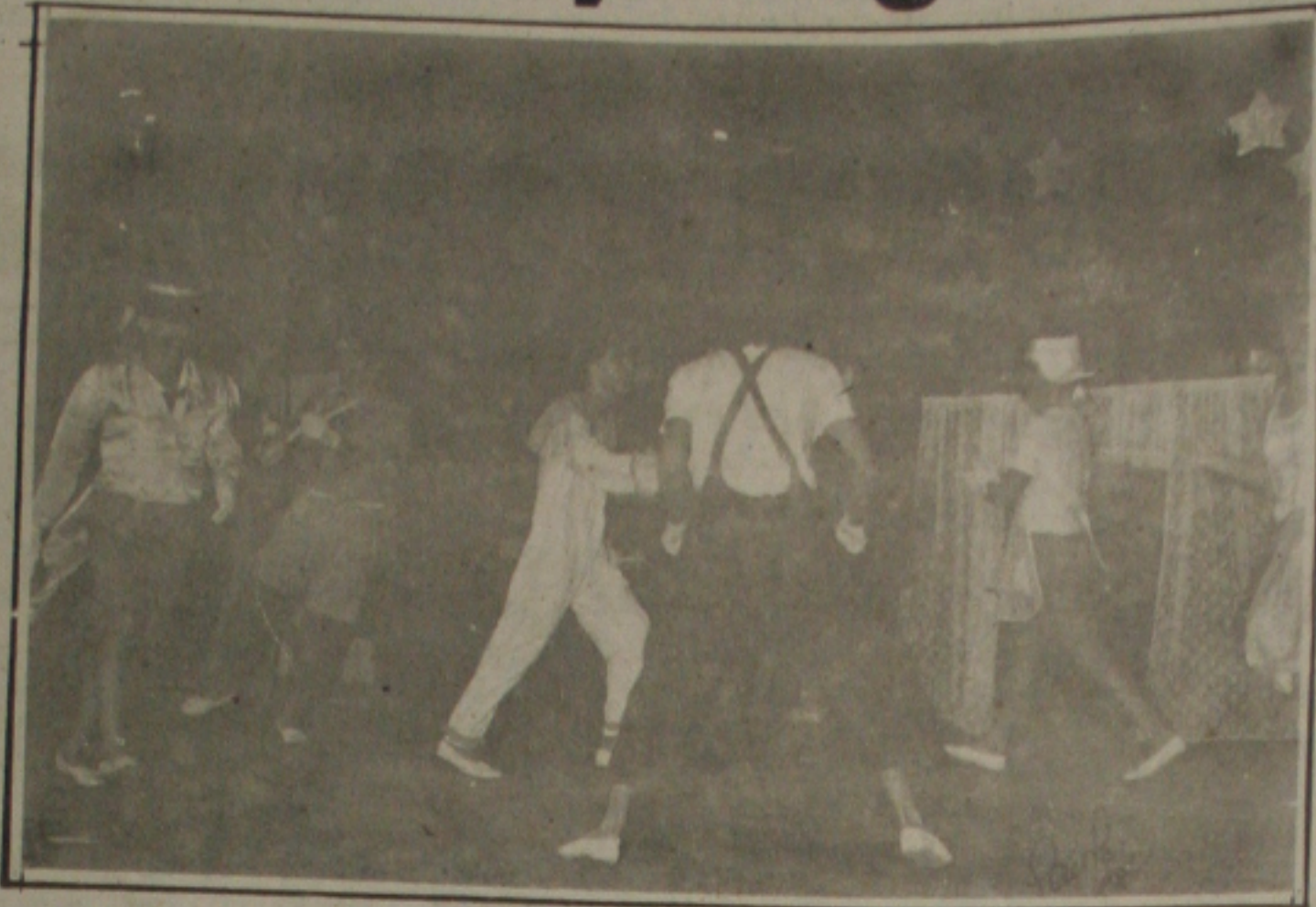
V Mostra de Teatro, no Centro de Criatividade