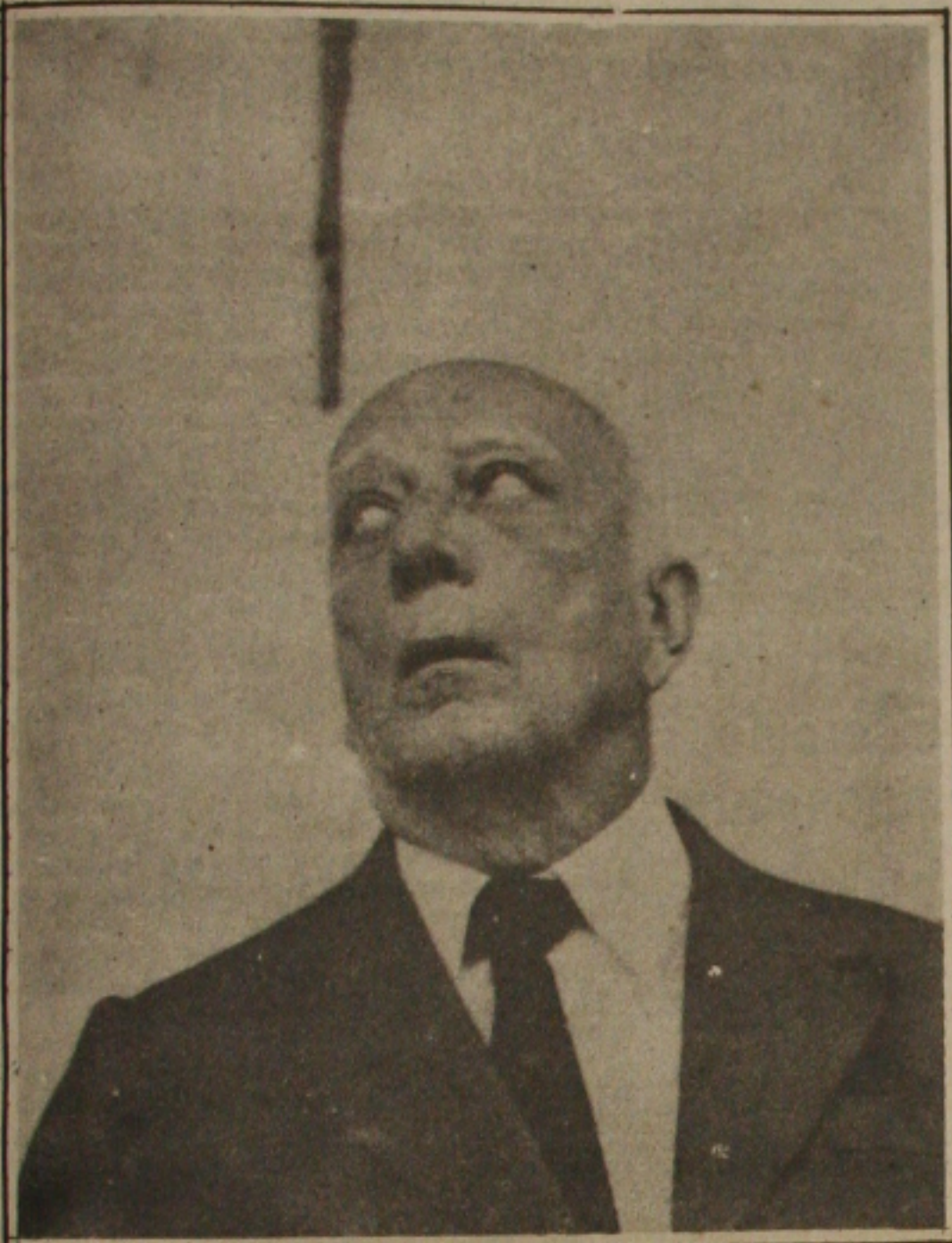
Ulysses Guimarães: Congresso convocado para votar as medidas do Plano Verão.

A comissão recebeu diversas denúncias de que certas indústrias que antes do plano de estabilização só aceitavam pagamento à vista, mudaram de posição. Agora só vendem a prazo, embutindo um custo financeiro elevado, em torno de 45%.