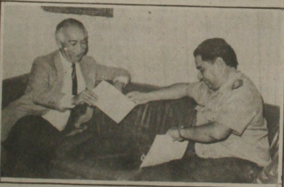
Prefeito de Aracaju recebe o Comandante do 28º BC.

Neste domingo a partir das 20:30 horas acontece a entrega do troféu Mendes Filho, seguida de coquetel de confraternização.