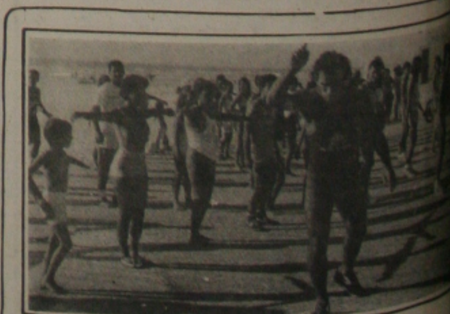
A Manhã de sol. Verão sergipano e gente de todas as idades mais em grande parte, tem aproveitado a promoção de uma academia local, que promove na Praia de Atalaia, jogos de ginásticas, ao som de muita música. O lato não é de todo inédito, mas tem sido muito bem recebido pelos baianos se juntar aos que adoram e praticam a ginástica ao ar livre. Ao lado de uma academia orientada pelas emissoras de FM. O lato vem se repetindo diariamente e aos domingos na praia José Sarney. O negócio é agitar e praticar esporte, não importa o qual.