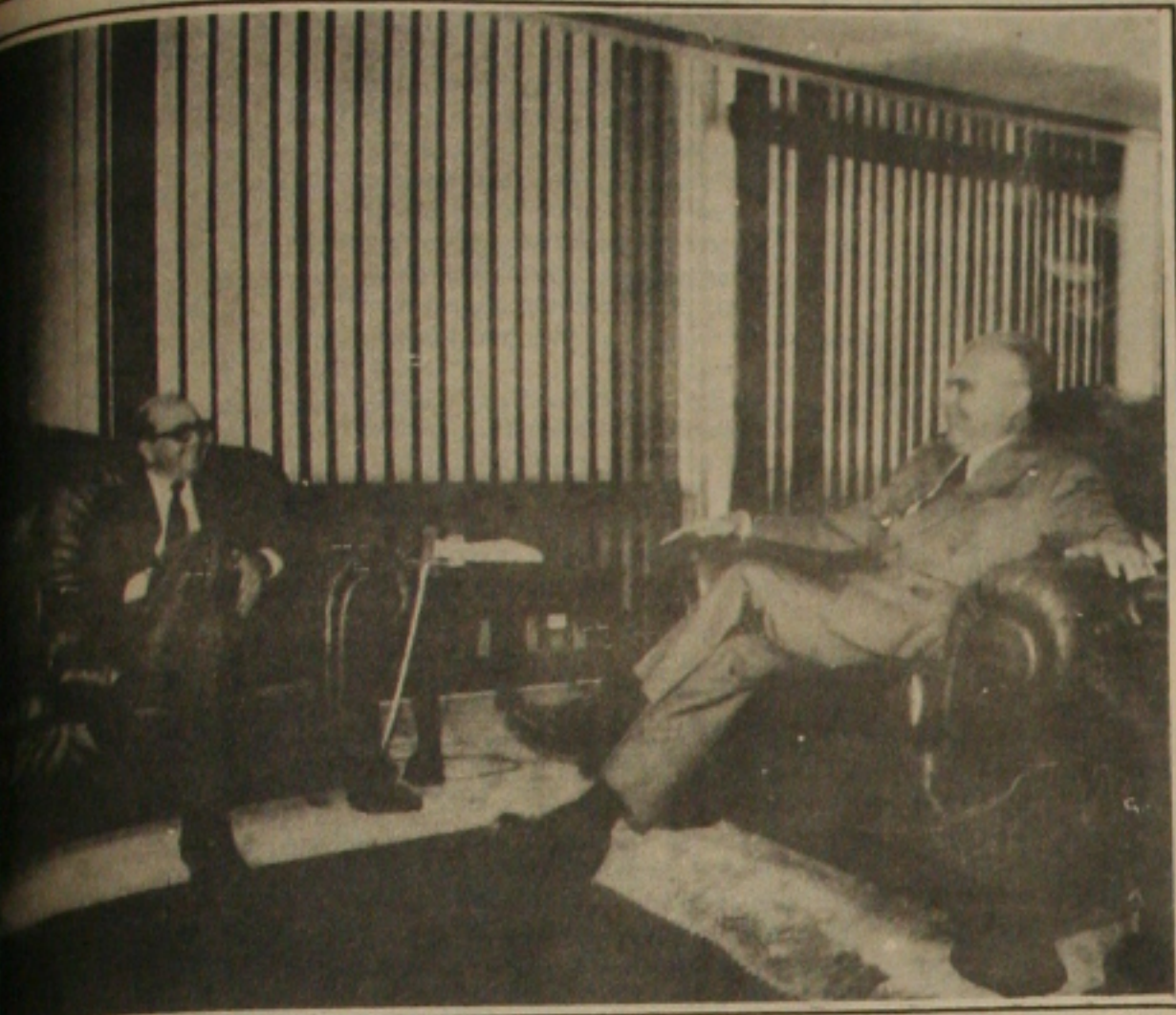
Ministro de Nóbrega conversa com o presidente Sarney sobre a pressão do Congresso para a definição da nova política salarial.

Numa expressiva demonstração de que ou o Governo Federal define as regras da nova política salarial ou as medidas provisórias que estabelecem o Plano Verão serão rejeitadas, o Congresso Nacional não aprovou ontem a primeira medida provisória que entrou na pauta de votação, o que terminou por criar um impasse que chegou a assustar até mesmo o presidente da Central Única dos Trabalhadores, Jair Meneguelli, que chegou a questionar a validade da atitude sob a argumentação de que radicalização poderia colocar em risco uma negociação salarial que estava em curso. Mas o senador Ronan Tito, PMDB-MG, que liderou o movimento para rejeitar a medida provisória -