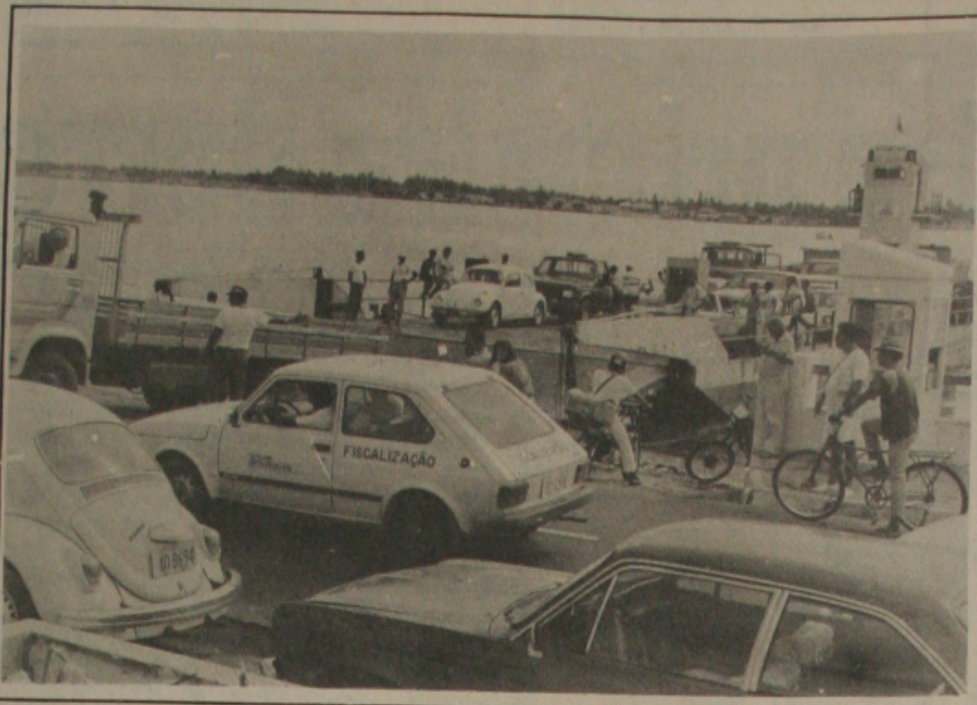
Balsas terão novo atracadouro no bairro Industrial