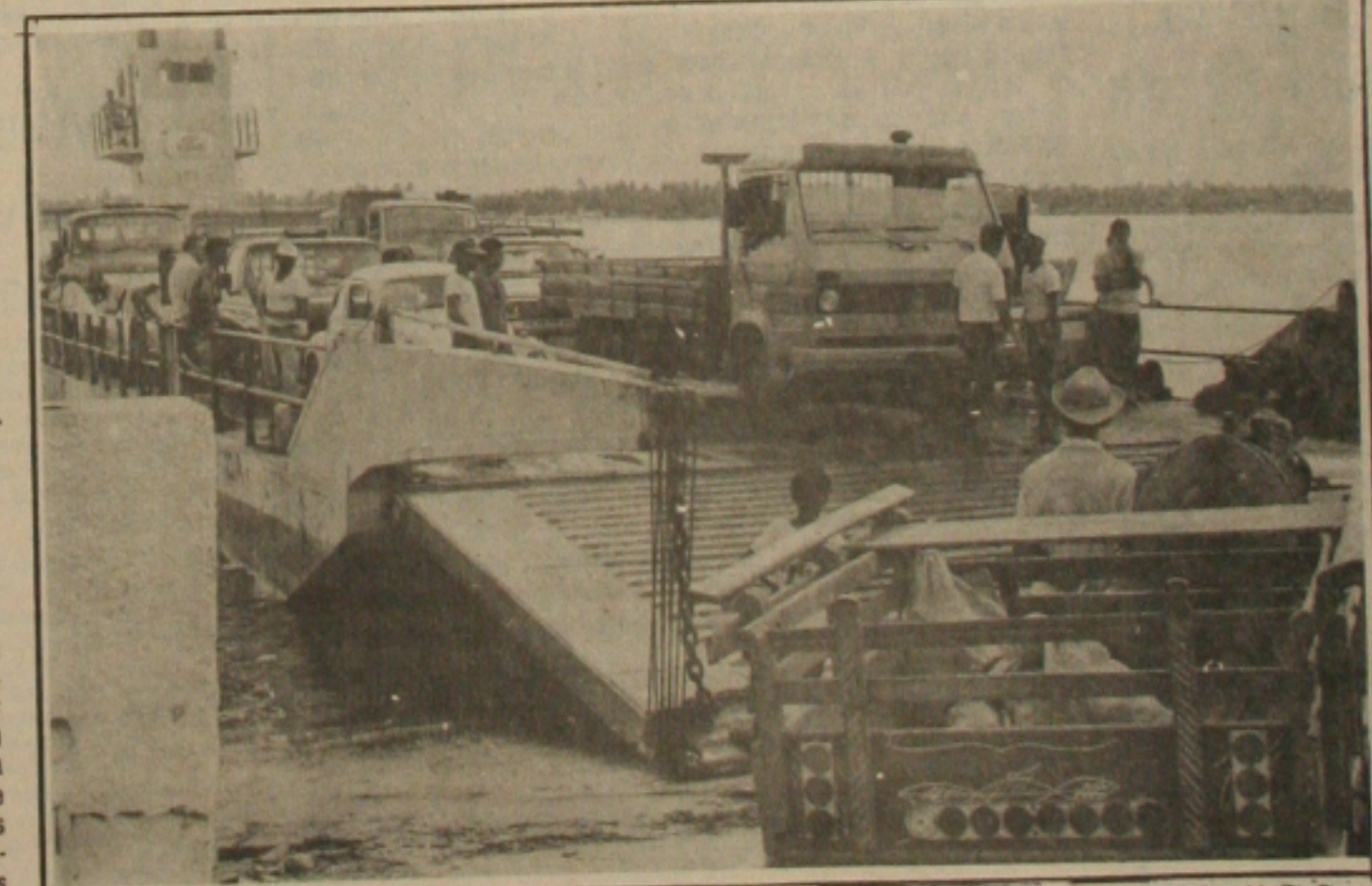
Os embarques e desembarques de veículos na balsa continuam sendo feitos precariamente no improvisado atracadouro da Avenida Rio Branco.

Os clubes de associações recreativas são dispensados do cumprimento da tabela de preços para os seus serviços e produtos comercializados nas dependências de suas instalações, porém, havendo congelamento, eles são obrigados a manter os preços. Foi o que informou ontem a delegada da Sunab, Lygia Maynard, ao revelar que durante reunião mantida com os dirigentes de clubes, ficou decidido que durante o período do Carnaval essas entidades vão cobrar 70 centavos novos pelo preço de uma garrafa de cerveja e 20 centavos novos pelo refrigerante. (Página 5).