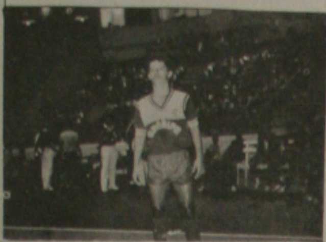
AMÉRICO NO CONFIANÇA