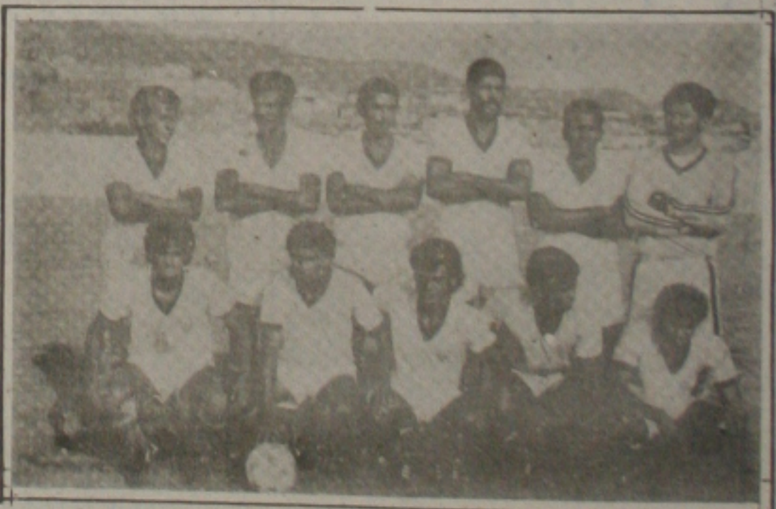
O Guarani pode perder a vaga para o Santa Cruz.