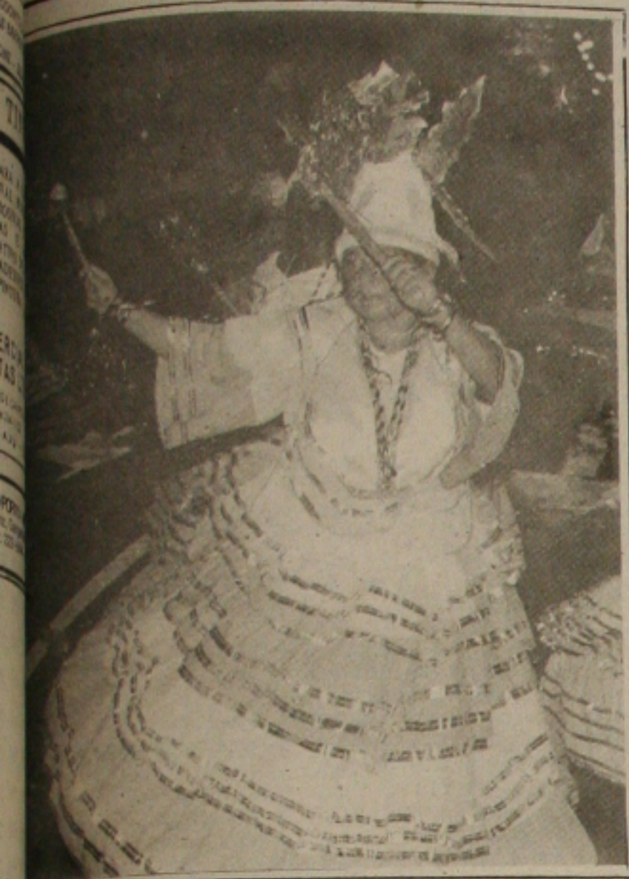
Uma animação com tranquilidade em toda Aracaju