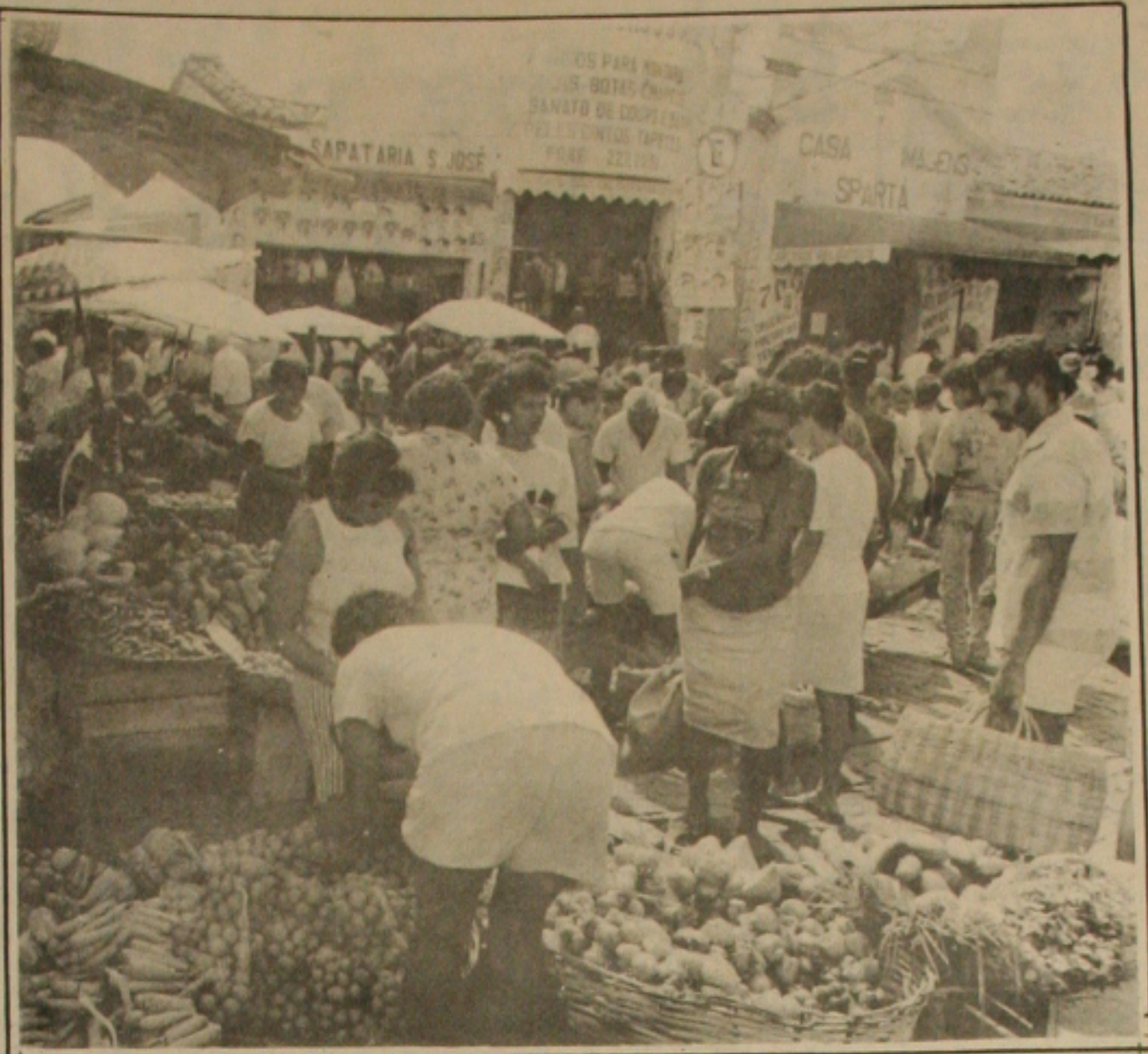
Os supermercados e feiras livres estão sendo fiscalizados pela Secretaria de Abastecimento.

Nesse sentido, ele lembrou a importância de duas importantes ações que o Governo está desenvolvendo. A primeira delas, é o mapeamento agrô-ecológico do país, principalmente o da região Amazônica. O levantamento de Rondônia já está terminado, sendo feitos os mapeamentos do Mato Grosso do Sul, Mato Grosso e Goiás (os três Estados que estão abrindo cerca de 90 por cento da imigração, em razão do grande potencial oferecido por esta fronteira agrícola) e, a partir deste mês, a FAO começa o trabalho similar em toda a área amazônica.