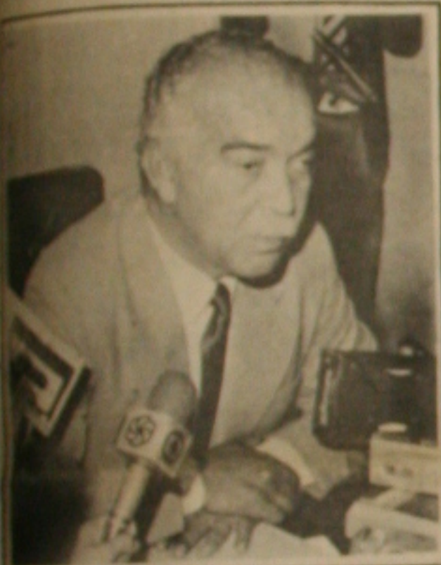
Foto: apelo aos vereadores

Já os proprietários de escolas estão majorando as mensalidades, quando elas estão congeladas com base no cobrado em janeiro e o Ministério da Educação orienta os órgãos fiscalizadores em Sergipe a agirem com rigor e orientar a partir daí com o fechamento das escolas, caso elas não cumpram o congelamento. (Página 9).