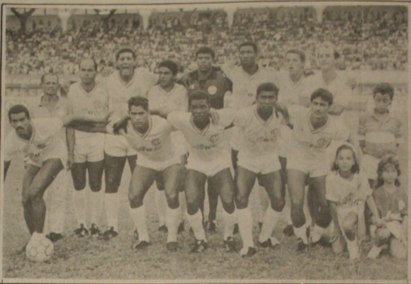
Campeão de 88, o Confiança pode enfrentar o Sergipe no jogo de abertura do campeonato de 89.