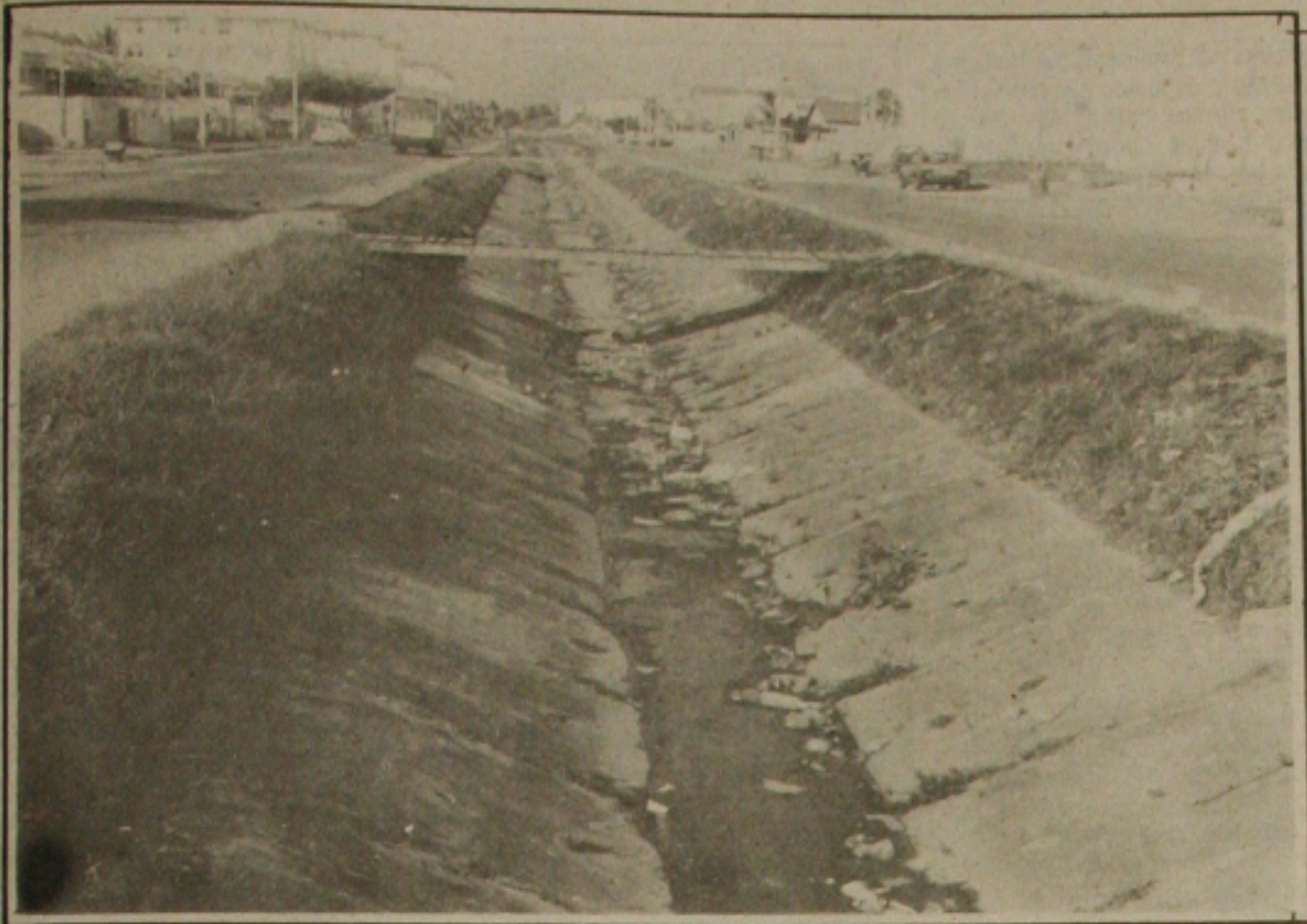
O Augusto Franco vive com uma série de problemas por falta de administração.