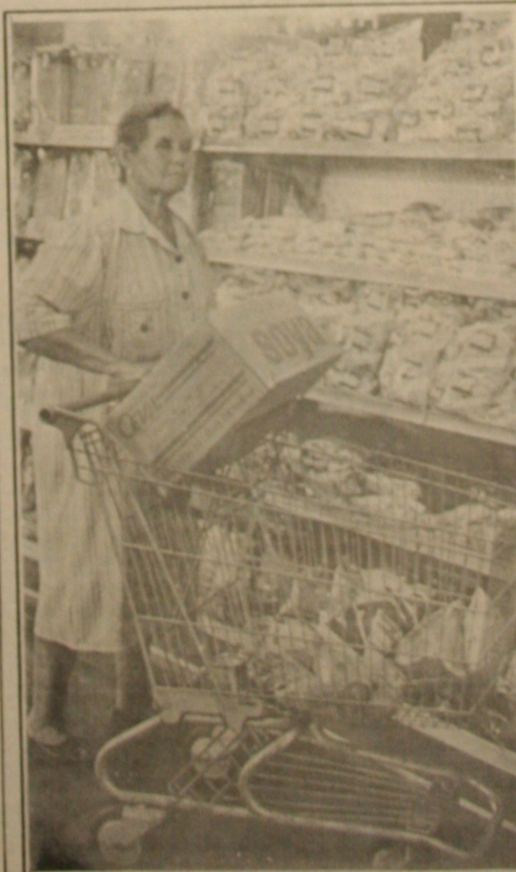
Consumidores comem a sorte feita em produtos nos supermercados.

A GAZETA DE SERGIPE não terá nesta edição, o seu tradicional suplemento dominical GAZETINHA. Assim, deixa de estar com você leitor, a coluna de Pedro Barral, e a coluna Vídeo Clube. A programação de Televisão, você encontrará na capa do Segundo Caderno, juntamente com uma matéria especial sobre a nova novela das sete horas, "Que Rei Sou Eu", que estreia nesta segunda. A GAZETINHA voltará a circular no próximo domingo.