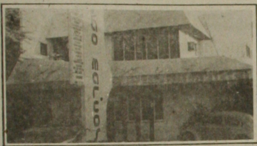
Os hospitais e clínicas particulares de Sergipe não deixarão de atender aos segurados da Previdência Social.