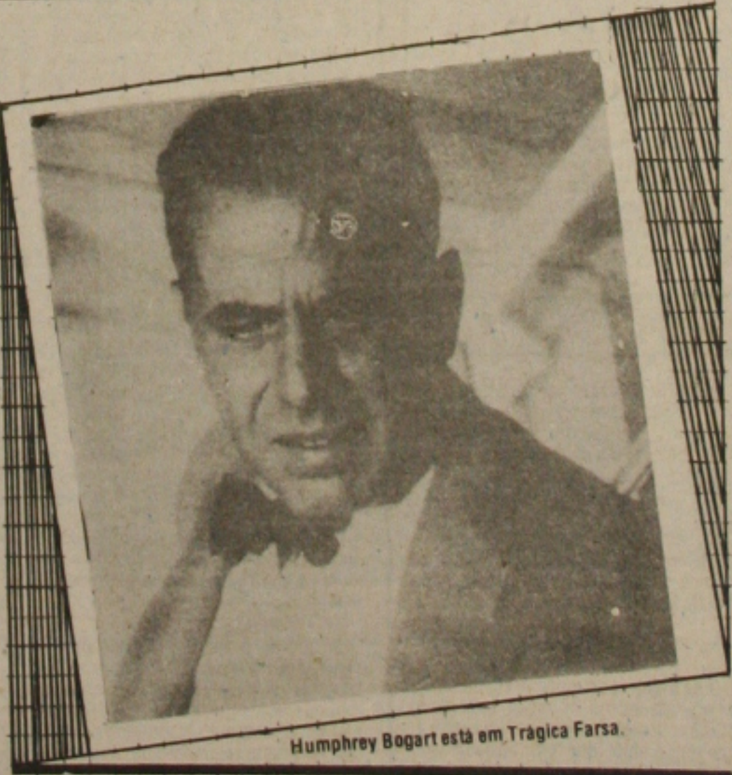
Humphrey Bogart está em Trágica Farsa.