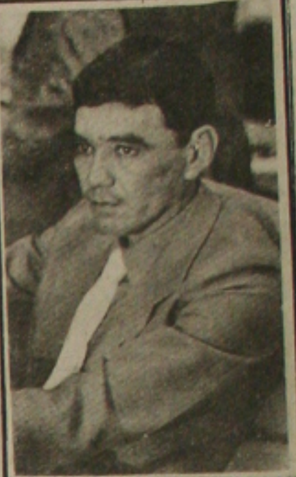
Ribeirinho, não gostou..... de Reis vestido do de mulher.