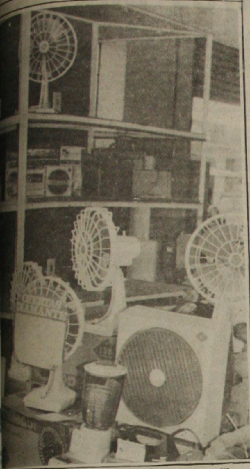
As lojas de eletrodomésticos estão sobrando e não há perspectiva de vendas.