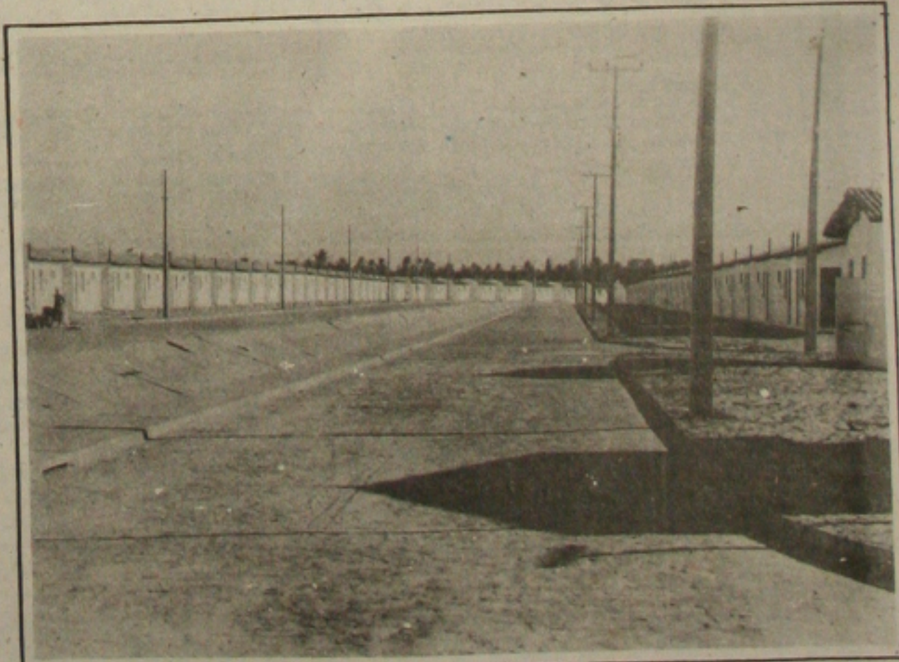
Vista panorâmica do Núcleo Habitacional "Prisco Viana".