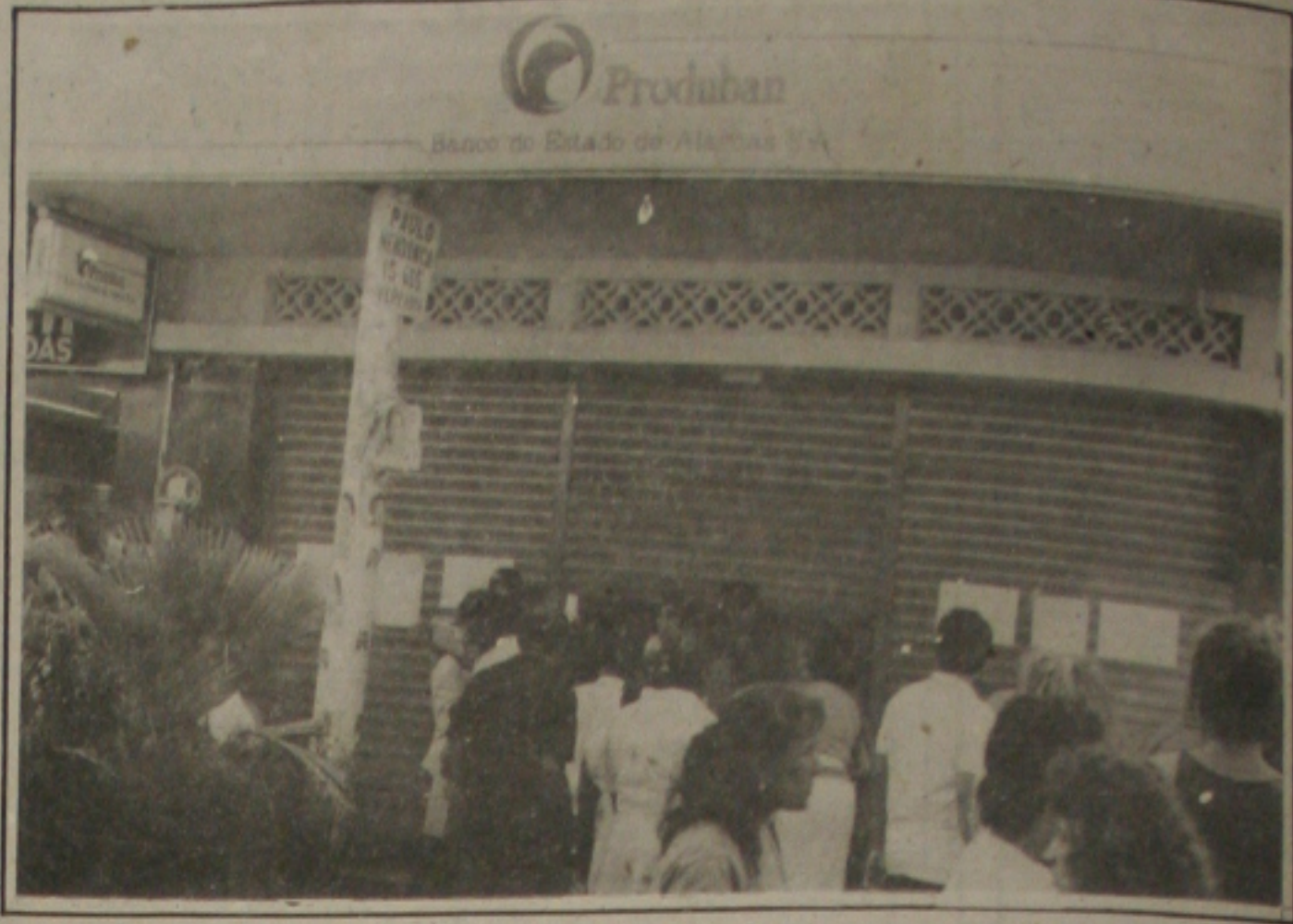
Produban: há perspectivas de reabertura muito mais cedo do que se esperava.