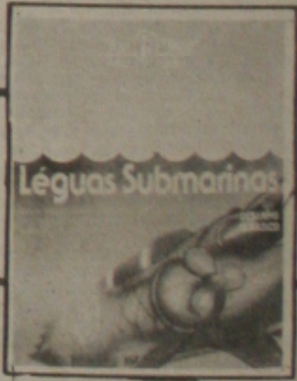
20.000 Léguas Submarinas (Twenty Thousand Leagues Under the Sea)

A noite, sonha com interessantes e excitantes montagens para seu espetáculo. Durante o dia, vive o pesadelo de ser perseguido sem conhecer o motivo. Ao intercalar as imagens do violento mundo dos traficantes com grandes trabalhos de coreografia e música, o filme estabelece o suspense necessário, e uma combinação entre beleza e terror que alcança seu equilíbrio definitivo nas cenas finais.