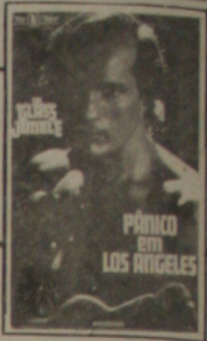
Pânico em Los Angeles (The Glass Jungle)

Mais uma vez o cinema denuncia o problema comum à todas as grandes cidades do mundo, apresentando de maneira clara a fragilidade dessas sociedades, e a que ponto pode chegar a violência nos dias atuais, quando o crime organizado tem livre acesso a todo tipo de armas e informações.