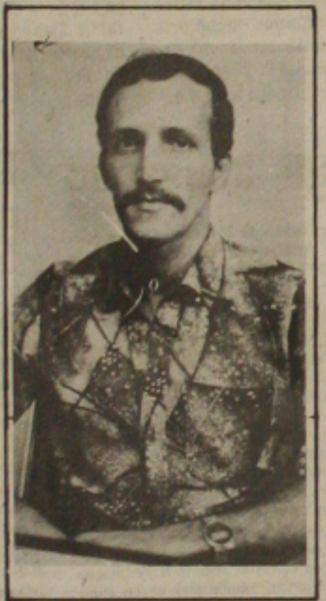
cer os fatos. As pessoas que acharam o corpo foram arroladas como testemunhas, mas ainda não tem data definida para prestar depoimento...