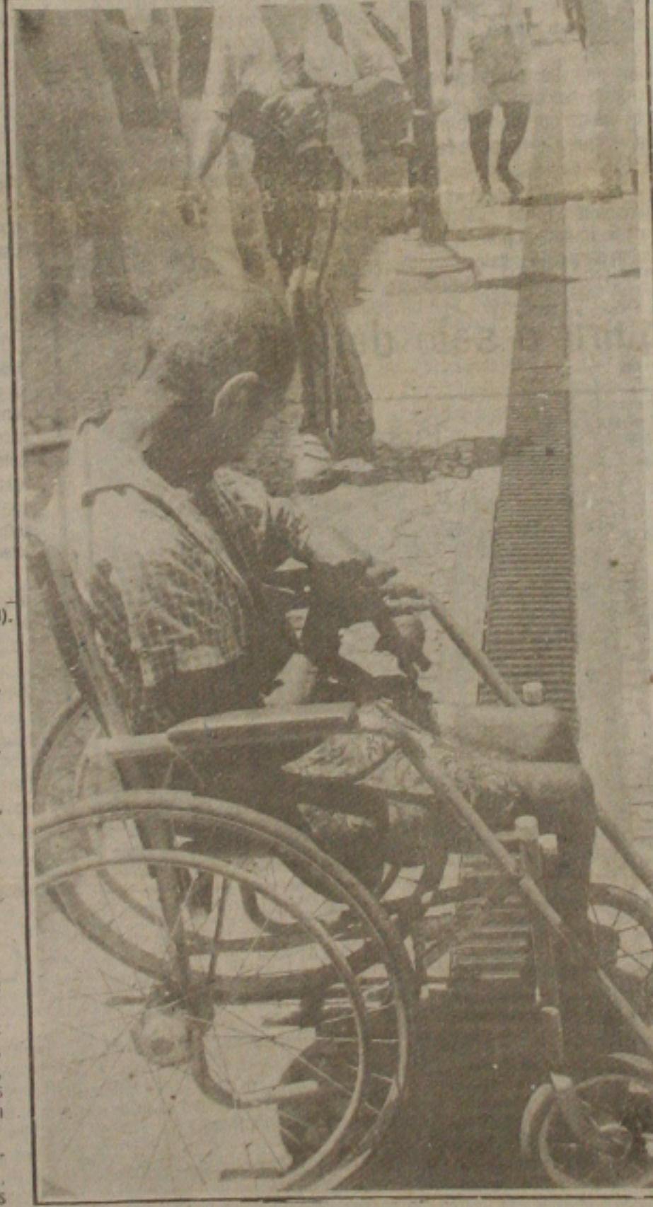
A mendicância invade o centro de Aracaju num desafio à sociedade

O Nordeste quando comparado com outras regiões do mundo, apresenta um índice de pobreza altíssimo. Até bem pouco tempo era classificado como a sétima região do mundo onde a maioria de seus habitantes padeciam de fome crônica, segundo relatório da ONU. E em consequência da grande desnutrição, falta de empregos e da má saúde, registrou-se um índice de mortalidade infantil bastante significativo. A evasão escolar por sua vez apresenta dados estonteantes. E como não poderia deixar de ser, a cidade de Aracaju, encravada no Nordeste, acolhe, nos dias atuais, centenas de nordestinos procedentes de outras cidades, que buscam melhores dias, e findam caindo na mendicância. E nas ruas centrais onde se concentram muitos mendigos, que vão desde mutilados, paralíticos, idosos com seus filhos ou ainda aquelas mães adotivas, ocasionalmente, que pedem emprestados meninos desnudos e desnutridos. (Página 2).