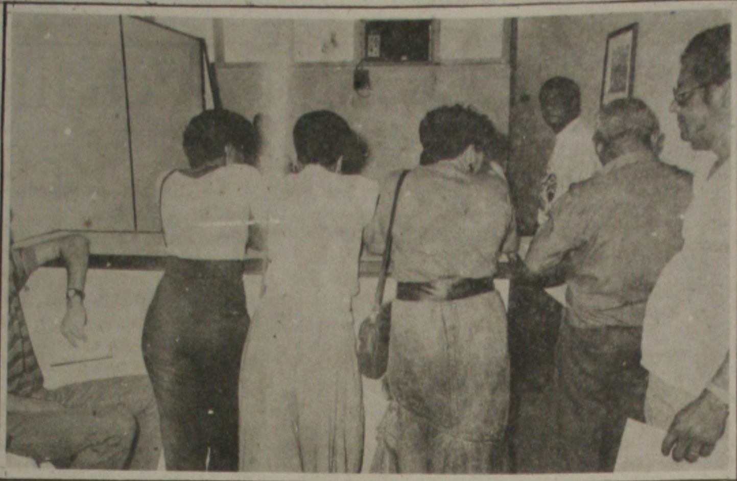
Servidores fazem opção por emprego.

Outra meta é apoiar as aspirações dos Departamentos, manifestadas nos planos de atividades departamentais; implementar ações que favoreçam a manutenção e reequipamentos dos recursos didáticos, para dinamização do ensino aprendizagem e defender a Universidade pública e gratuita.