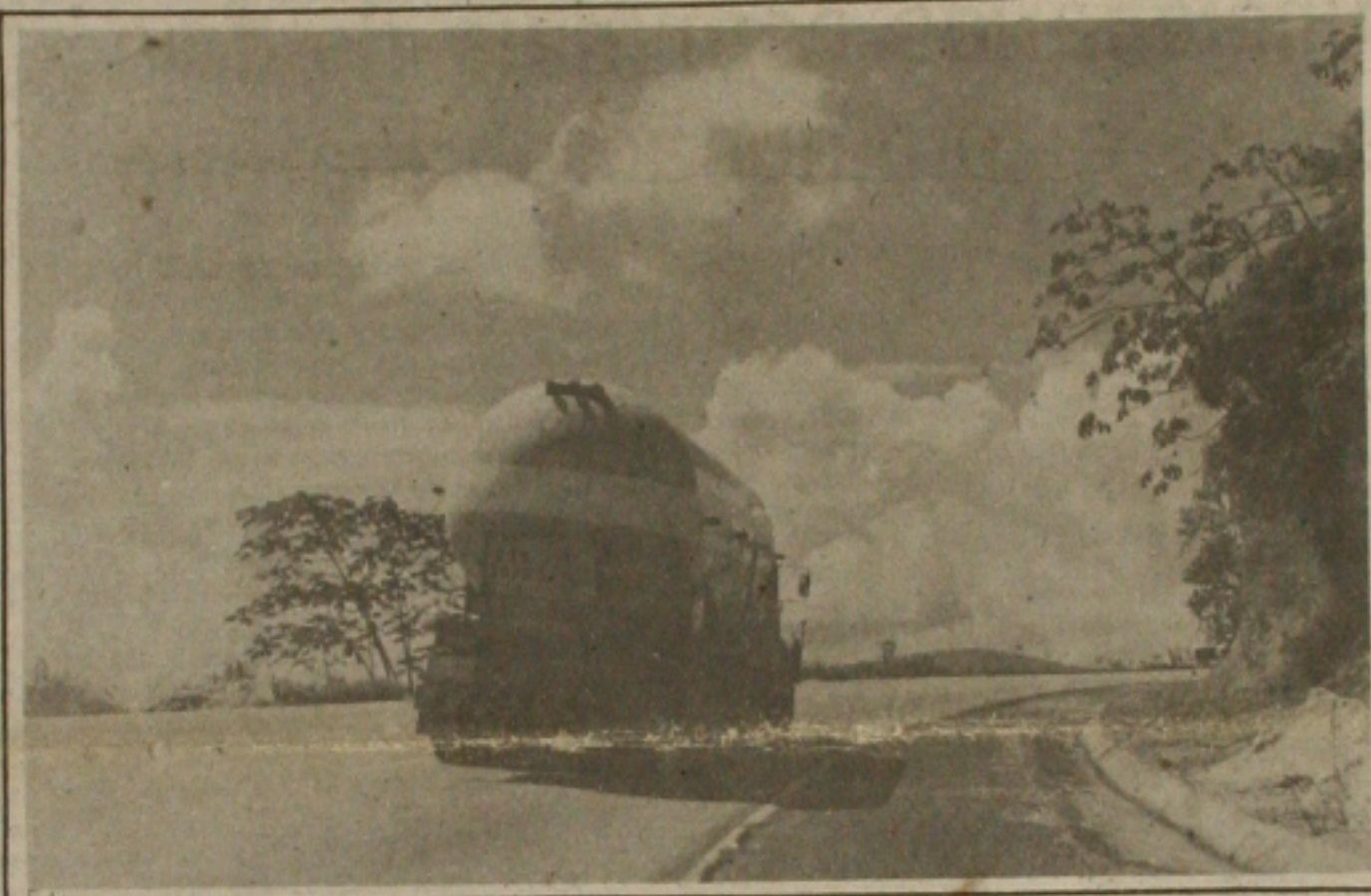
Nas rodovias a obrigatoriedade dos selos para pedágio.