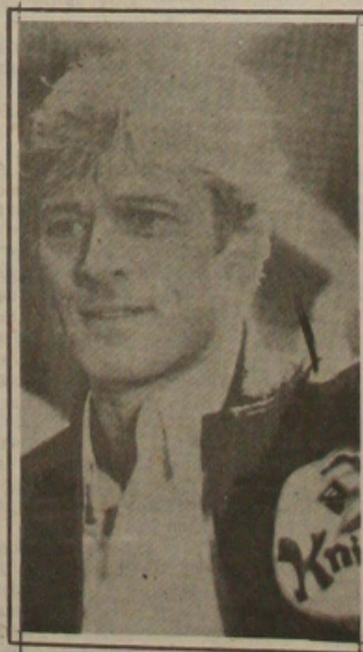
Redford em Um Homem Fora de Série.

99 min. EUA, 1961. Direção: Harry Keller. Com Sandra Dee, John Gavin, Charles Drake, Virginia Grey. Segundo filme da série com a provinciana Tammy, aqui interpretada por Sandra Dee. Desta vez acompanham-se suas aventuras na universidade. Neste horário, só para insones leitoras de "Carícia".