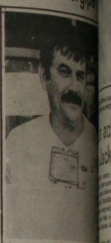
Presidente da CUT, Rômulo Rodrigues.

Até a próxima terça-feira, 28, as entidades de classes deverão promover assembleias gerais em cada universidade do país para discutir e aprovar o calendário proposto pelo Conselho de Representantes. No dia 26, domingo, acontecerá uma plenária nacional dos servidores públicos em Bra-