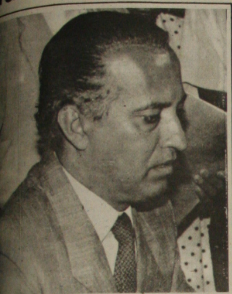
Governador afirma que não tem medo de pressão e chantagem e que vai continuar administrando para os sergipanos.