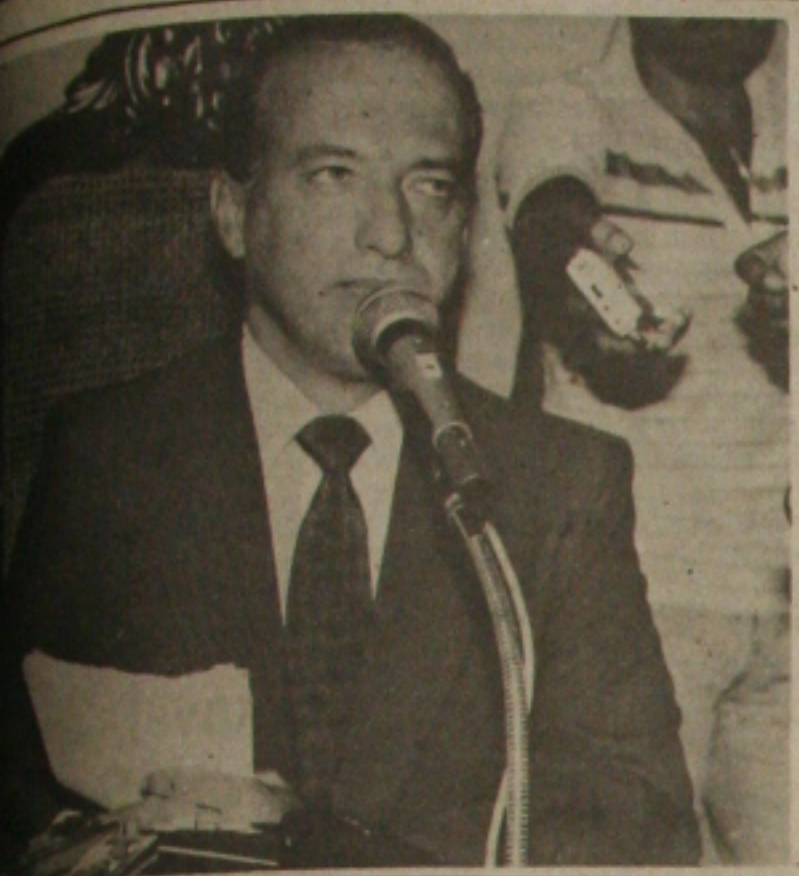
denuncia na TV uma forte pressão e até chantagem contra o seu Governo.