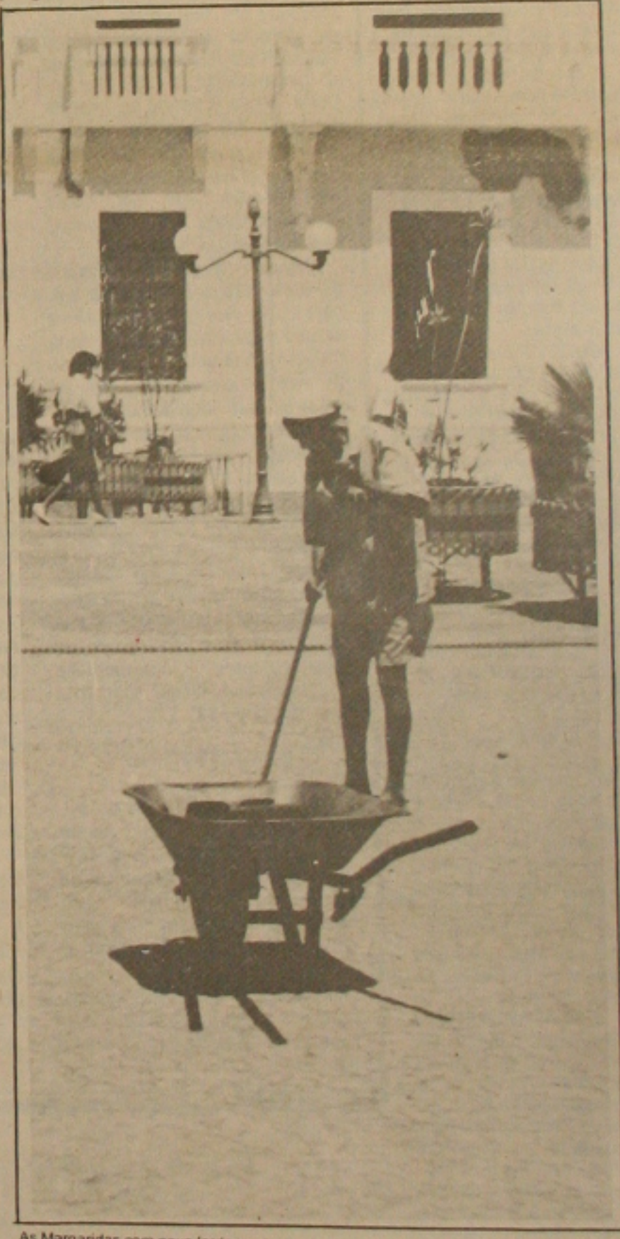
As Margaridas com novo fardamento.

O governador Antônio Carlos Valadares, acompanhado de representantes dos trabalhadores sem terras que invadiram a Fazenda Cuiuri, em Pacatuba, foi recebido ontem em audiência pelo ministro da Agricultura, Iris Rezende, oportunidade que foi tratar da desapropriação da área ocupada pelos invasores. O ministro garantiu ao governador de Sergipe que vai agilizar os processos de desapropriação de sete áreas em nosso Estado para promover a reforma agrária, permitindo o assentamento de mais trabalhadores rurais sem terras. Iris Rezende elogiou o gesto do governador Valadares, que pessoalmente e acompanhado das partes interessadas, foi tentar a solução do litígio junto ao Ministério da Agricultura. Durante a audiência, Valadares convidou o ministro para visitar Sergipe e ele aceitou o convite, ficando de definir a data posteriormente. Iris Rezende é um dos nomes do PMDB-que disputará a indicação para ser candidato à presidência.