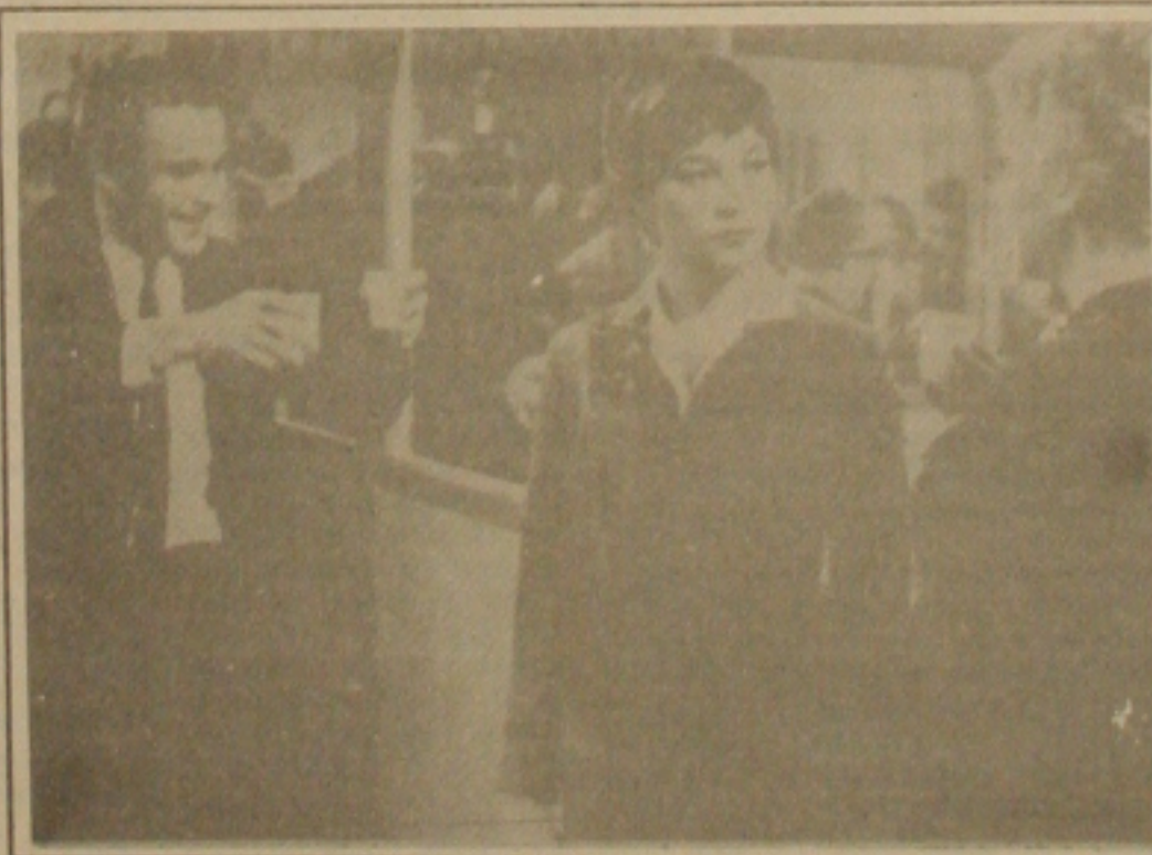
Jack Lemmon (à esq.) é um solteiro que se apaixona pela amante do patrão (Shirley McLaine, à dir.), em "Se Meu Apartamento Falasse", filme de Billy Wilder.