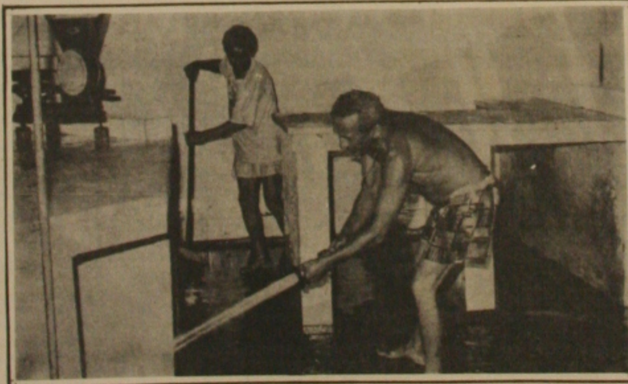
O fim da sujeira: o velho mercado do Siqueira Campos é lavado pela equipe de limpeza da Prefeitura de Aracaju.

tos, no plenário "Deputado Pedro Barreto" da Assembleia Legislativa, para os deputados e as pessoas que se interessarem pelo assunto. O objetivo principal da programação da Comissão Constitucional do Estado, é discutir cada vez mais a elaboração da Constituição Estadual, além de colher mais subsídios para o trabalho que vem sendo feito pelos parlamentares estadual.