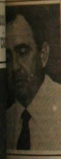
...dividido e diz...