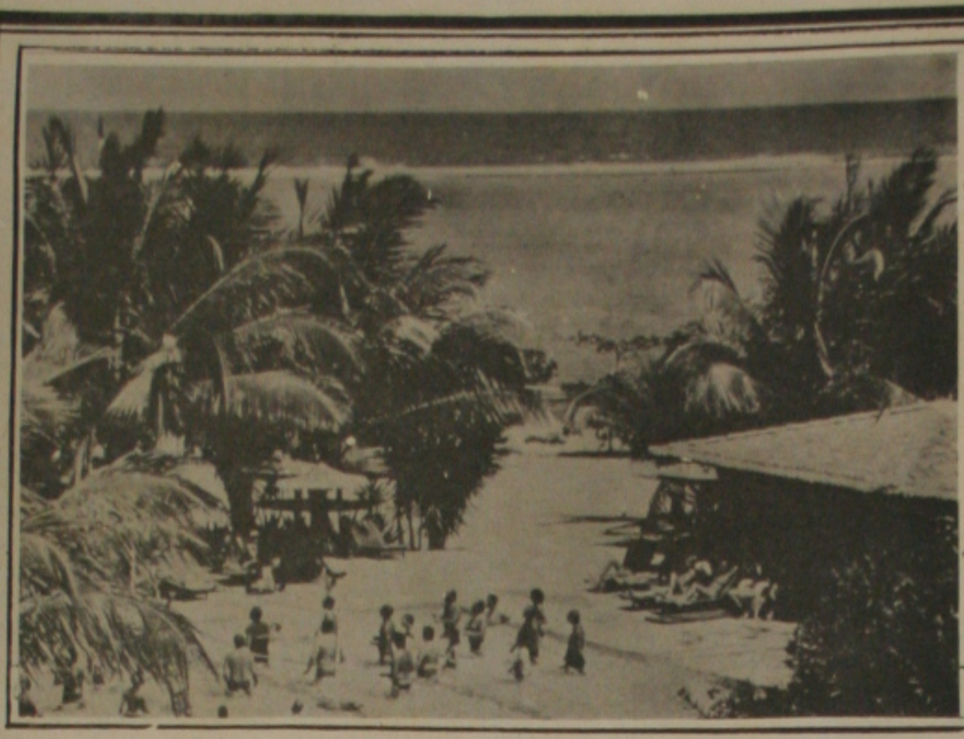
O lazer entre a piscina e o mar.