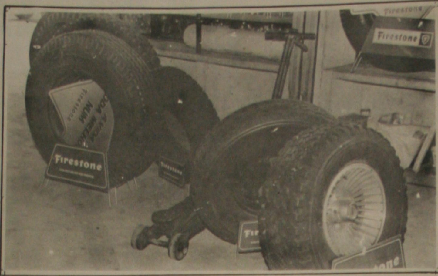
Comércio de pneumáticos enfrenta crise.