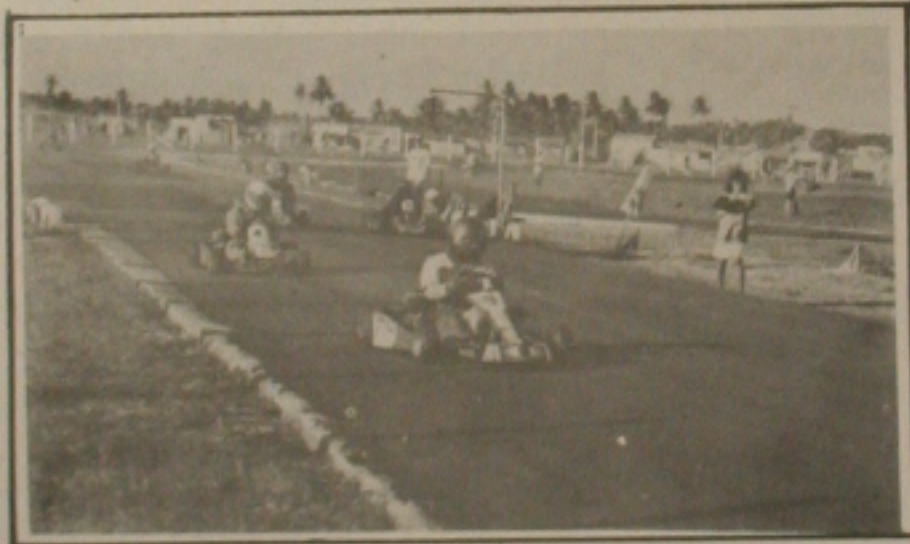
O torneio Viana de Assis de karts foi encerrado no último domingo com grande sucesso.