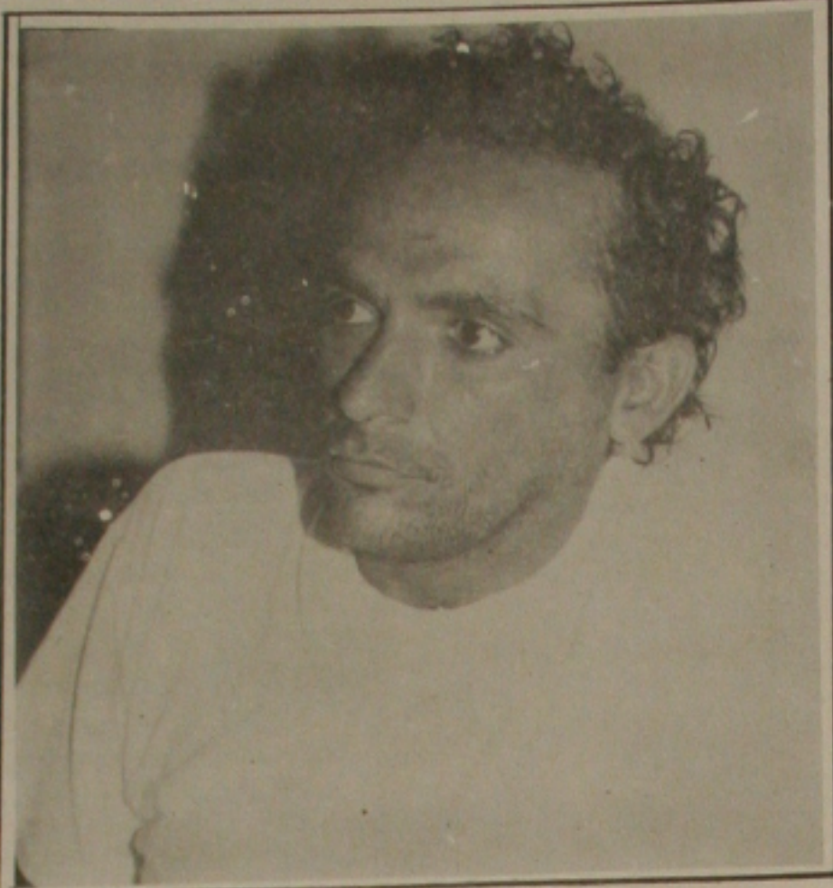
O Presidente do Guarani de Porto da Folha, acredita que o seu time vai disputar a divisão especial.