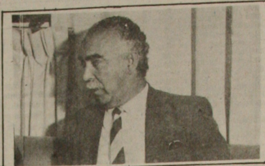
Paixão admite até à dissidência com seu partido, se for obrigado a apoiar a candidatura do deputado Lula.

Eu digo isso — enfatizou Paixão —, porque as posições assumidas por esse vereador são extemporâneas, grotescas, brutas. Quando ele se refere a essa questão, não tem respos-