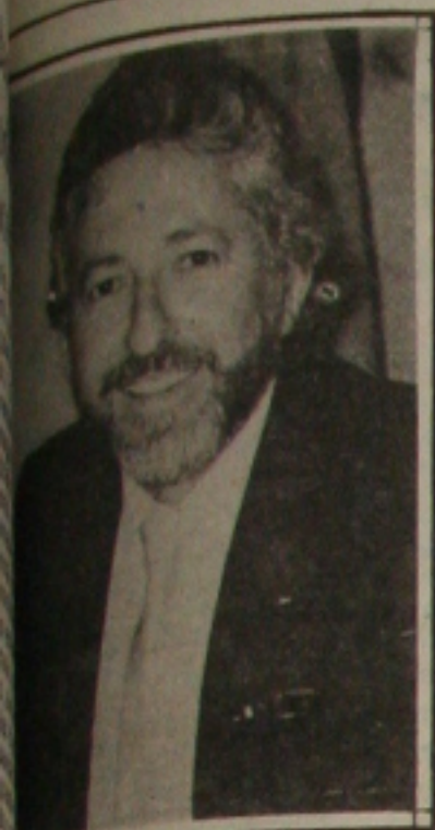
Paixão explica ao prefeito sobre au-