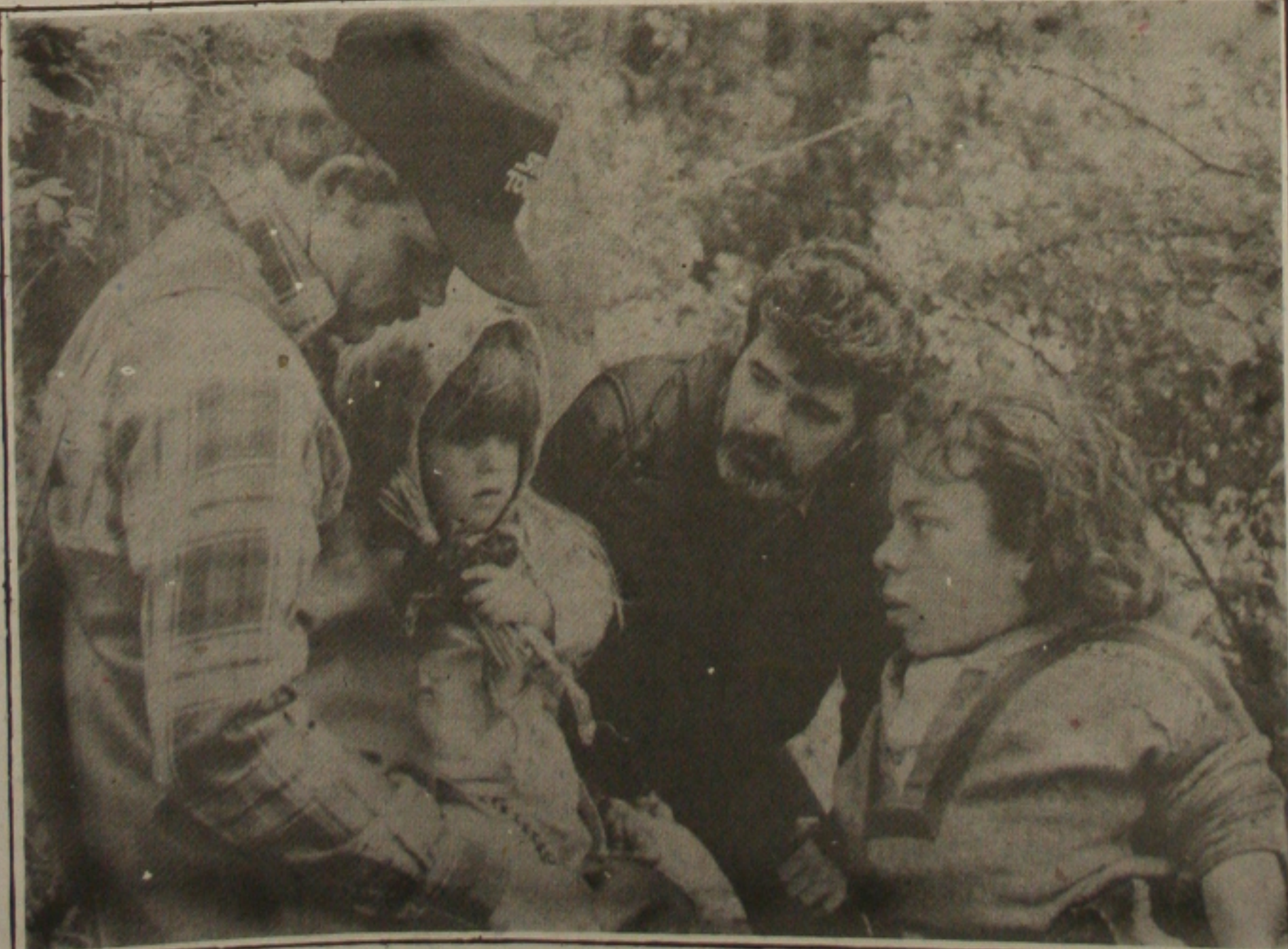
Foto: Ron Howard a esquerda, e George Lucas, de barba, são ator e diretor em "Loucuras de Verão". Trabalharam juntos novamente como diretor e produtor respectivamente, em Willard (foto).