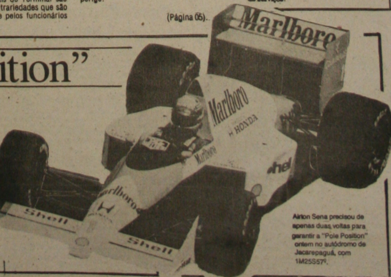
Ayrton Senna precisou de apenas duas voltas para garantir a "Pole Position" ontem no autódromo de Jacarepaguá, com 1m25s572.

Alain Prost, ao contrário de Senna, preferiu esperar para entrar na pista na segunda metade dos treinos, quando faltavam apenas 13 minutos para o fim. Fez 1m26s879 - quase dois décimos de segundo abaixo do seu tempo no dia anterior - mas ainda ficou atrás de Senna, Patrese, Berger, Boutsen e Mansell. Trocou os pneus e melhorou mais dois décimos, fazendo 1m26s620, passando a frente de Mansell e garantindo o quinto lugar