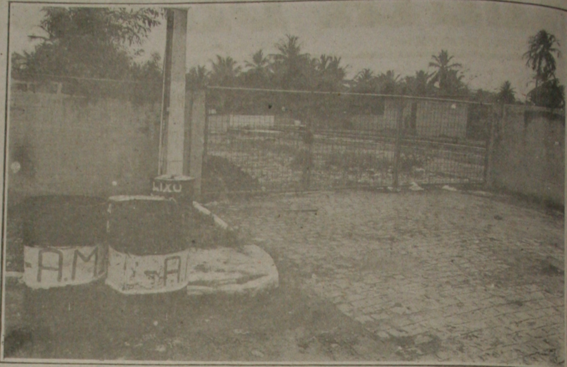
Todo o conjunto é prejudicado pela sujeira do esgoto, que transmite até doenças.

Todo este conjunto de ações, revelam o andamento do trabalho do Governo dentro da política agropecuária, demonstrando um esforço grande e a consciência tranquila do governante, pois estribado está o governo na certeza do estabelecimento de uma infraestrutura cada vez mais sólida, garantindo uma ascensão participativa considerável do setor, na economia do Estado de Sergipe, concluiu Paulo Viana.