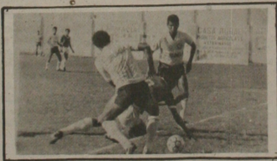
MARUINESE X SERGIPE