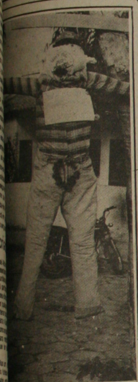
...é pendurado na árvore e queimado pelo povo.

Como garantia de vida, o menor concedeu a entrevista a Lúcia Almeida contra à luz, justamente para não ser identificado por membros da Polícia. Mas o esforço da jornalista não adiantou em nada, porque os exterminadores o reconheceram e o fuzilaram. Após o crime os assassinos fugiram e a única informação é que eles estavam num veículo tipo gol, vermelho e sem placas. (Página 7).