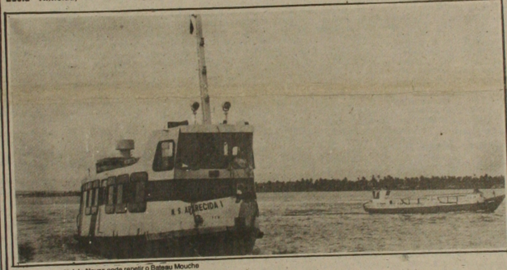
Travessia para Atalaia Novas pode repetir o Bateau Mouche

No sábado de aleluia - alegria, o aracajuano que ontem de usar o transporte não teve bons motivos para ficar alegre. E que entrou em vigor a zero hora o aumento de 33,3 por cento para a passagem dos ônibus urbanos, o que elevou a tarifa de 12 para 16 centavos. O aracajuano protestou contra o aumento, por considerá-lo bastante elevado, principalmente por que os seus salários estão congelados pelo Plano Verão. (Página 5).