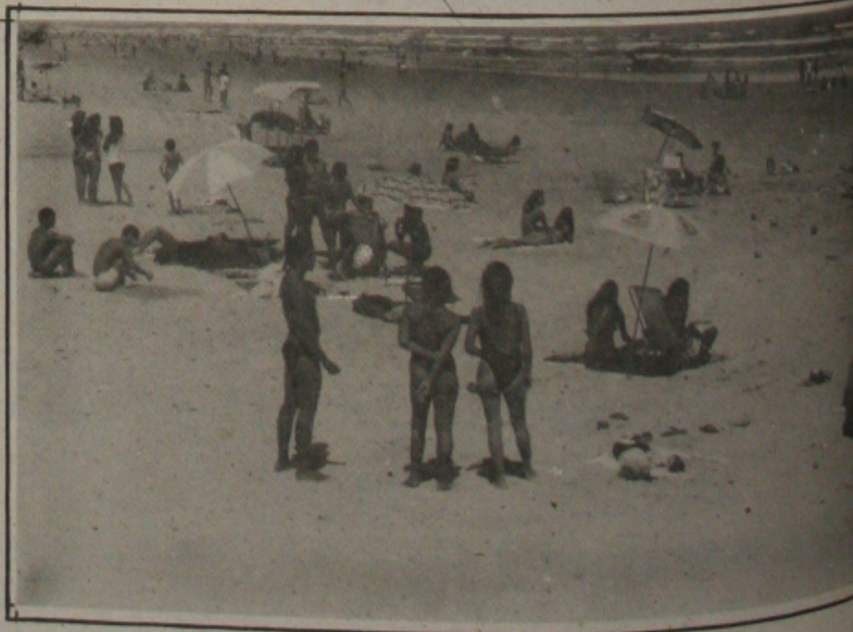
A Semana Santa levou muita gente as praias de Aracaju.