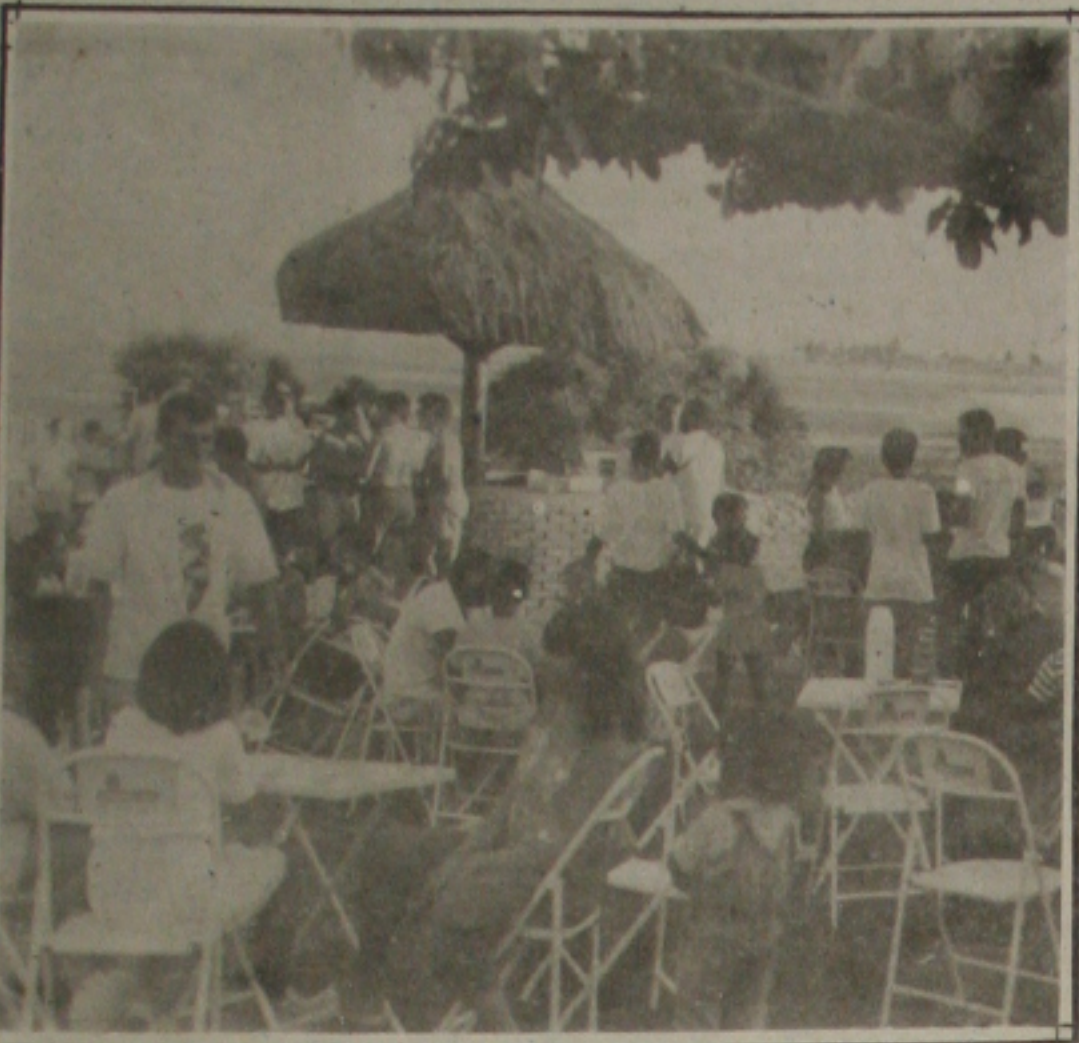
O Calçadão da Praia 13 de Julho é um ótimo ponto de encontro da juventude.