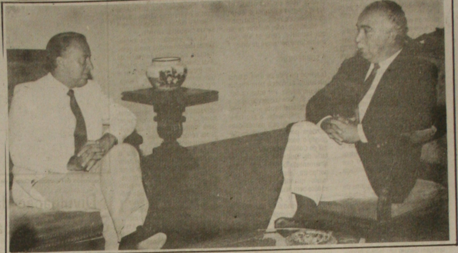
Valadares e Paixão assinam convênio.