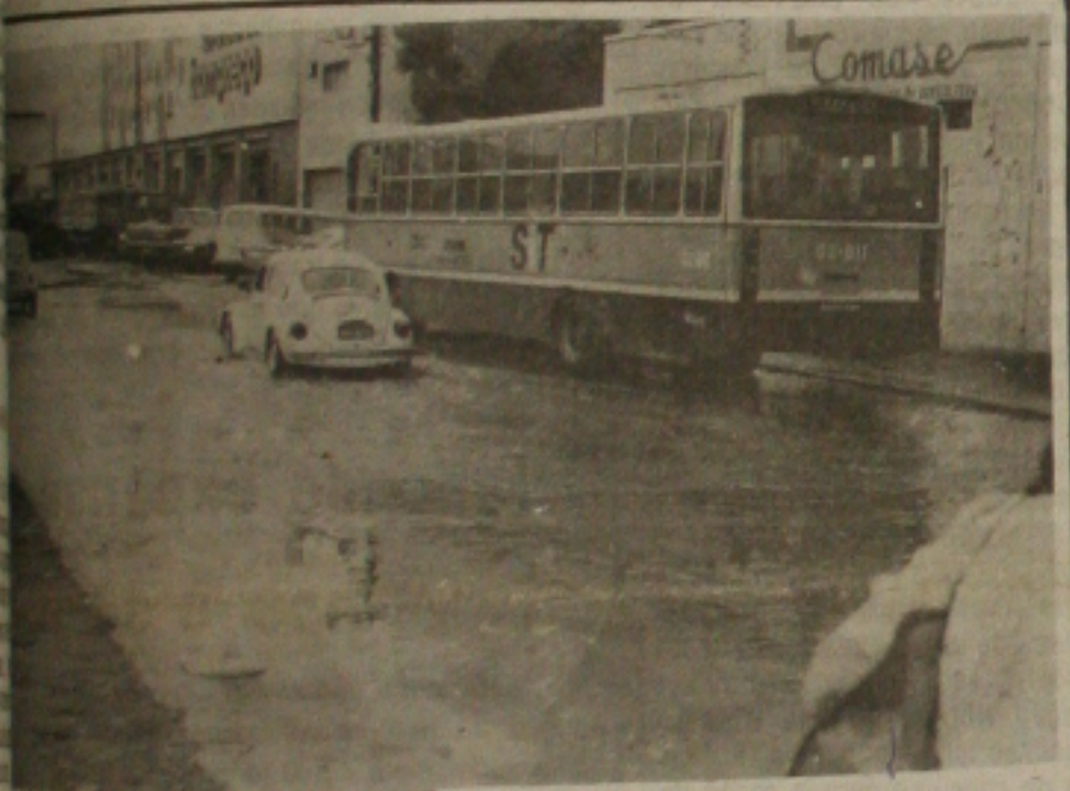
Ruas ficaram inundadas com as chuvas que caíram ontem, neste começo de inverno.