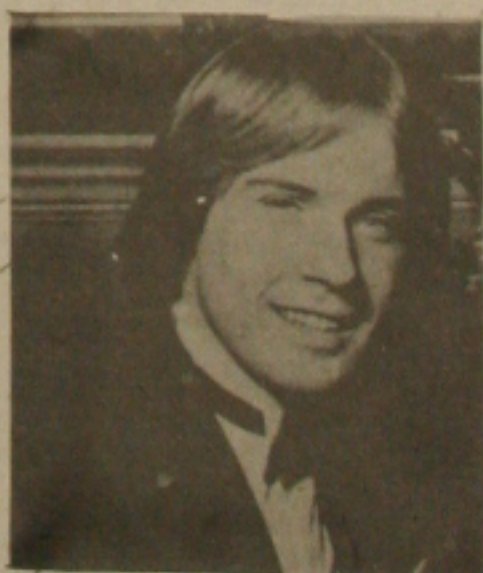
O pianista Richard Clayderman faz o especial desta quinta-feira.

O ecletismo da programação musical da Rede Manchete se confirma mais uma vez: a atração do próximo dia 30 de março é o pianista francês Richard Clayderman, consagrado mundialmente como um dos melhores pianistas românticos da atualidade. Adorado pelas multidões que frequentam seus shows e detestado pela crítica, ele hoje é um verdadeiro fenômeno comercial: já vendeu mais de 40 milhões de cópias em todo o mundo. Richard Clayderman já esteve no Brasil duas vezes para shows de proporções sempre exageradas: suas apresentações sempre acontecem em grandes estádios e teatros. Em 1981, ele esteve em São Paulo e, em 1986, em turnê pelo Brasil: Hotel Nacional do Rio, Belo Horizonte, São Paulo e Curitiba. Confirmando todo esse sucesso, seus 177 discos de ouro e 42 de platina.