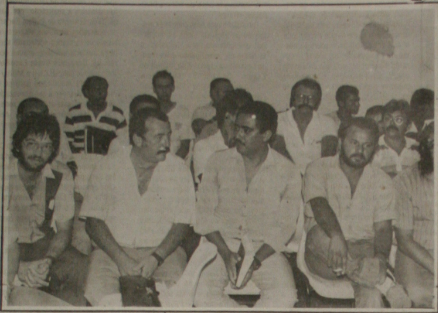
Dirigentes profissionais preocupados com o futuro do futebol sergipano.