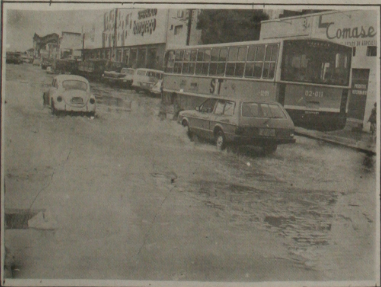
Chuvas alagam ruas e avenidas de Aracaju.

É a GAZETA DE SERGIPE de mãos dadas com o empresariado de nosso Estado.