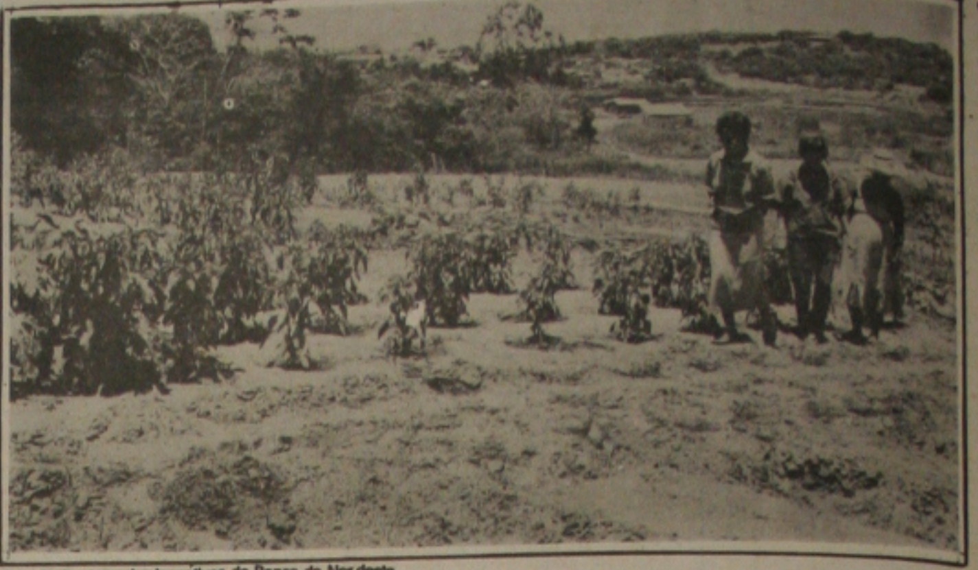
A agricultura recebe incentivos do Banco do Nordeste

"os bons empregos são procurados e não oferecidos". De Peter Drucker, em "Entrepreneurship" (1985).