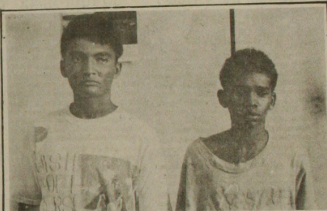
Polícia prende menores assassinos, 24 horas depois do crime.