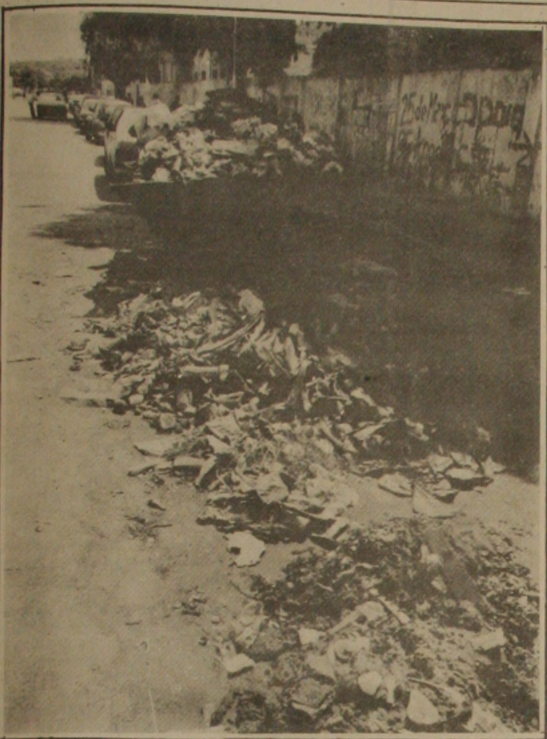
O lixo se espalha pelas ruas, com a greve do pessoal da Prefeitura.

Ontem, também, o governador Antônio Carlos Valadares distribuiu carta com os professores da rede estadual, em que justifica o veto e assegura que vai conceder o piso móvel, mas "nunca ao arrepio da lei, e sim, com inteira submissão a ela". (Página 03).