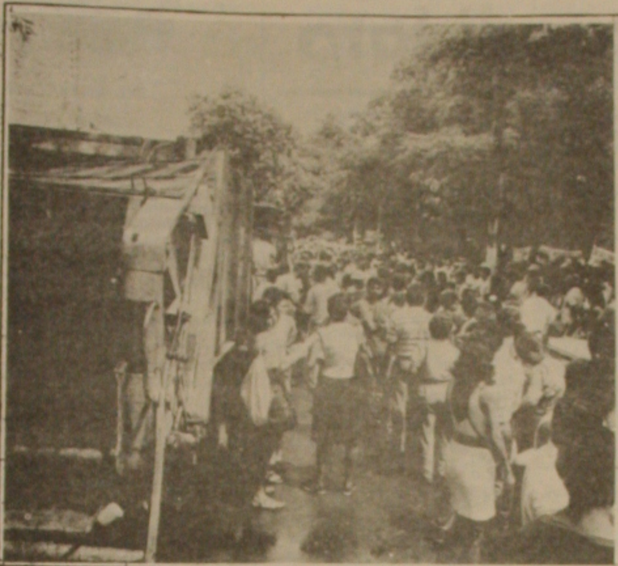
Com caminhões da coleta do lixo e a presença de cerca de mil manifestantes, os servidores da Prefeitura fizeram ato público em frente ao Palácio Ignácio Barbosa.

Mas a denúncia mais grave atingiu diretamente o setor hoteleiro no Estado. Segundo as denúncias dos servidores, os hotéis de grande porte chegam a ter descontos que variam entre 50 e até a isenção total dos tributos. "Tem hotéis de um mesmo grupo de bom que se frise, que pagam 100 por cento do tributo, enquanto outro paga apenas 50 por cento do valor total e outros até são beneficiados e nada pagam por que simplesmente seu proprietário tem ligação com o prefeito, e isto é inconstitucional, porque não se pode cobrar tributos diferenciados em setores que exercem a mesma atividade", reclamam os servidores.