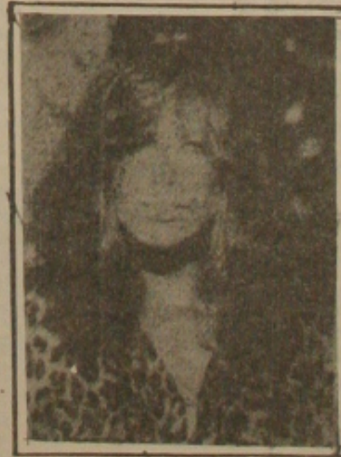
Carly Simon e Fredy Mercury são atrações de Estação Shock.