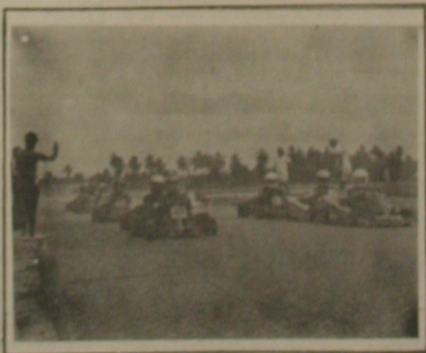
Domingo a largada para a segunda etapa do Sergipeano de Kart.

Ultimamente o kart vem se tornando no Estado de Sergipe um esporte de integração com outros atletas e isso tem contribuído para a busca de melhoria do desempenho dos sergipenses. Alguns veteranos sergipenses são convidados para o sucesso das provas, sendo com que seja hoje o kart o segundo resultado de um trabalho integrado ao Associação Sergipense de Kart que desde a temporada passada resolveu formar equi-