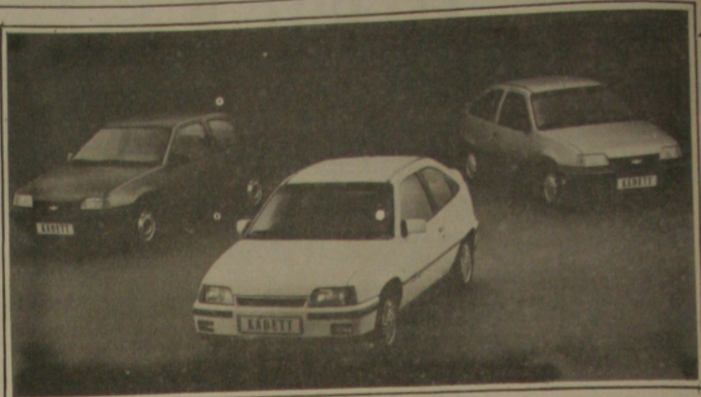
A linha Kadett, da GMB, nos modelos standart luxo e esportivo.

10. A vantagem antevista na NPI, é a perda da conotação individualizada dos programas de investimento, e o favorecimento da análise de toda a cadeia produtiva, a conferir.