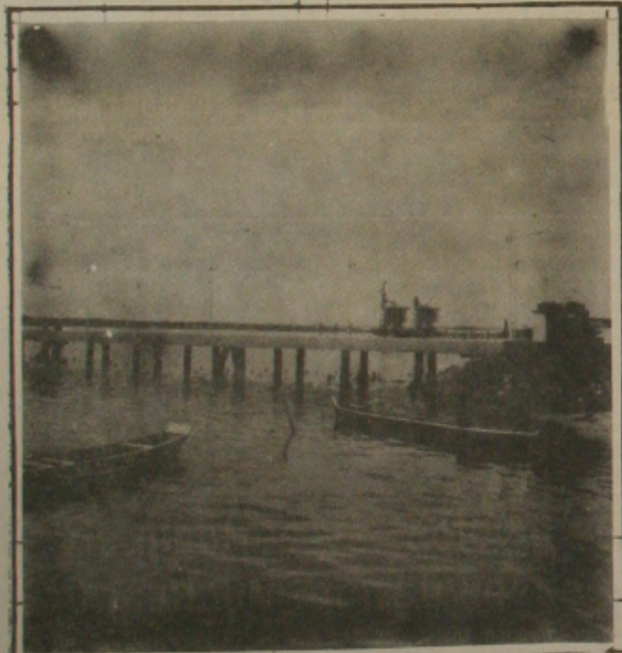
Atracadouro do Bairro Industrial.