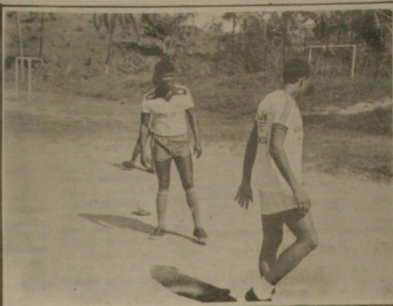
Proletários treinaram ontem nos dois expedientes, no Parque da Cidade.