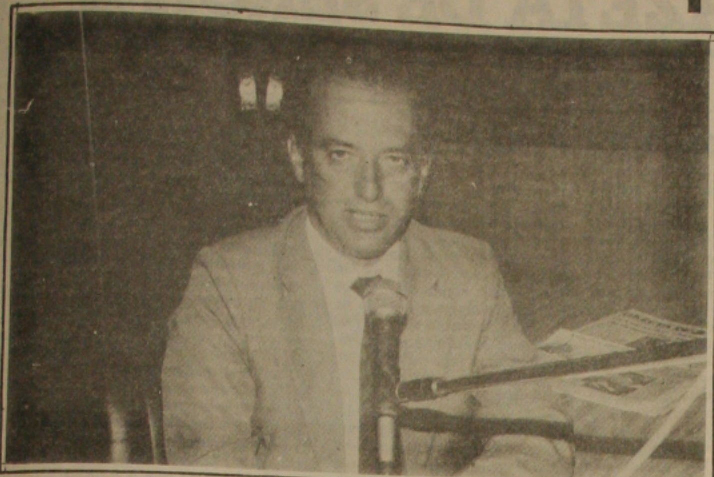
Valadares: "maior aumento concedido em todo o País"