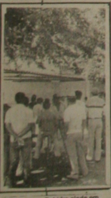
Servidores da Cohidro ainda em greve.

Com relação ao posicionamento do Governo em extinguir o órgão caso a greve permaneça, Marcelo Ribeiro considerou absurda a possível extinção alegando que "este tipo de retaliação em nada favorece o Governador Antonio Carlos Valadares. "É por esta política de pessoal - disse o parlamentar - que o Governador está perdendo a credibilidade", finalizou.