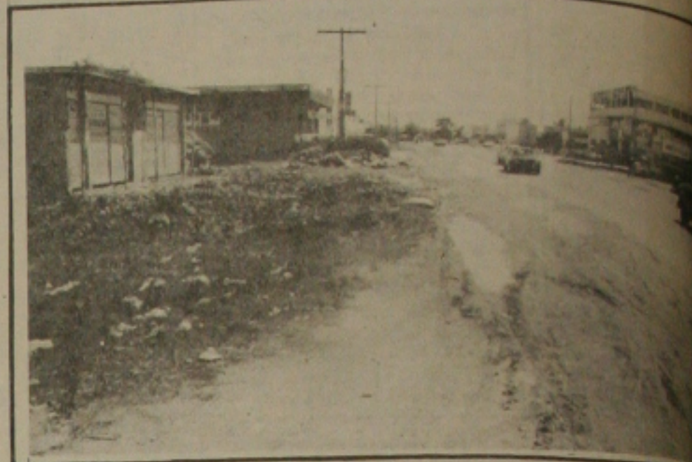
Sugerida pista dupla na Av. Osvaldo Aranha.