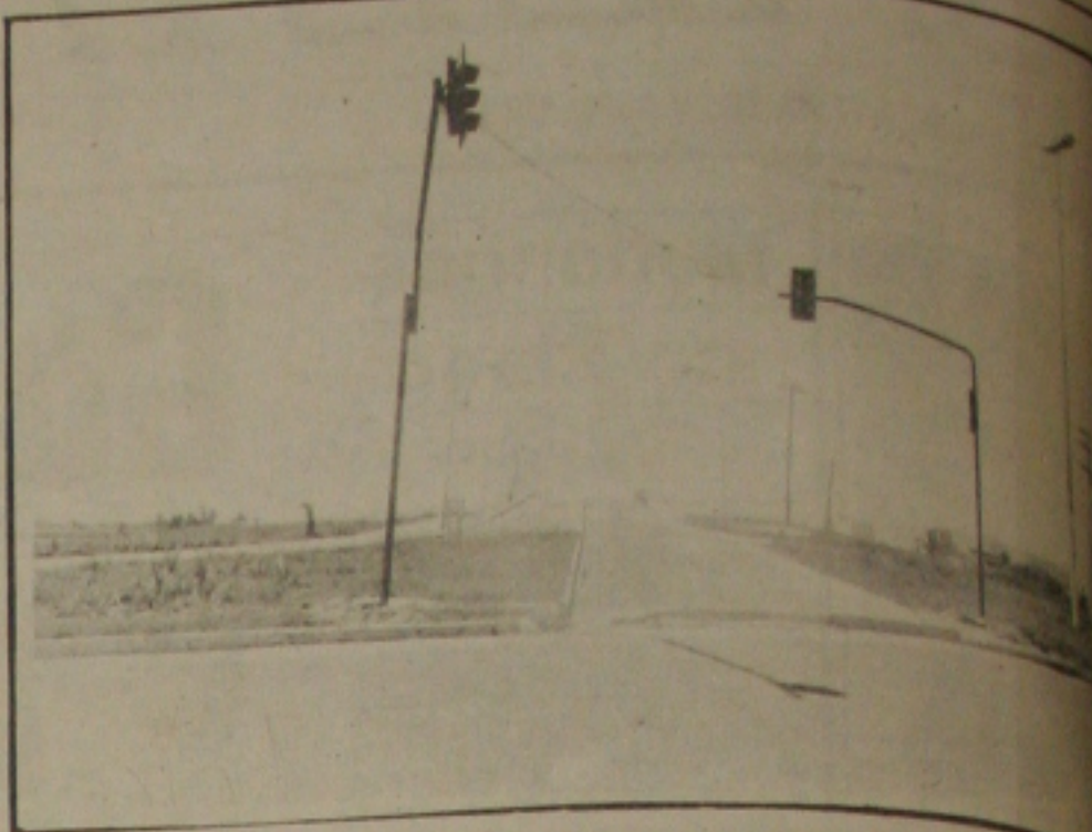
Arquiteto é contra a instalação dos 2 semáforos próximos ao Shopping Center Rio Mar.

"O que nós não aceitamos - enfatizou Jorge Aragão - é que onde há salários arrojados, perda de poder aquisitivo, a UFS apresente uma majoração de preço que atinge mais de 1 mil por cento", enfatizou o presidente da Associação referindo-se à elevação do preço limite que passou de NCZ$ 0,01, (dez cruzeiros antigos), para NCZ$ 0,60 (seicentos cruzeiros antigos).