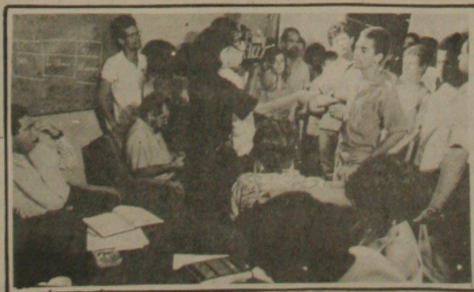
Estudantes, professores e servidores exigem explicações do Reitor.

Mas os estudantes não aceitaram os argumentos e cobraram um posicionamento do reitor quanto aos alimentos estragados que foram jogados fora há poucos dias. O reitor afirmou que os alimentos ficaram estragados em consequência dos problemas de manutenção da câmara frigorífica.