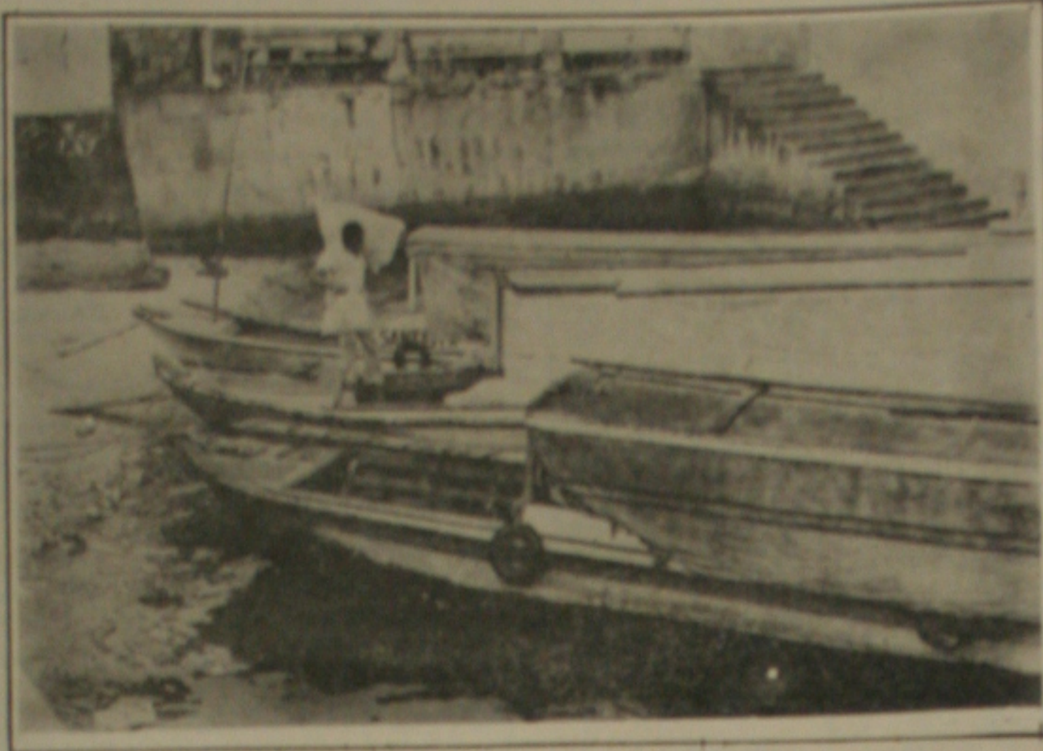
Capitania fiscaliza embarcações e exige cumprimento da lei.

Vera Siqueira prometeu em nome do Governo Valadares dar uma contribuição, dentro das possibilidades da Fundese, que também, disse, vem atravessando uma fase difícil devido o momento econômico brasileiro.