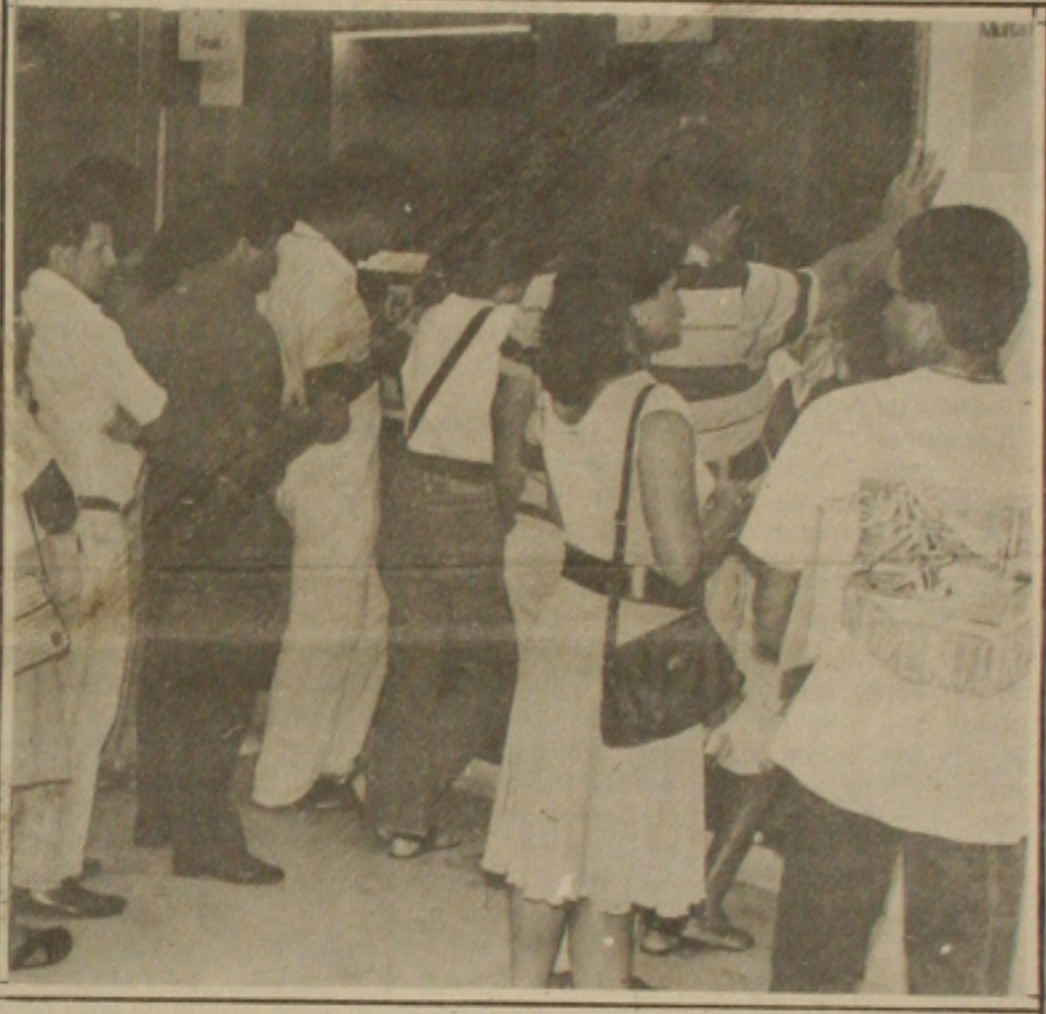
Bancos particulares voltam a funcionar normalmente.

Ainda assim, o movimento no Banco do Brasil e na Caixa Econômica Federal é significativo, o que está impedindo muitos contribuintes de obterem documentos necessários a declaração, como os juros do SFH. Essa foi a principal razão do adiamento do prazo de entrega da declaração, explicou Mustafa.