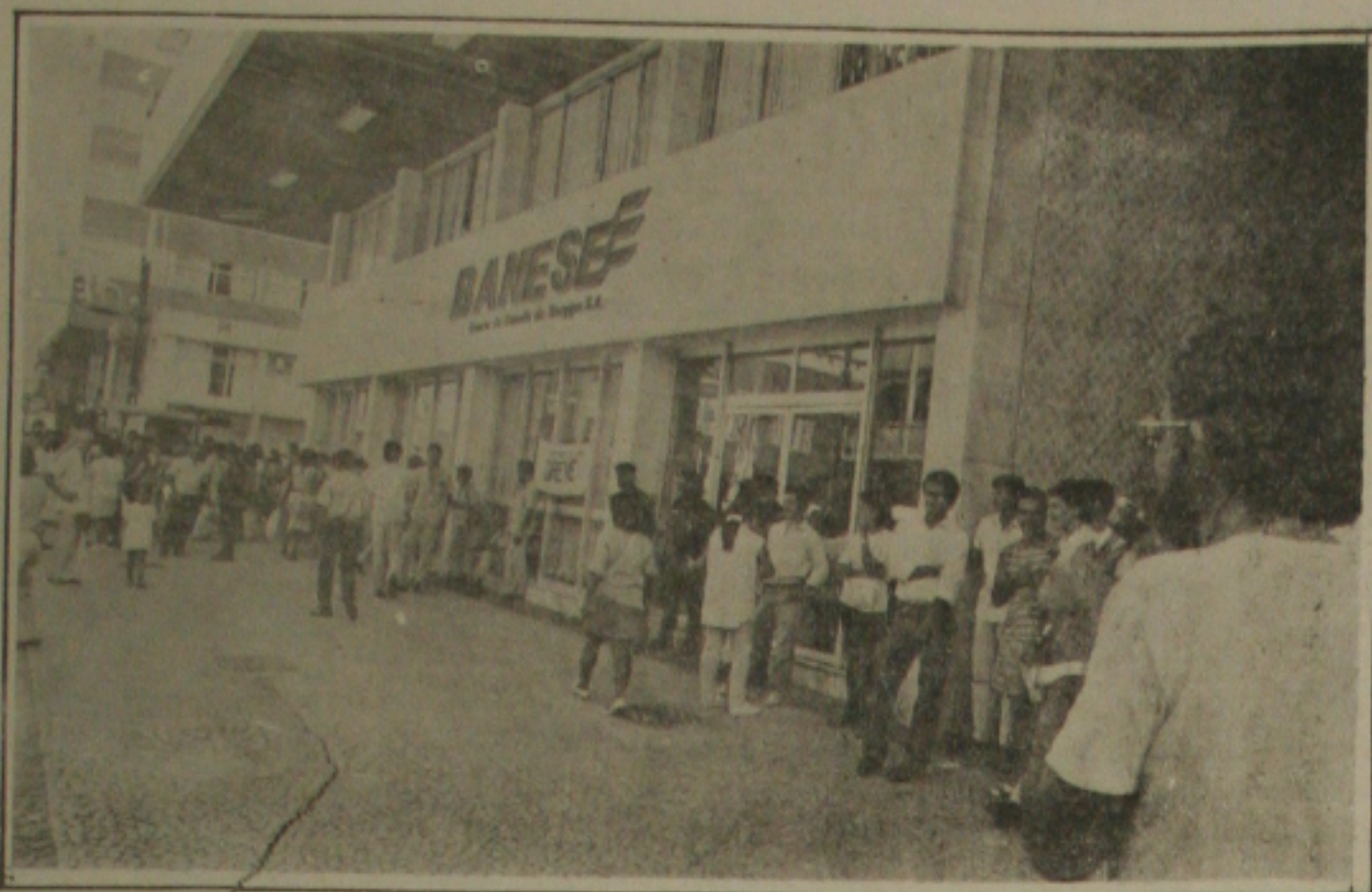
Servidores públicos ficam sem receber vencimentos devido à greve dos bancários.