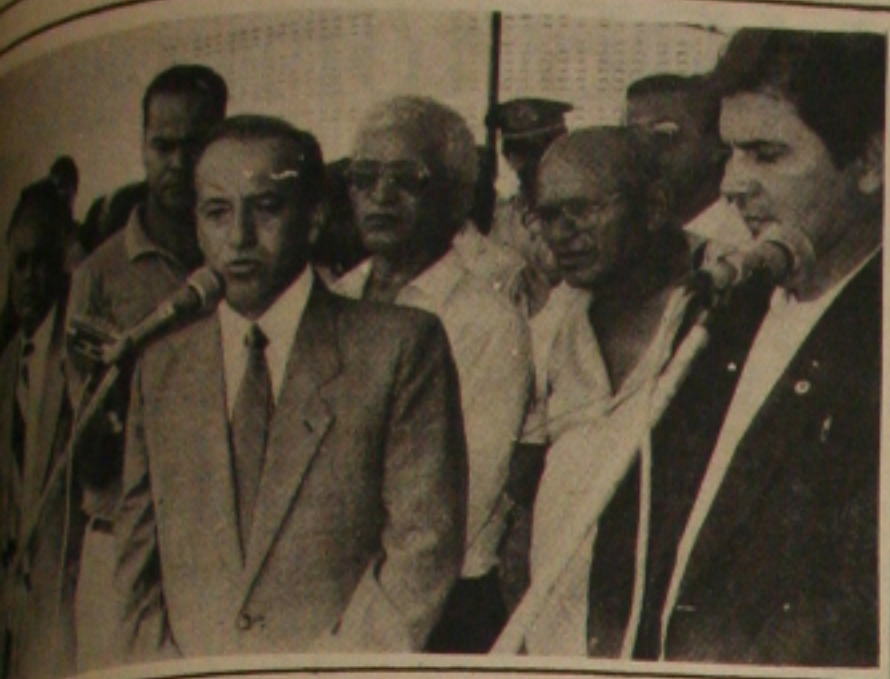
Governador Valadares destaca a opção do seu governo para a melhoria da qualidade de vida da população mais carente.