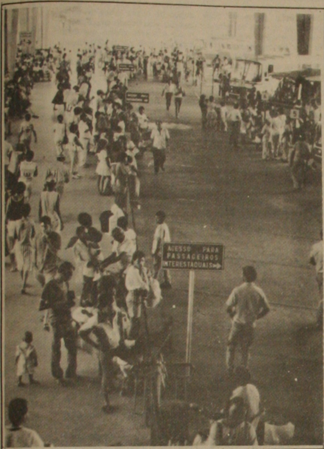
Milhares de pessoas deixaram ontem Aracaju, aproveitando o final de semana prolongado com o feriado desta segunda.

Brasília - Todo o efetivo da Polícia Federal no País está mobilizado para atuar diretamente nas greves a partir da próxima terça-feira, caso o Governo não consiga uma solução satisfatória que ponha fim as paralisações. Ao dar essa informação, um assessor do diretor geral do DPF, Romeu Tuma, que preferiu não se identificar, disse que o Governo tomará "medidas drásticas e duras" para normalizar a situação do País, e isso inclui a atuação integral dos efetivos da Polícia Federal em todos os setores atingidos pela greve. O assessor não definiu que tipo de atuação será destinada aos policiais do órgão.