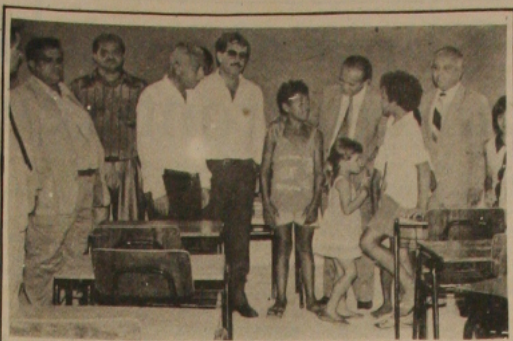
Ao visitar uma das salas de aula das escolas inauguradas, o governador conversa com as crianças, futuros alunos da escola.