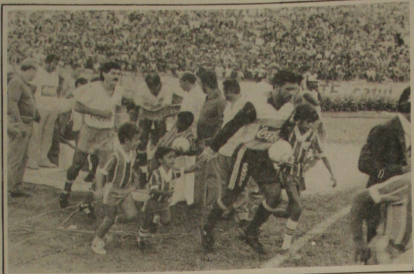
O Bahia, campeão brasileiro estará presente dia 11, na festa da ACDS.

Outra exigência do treinador é a criatividade e a ousadia: - Acho que temos que arriscar mais. Este negócio de chegar na linha de fundo e fazer aquele cruzamento cetinho para área, dificilmente dá certo, pois jogamos sempre contra times fechados e que colocam muita gente na área. As bolas podem ser bem alçadas, mas não surtem qualquer efeito.