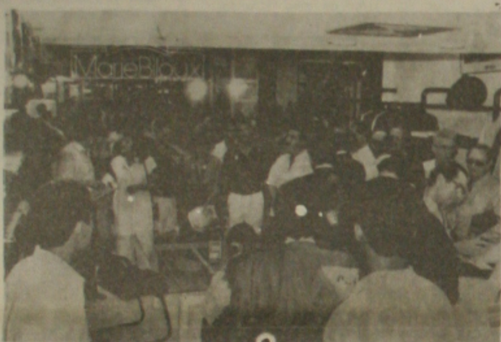
A visita de centenas de pessoas fizeram da Loja Hugo Boss Aracaju uma das mais badaladas lojas do Riomar Shopping.