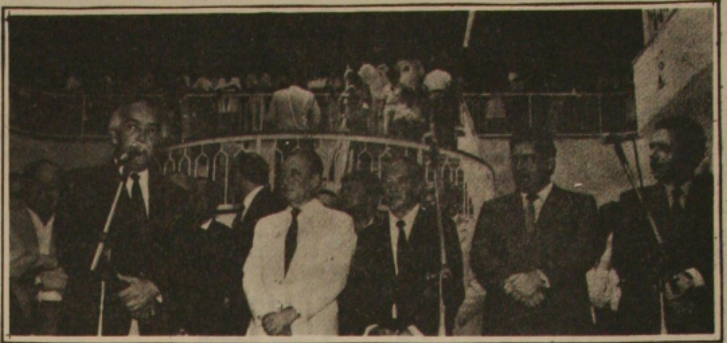
No palanque oficial, diversas personalidades de Sergipe e da Bahia, destacando-se no centro os governadores Waldir Pires e Antônio Carlos Valadares.

Técnico em Contabilidade Abertura de firmas, imposto de renda pessoa física e jurídica, escrituração fiscal e contábil e outros assuntos relacionados à contabilidade. Fone: 222-4407 à noite.