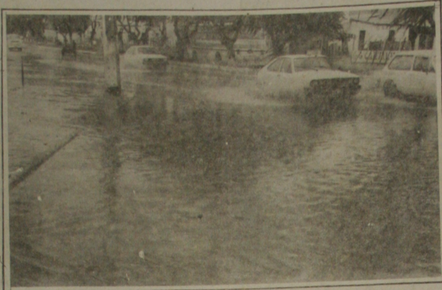
A avenida Hermes Fortes ficou alagada.

O secretário explicou que é proposta da Secretaria de Esporte, Lazer e Turismo a realização dessas Feiras de Artesanato nos bairros mais populosos da nossa capital. A I Feira de Artesanato do Conjunto Augusto Franco terá uma programação composta de atividades artísticas e culturais, comercialização de comidas típicas e uma área de lazer com várias brincadeiras e jogos para o divertimento da