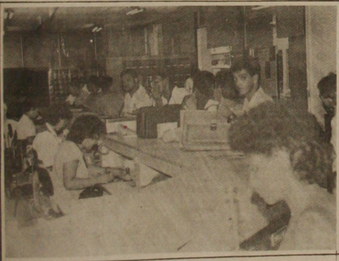
Nos Correios a greve anunciada não aconteceu e o movimento ontem foi normal.