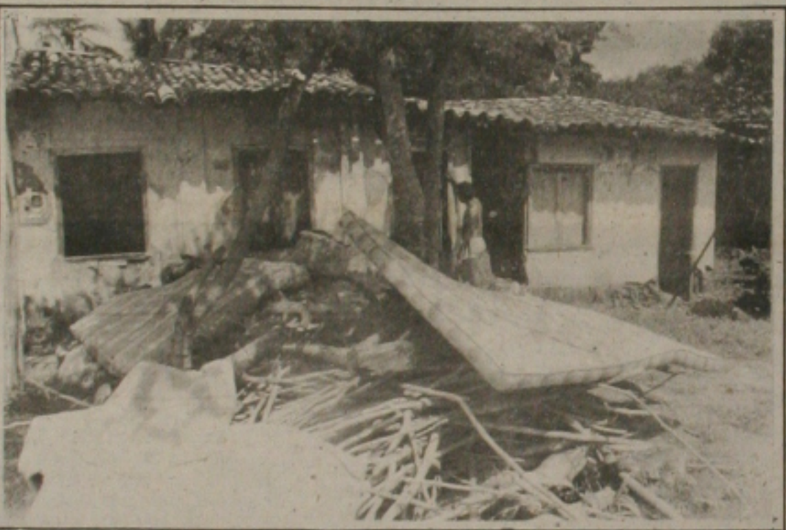
Restos de uma residência.