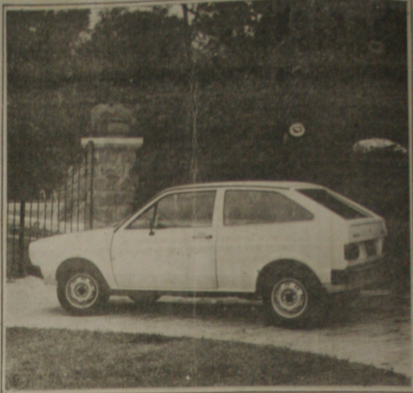
Carro a álcool pode ter sua produção limitada, em virtude dos problemas com o combustível.

10. Servidores federais estão em "estado de greve" desde ontem. Eles exigiam um reajuste salarial acima de 90% desde janeiro. Levaram menos de 20% a decretação ou não à greve fica para quinta-feira.