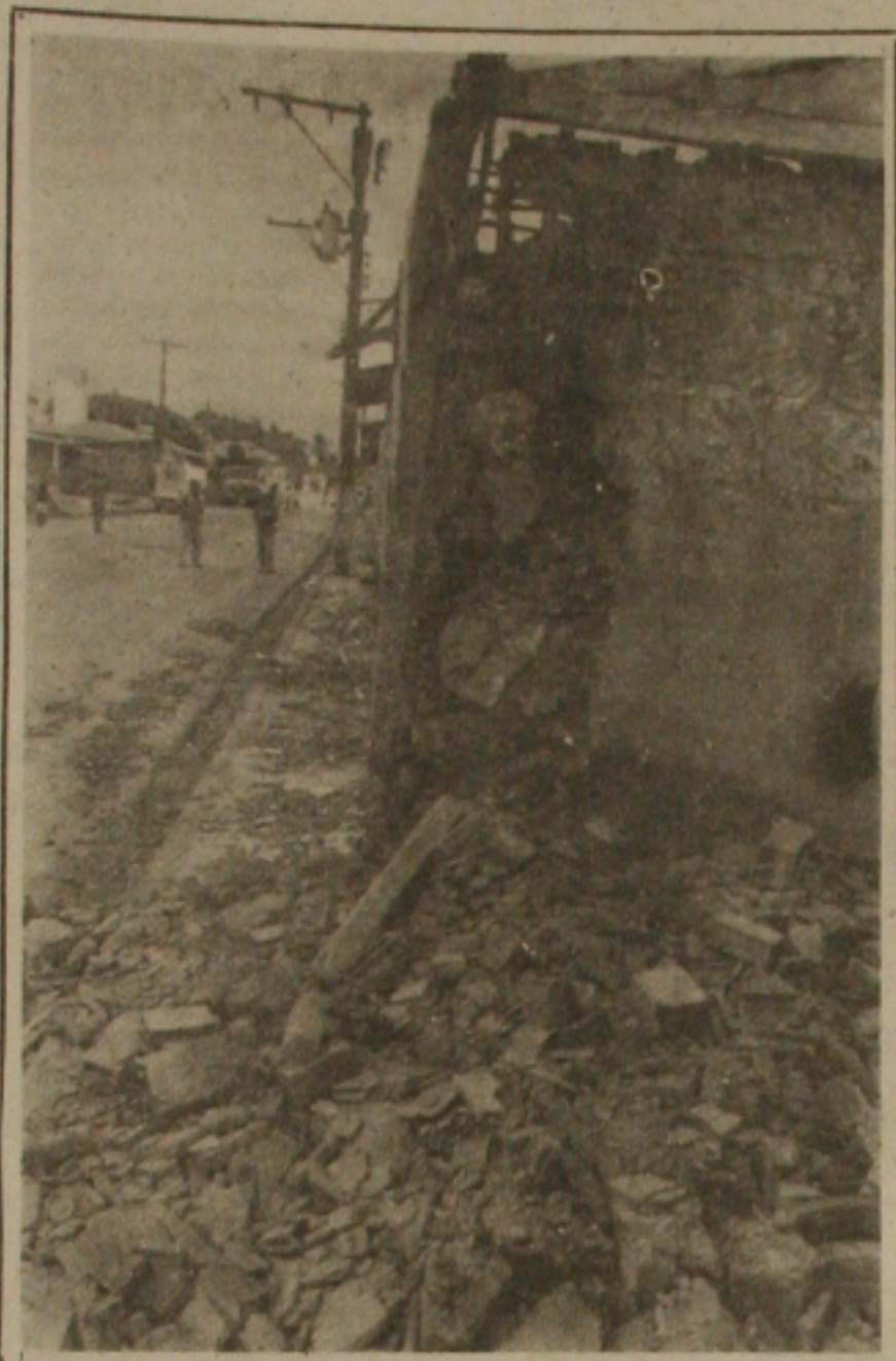
...sobrou, uma ponte ficou parcialmente destruída...