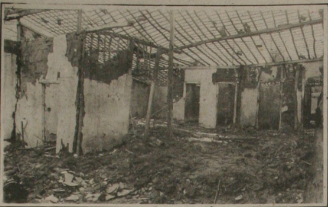
Em São Cristóvão na avenida Félix Pereira as casas desabaram.