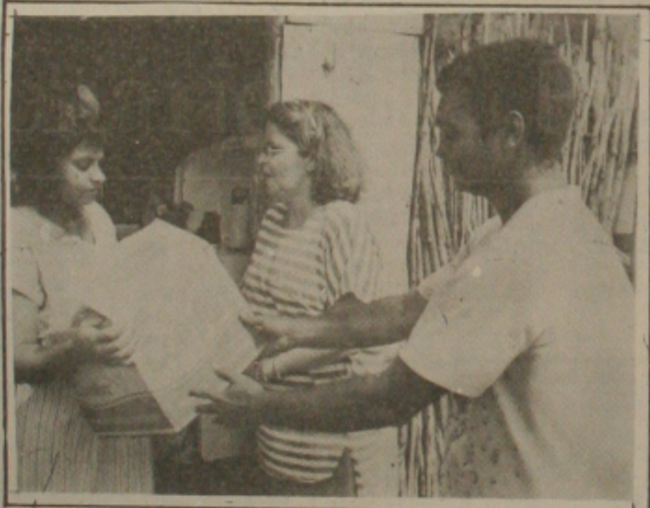
Flagelados da invasão Tamandaré recebem alimentos e roupas.

A autorização para que o mutuário possa residir será imediato logo ele cumpra as formalidades legais exigidas pela Companhia Habitacional de Sergipe. O presidente da Cohab acredita que dentro de dois meses todas as casas serão entregues, aguardando a construção das outras etapas, quando mais famílias de baixa renda serão beneficiadas pelo Governo do Estado, cujo programa habitacional vem sendo direcionado a esta camada carente.