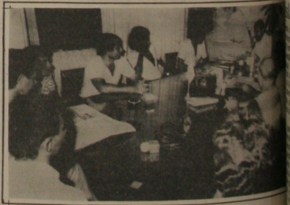
Dirigentes da Empesca não compareceram a reunião da DRT.

Os dirigentes da Empesca ficaram indignados com a ocorrência e obrigou o pescador assinar um documento se comprometer a pagar na época Cz$ 27 mil (vinte e sete mil cruzados novos). Como o seu salário inferior a esta quantia, a empresa não descontar mensalmente até que a dívida foi liquidada. O pescador ameaçado de demissão na época negasse a assinar o documento.