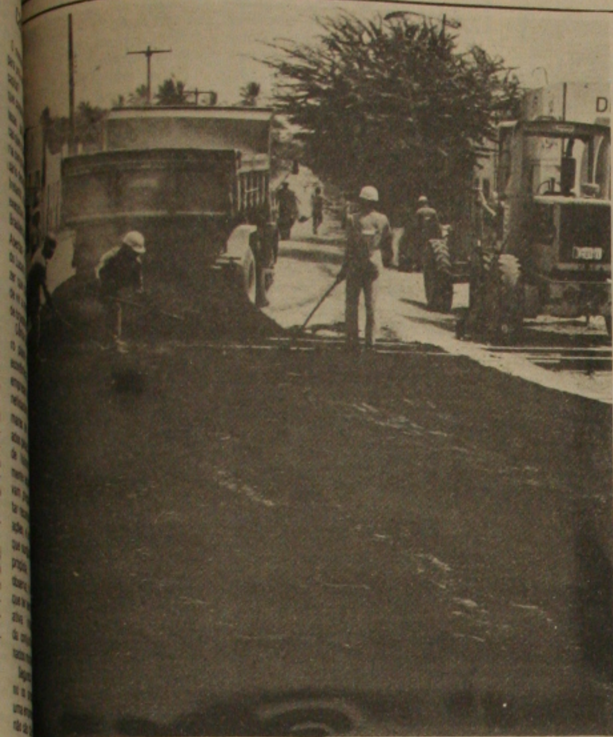
Hoje ontem a recuperação de diversas avenidas parcialmente destruídas pela chuva. A Augusto Franco é uma das que recuperadas. (Página 2).