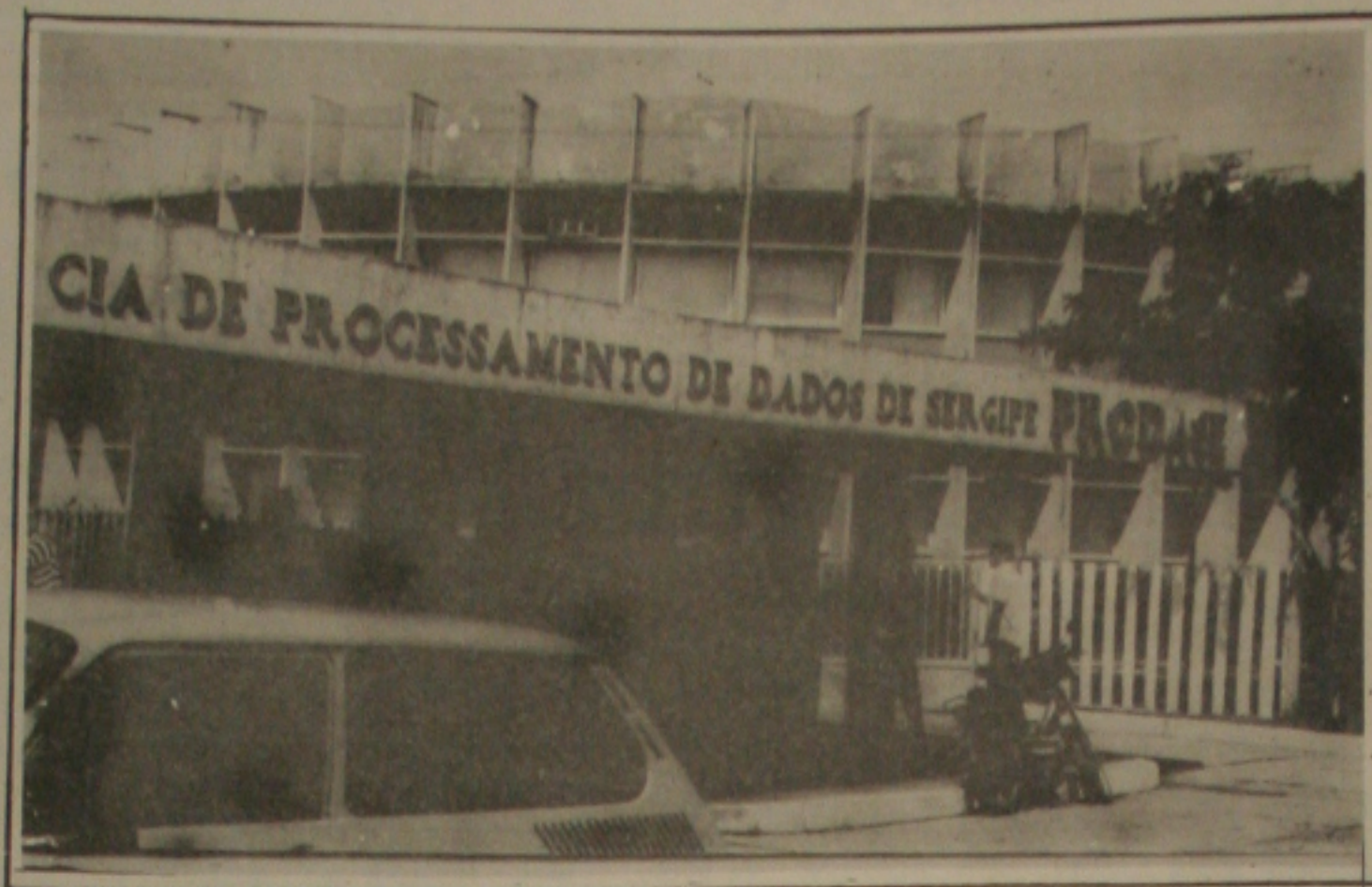
Funcionários da Prodase permanecem fazendo greve branca.