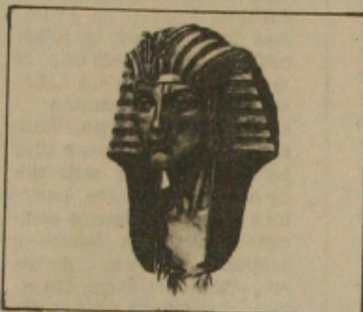
O Faraó Akhnaton (Amenhotep IV), Grande Mestre Tradicional da Antiga Fraternidade Egípcia de 1350 a.C.

Seus membros são indivíduos interessados no auto-aprimoramento: destacados homens de negócios, diretores de indústrias, médicos, operários, advogados, funcionários em geral, cientistas, artistas, editores, educadores, e escritores, que consideram os ensinamentos Rosacruzes estimulantes e praticáveis.