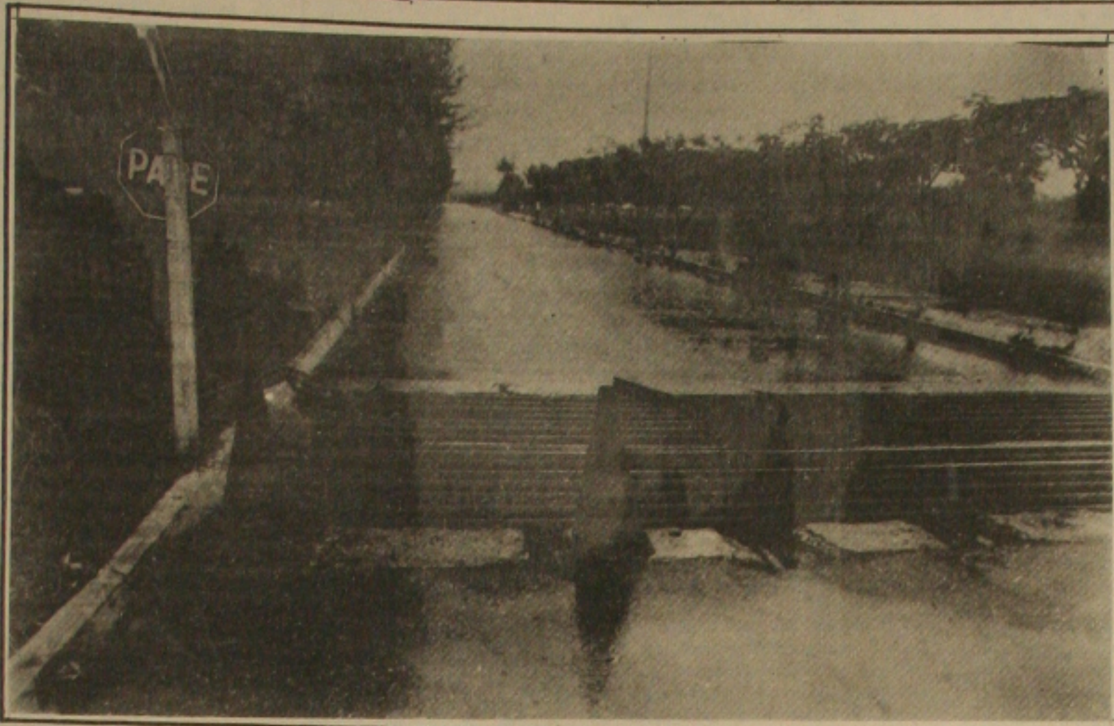
A precariedade na manutenção das instalações do Campus Universitário, compromete até o acesso à Universidade, que devido a crise financeira está em greve. (Página 02).