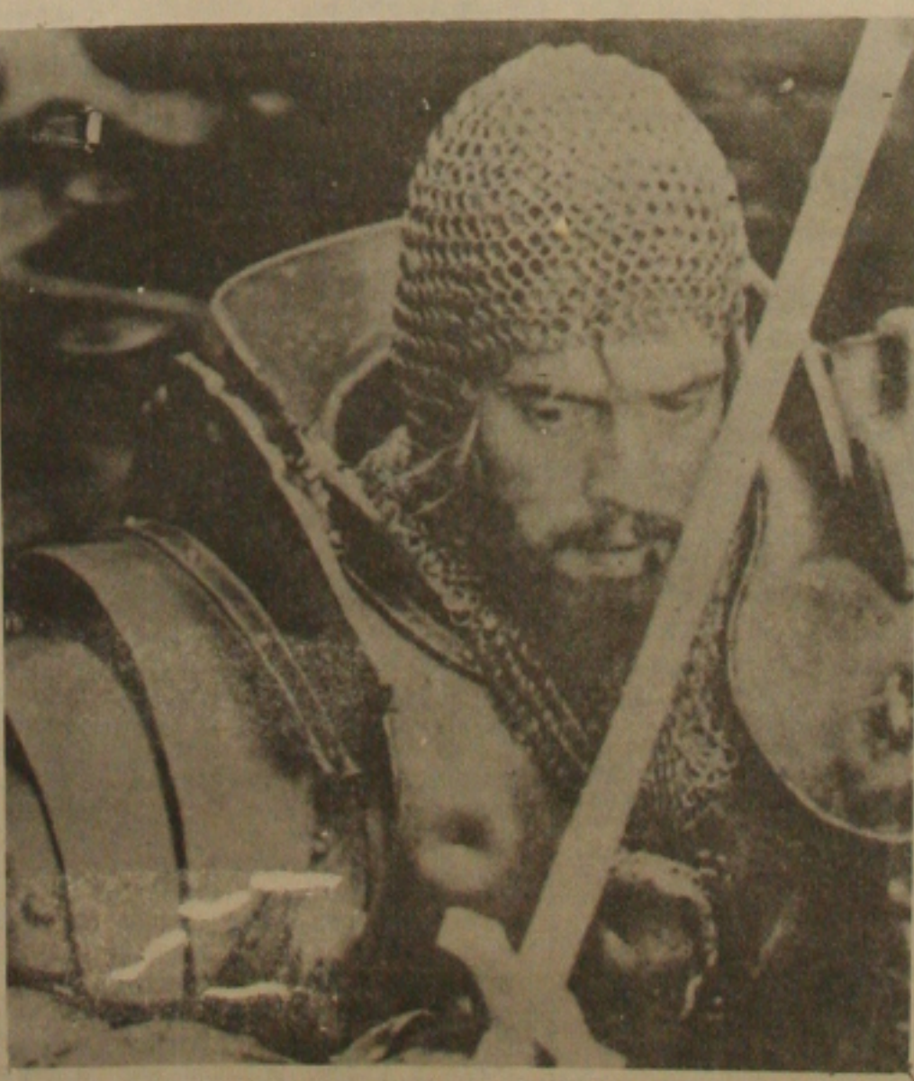
Excalibur, A Espada do Poder

CORRENTES OCULTAS (Undercurrent) Globo, Oh. EUA, 1946, 116 m. Direção: Vicente Minnelli. Com Katharine