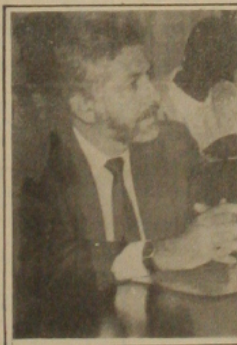
Araújo não deixou passar em branco a ajuda fundamental da indústria.