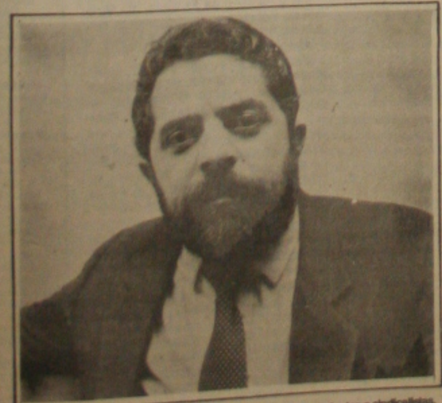
Lula vem lançar candidatura em Sergipe e discutí-la com estudantes e sindicalistas.

Presidência da República, Lula, concede entrevista coletiva à imprensa, logo após desembarcar no aeroporto de Aracaju, no próximo dia oito, às oito horas. Depois, Lula participa de um debate na Universidade Federal de Sergipe, a partir das dez horas. Às 14 horas ele visita a Câmara Municipal e, em seguida, a Assembleia Legislativa. Às 16 horas o presidenciável se reúne com sindicalistas e às 17 horas faz distribuição de folhetos, explicando sua candidatura em frente à sede da Petrobrás. O ato de lançamento da Frente Brasil Popular em Aracaju será à noite, a partir das 20 horas, em local a ser definido pelo comitê de apoio à candidatura de Lula. O candidato a presidente passa à noite em Aracaju, seguindo para Salvador na manhã do dia nove