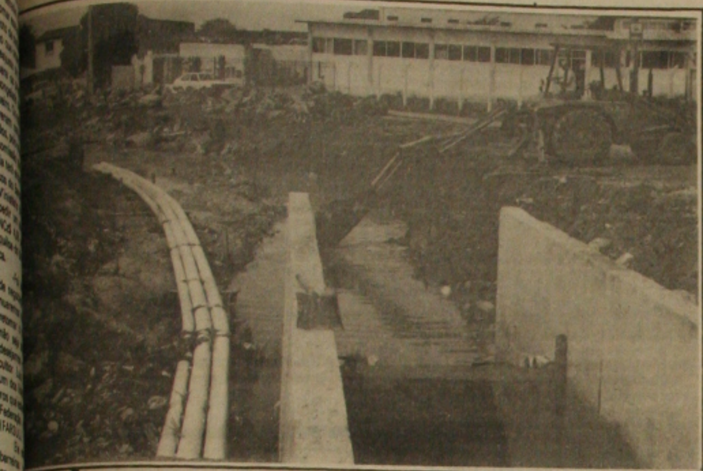
Recuperação do canal da Av. Visconde de Maracaju.

Preso em Aracaju pela Polícia Federal, uma quadrilha de falsificadores - três homens e uma mulher -, acusada de provocar rombo de milhares de cruzados ao Instituto Nacional da Previdência Social, possivelmente com o envolvimento de servidores do órgão. A quadrilha falsificava Comunicados de Acidentes de Trabalho, com as quais habilitavam trabalhadores fantasmas, para o recebimento dos benefícios pagos pela Previdência aos assegurados, em caso de acidente de trabalho.