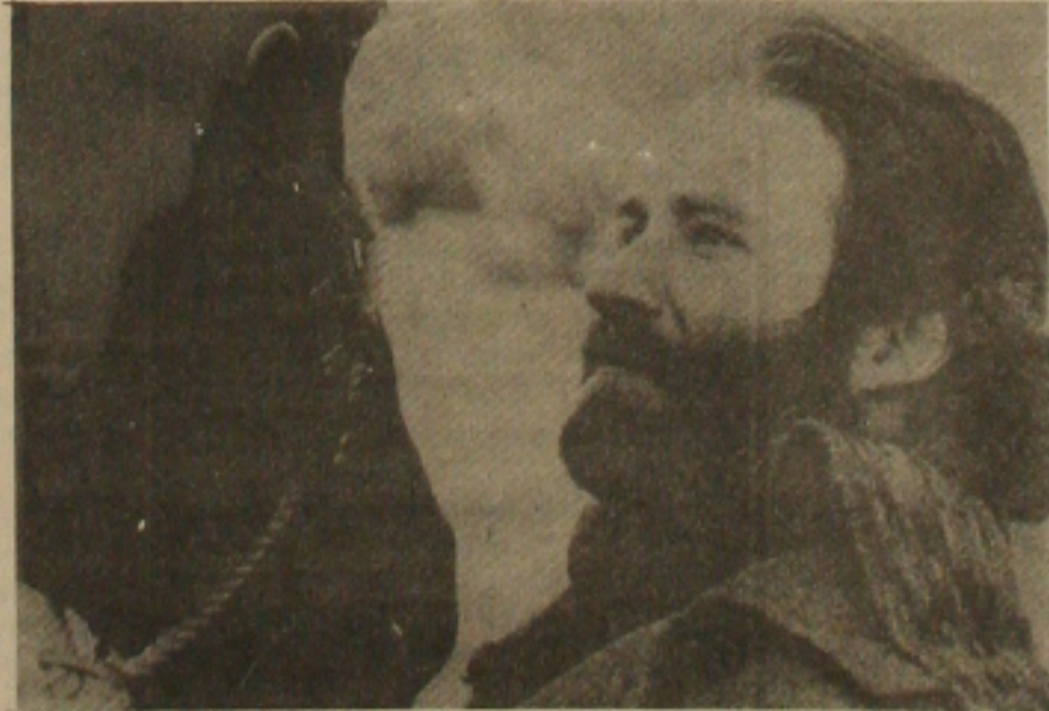
Kevin Kline em "Silverado", tentativa do diretor Lawrence Kasdan de recuperar o "western", no sábado, pela Globo