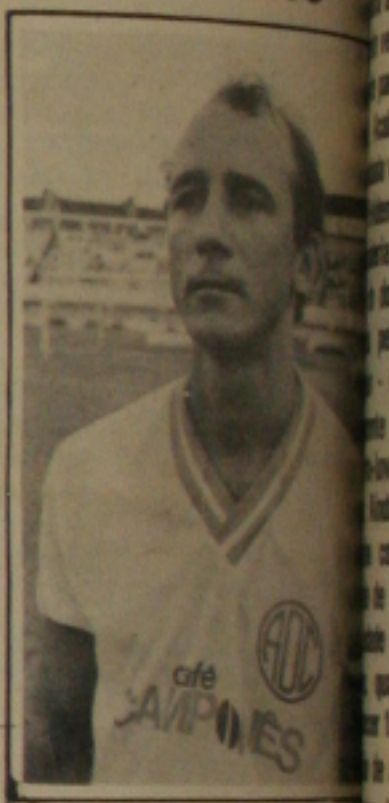
Confirmada a estréia de Ronaldo contra o Vasco.