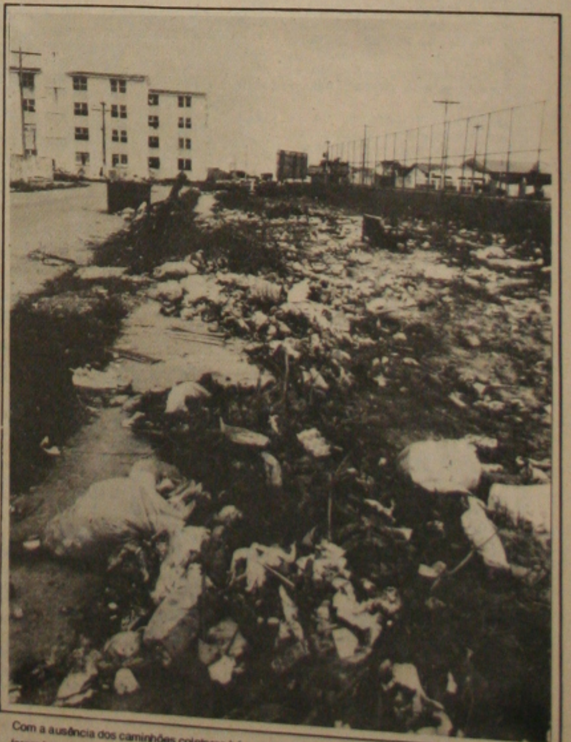
Com a ausência dos caminhões coletores há mais de 15 dias, as ruas do Conjunto Augusto Franco foram transformadas em lixeiras a céu aberto.

Os moradores do Conjunto Habitacional Augusto Franco, estão se queixando da falta de coleta de lixo, que segundo eles está prejudicando a todos e em especial as crianças. Para se ter uma idéia do problema, a Secretaria de Serviços Urbanos deixou fazer a coleta de lixo regular por um período de 15 dias. Os montes de lixo são vistos por todo o Conjunto, chegando até a ser colocado lixo sobre as calçadas e nas praças públicas, gerando focos de mosquitos e enfeando a paisagem daquele núcleo habitacional. (Página 02).