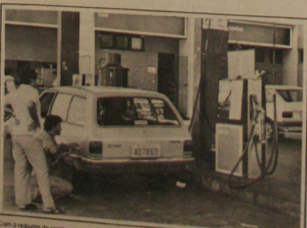
Com o reajuste de combustíveis anunciado previamente, os postos tiveram grande movimento ontem.