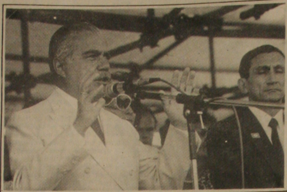
Ao lado do ministro das Minas e Energia, o presidente Sarney anunciou a liberação dos recursos para Xingó