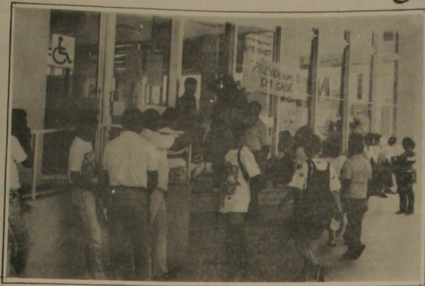
Previdenciários denunciam os contrários ao movimento grevista.

11:15hs - Debates 12:00hs - Almoço 14:00hs - Tempo Livre - Recreação 14:30hs - Apresentação de Experiências de Trabalhos Grupos 15:00hs - Intervalo (10 minutos) 16:00hs - Apresentação da Conclusão dos Trabalhos em Grupos