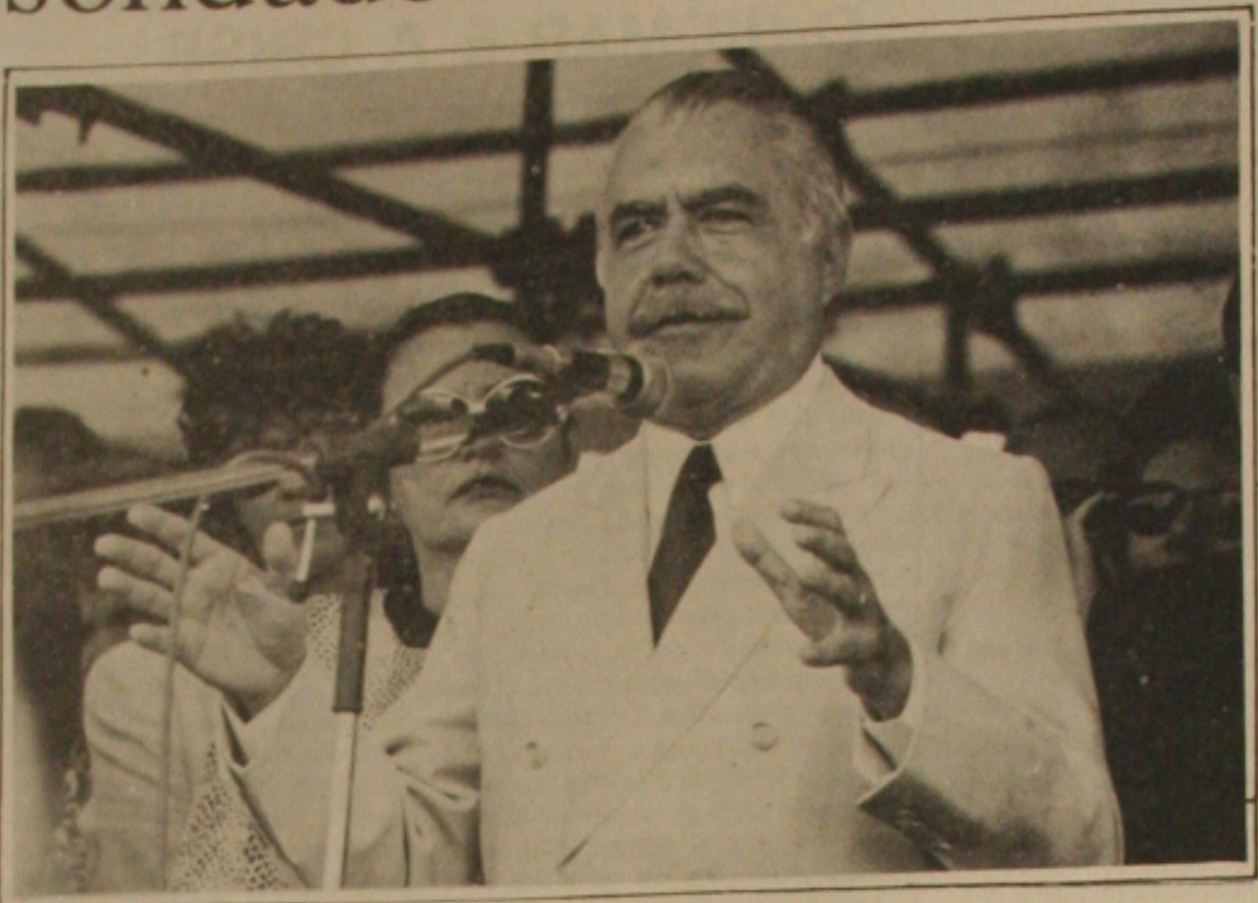
O presidente garantiu que Sergipe, agora, inicia sua caminhada para o pleno desenvolvimento

Depois de completar o seu desmentido, Sarney fez uma revelação incompleta. Disse que já escolheu o seu candidato a sucessão presidencial, mas acrescentou que não revelará o seu nome. Prometeu, ainda, que manteria a posição de acompanhar o processo sucessório como todos os brasileiros e voltou a garantir que se manteria distante dele.