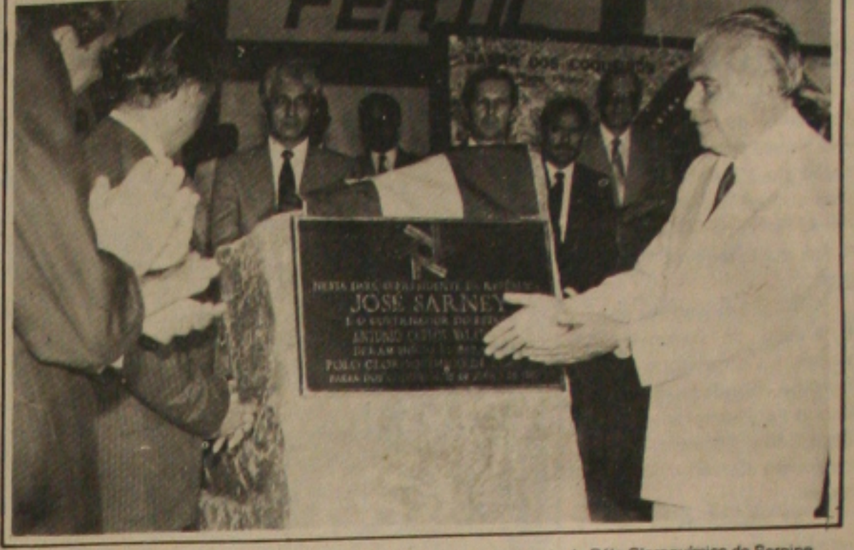
No canteiro de obras do Porto, ele descerrou a placa marcando o lançamento do Pólo Cloroquímico de Sergipe.