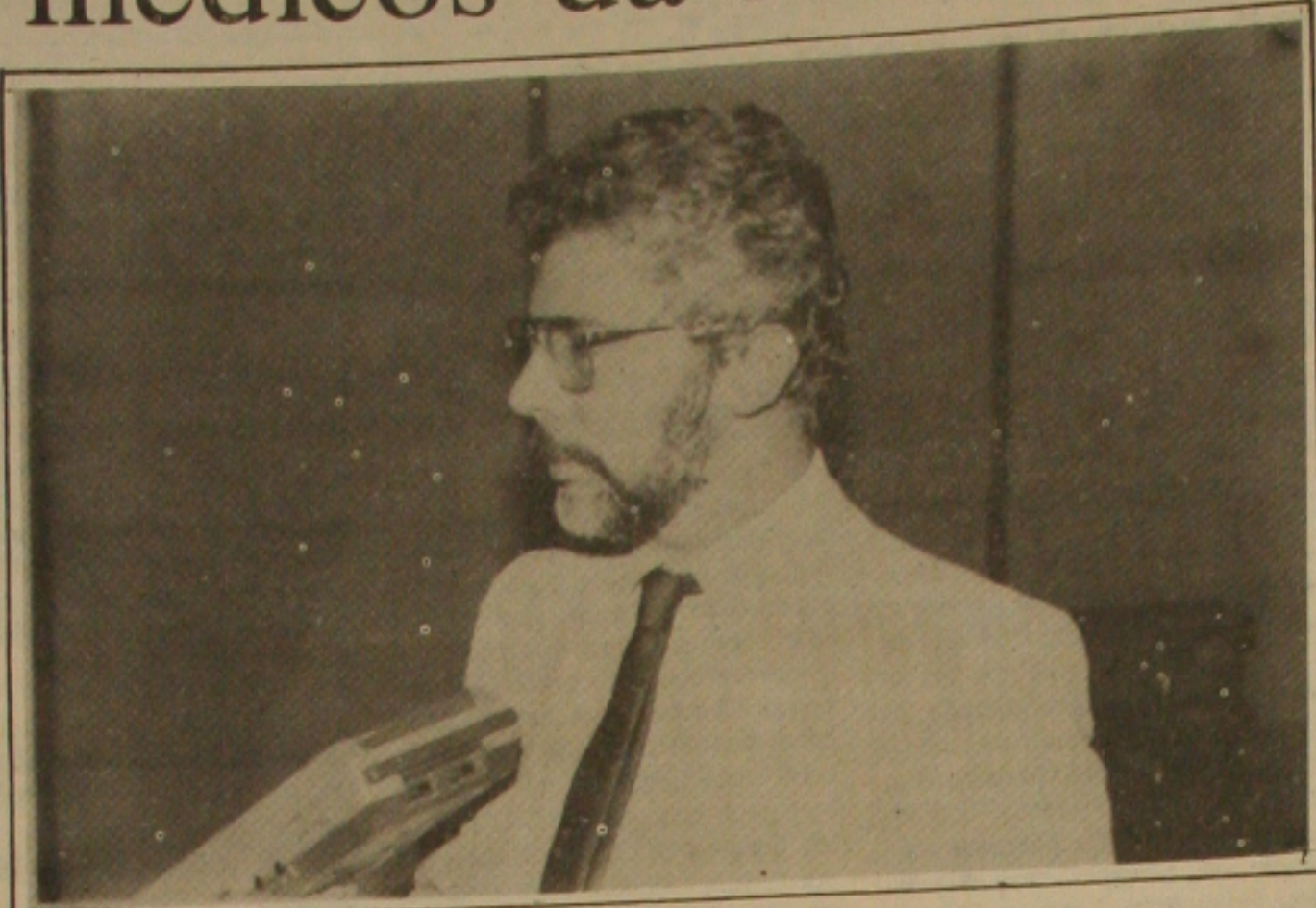
O petista tem provas que houve pressão e pede que seus colegas renunciem, para dignificar e resgatar a honra dos médicos sergipanos