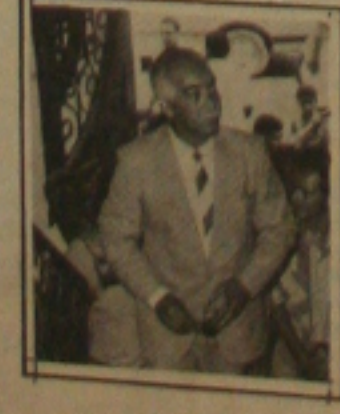
(Página 01 - 2º Caderno)

O período letivo de 89 na Universidade foi suspenso e as aulas só serão retomadas no próximo mês de agosto. Com isto os aprovados no vestibular de 89, para o 2º semestre, só irão estudar no próximo ano, enquanto que o vestibular-90 só ofertará 50 por cento das vagas.