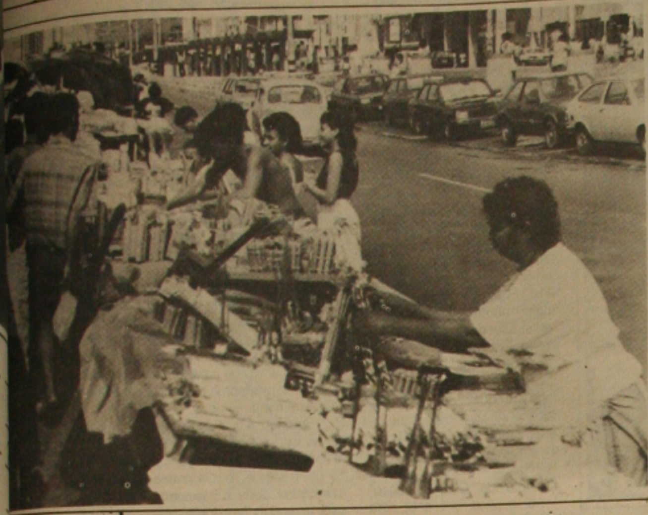
Os fogos de artifícios estão sendo vendidos irregularmente em todos os pontos da cidade.