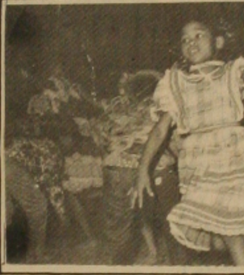
Flash da apresentação da quadriilha mirim Forró Bodô, se apresentando no Centro de Criatividade. Olhe só a animação da garota provando que o São João é coisa nossa.