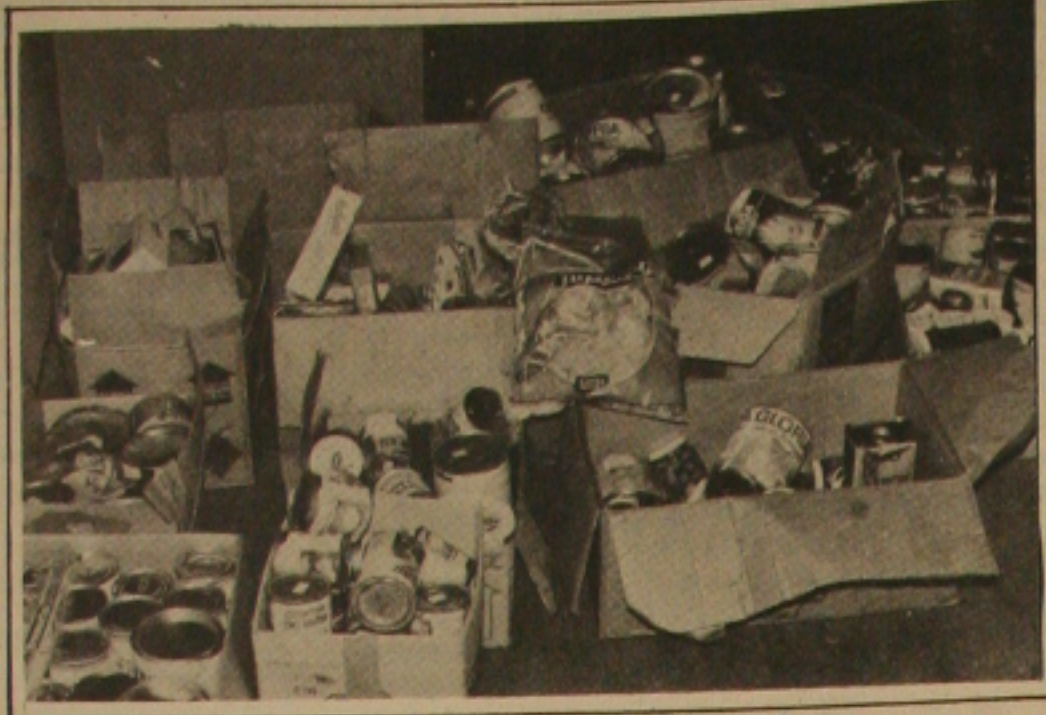
Alimentos estragados retirados das prateleiras dos supermercados pelos fiscais da Prefeitura.