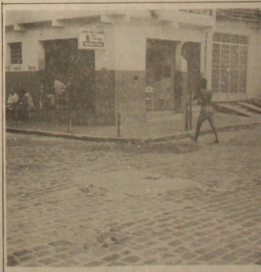
O esgoto transborda e causa péssimo odor em toda a área próxima ao Cirurgia.