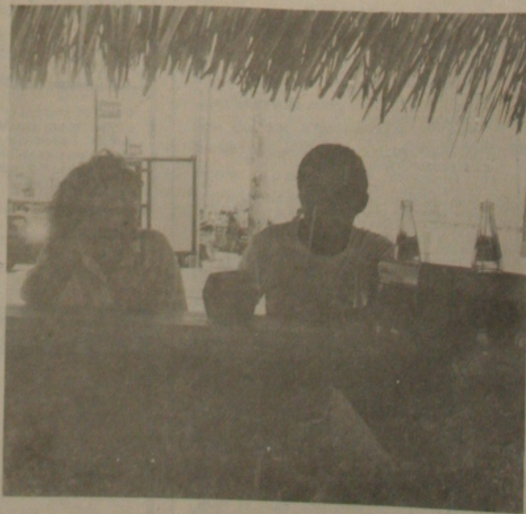
4 - Os Queques das nossas praias é uma das boas pedidas para bater um papo tranqüilo acompanhado de um coço gelado ou até mesmo a tradicional cerveja.