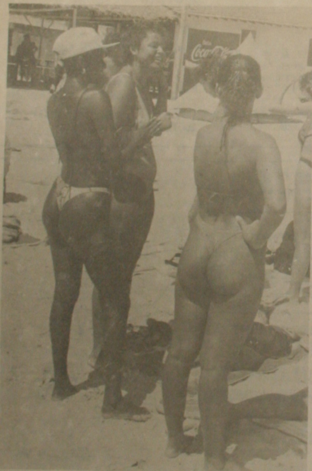
3 - O colírio serve para limpar as vistas. E se você não for cego, tal um colírio pra ninguém zar delo. (Foto: Fernando Silva).