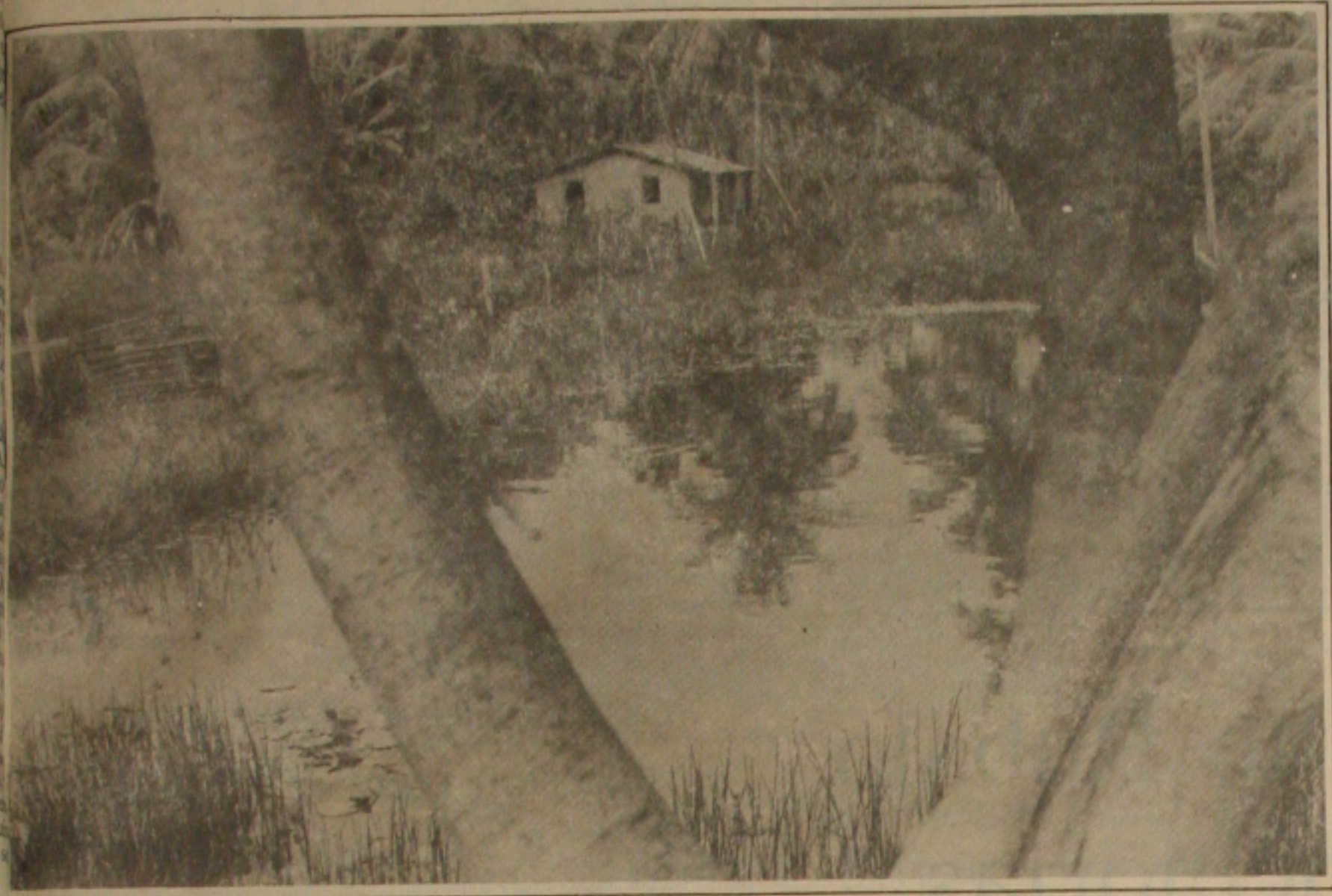
A praia do Robalo está totalmente abandonada pela Prefeitura, lá o que não falta é lama e lixo.