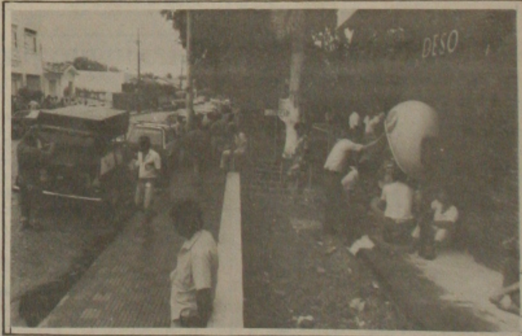
Servidores do Deso realizam assembléia geral para uma avaliação.

Ontem pela manhã os servidores ficaram concentrados na porta da empresa auxiliados por um carro de som. A categoria esclareceu através do serviço de som os motivos da greve à população e garantiu que o abastecimento de água não será comprometido em caso de uma paralisação mais ampla.