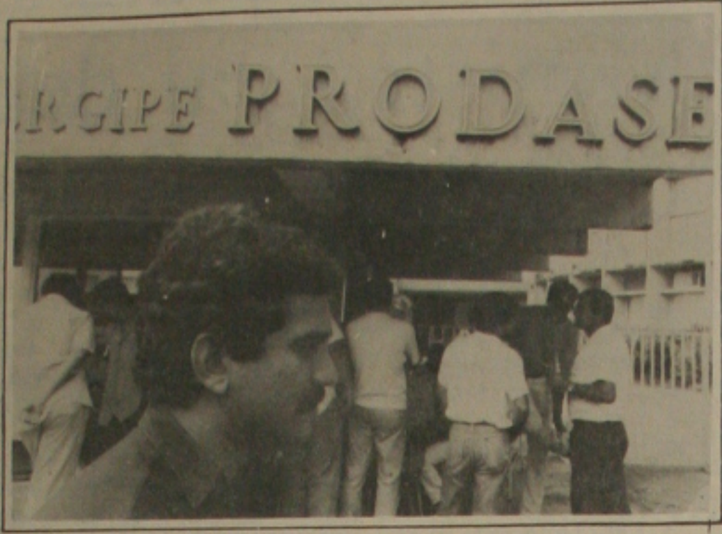
Funcionários da Prodase entram no segundo dia de greve.