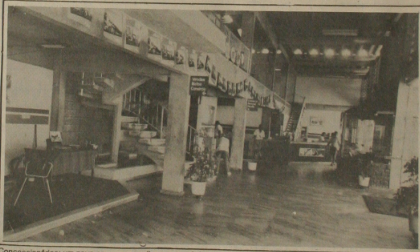
Concessionárias: um novo carro para melhorar a mecânica.

Um comunicado interno distribuído aos empregados destaca que "uma fábrica mais eficiente, com melhor equipamento e produzindo veículos confiáveis e de alta qualidade garante maiores e melhores oportunidades de sucesso para a Autolatina seus colaboradores e o próprio País".