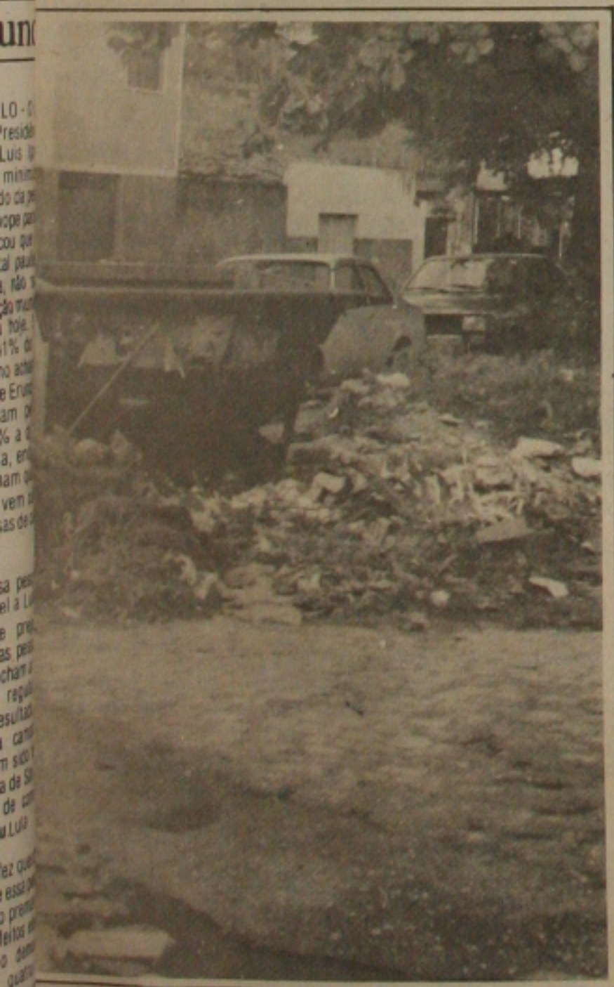
acumulado nos terrenos baldios, atesta que nem a Operação Limpeza conseguiu Aracaju

A General Motors do Brasil acaba de enviar ao Instituto de Criminalística da Secretaria de Segurança Pública, a relação de 10 veículos por ela produzidos, para que as denúncias feitas sobre o uso desses veículos por delegados fossem apuradas. Os carros conforme informação daquela indústria automobilística foram comercializados por concessionárias da Região Nordeste do País. Entre os carros apreendidos pela Polícia constam um Monze, um Opala e um Chevette, no entanto, os nomes dos proprietários dos referidos veículos estão sendo mantidos em sigilo, pelo perito Manoel Souza Pereira, diretor do Instituto de Criminalística, o qual acompanhou a realização da perícia feita por técnicos do CNVR, Cadastro Nacional de Veículos Roubados. (Página 07).