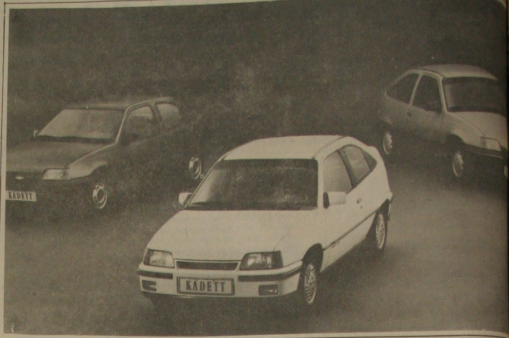
O KADETT com o sistema de escapamento da Kachan...

As características do ETX II Aerostar incluem velocidade superior a 100 km/h; aceleração de 0 a 80 km/h em menos de 20 segundos, raio de ação de 160 quilômetros, além da capacidade de subir rampas com mais de 30%.