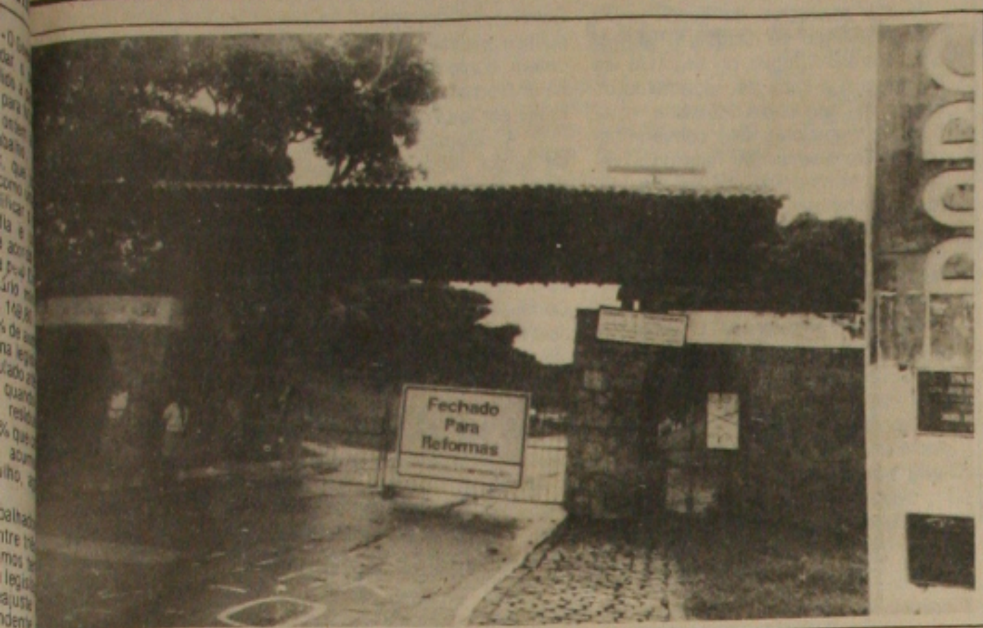
Principal do Parque da Cidade, a placa informa o que se repete regularmente desde a inauguração