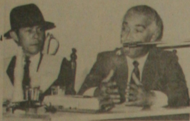
O TRABALHO E O LAZER MAÇÔNICO