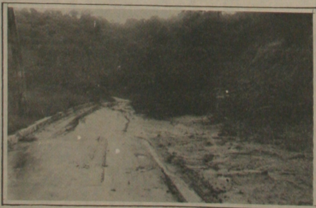
Chuvas danificam estradas do Parque José Rollemberg Leite.

No interior do Parque muitas ruas de acesso estão interditadas. Com as chuvas as encostas desabaram e há ao longo das ruas um amontoado de galhos de árvores e terra que impedem o trânsito normal. O lamaçal está tomando conta de grande parte da área sem que providências sejam tomadas. A direção do Departamento Estadual de Estradas e Rodagem, (DER), solicitou compreensão da administração do Parque e informou que somente poderia tomar uma iniciativa para tirar os entulhos do meio das ruas de acesso quando as chuvas cessarem enquanto isto a situação se agrava a cada dia.