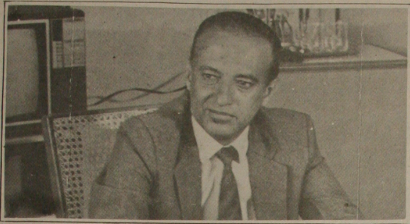
Valadares: não vai criar novos marajás