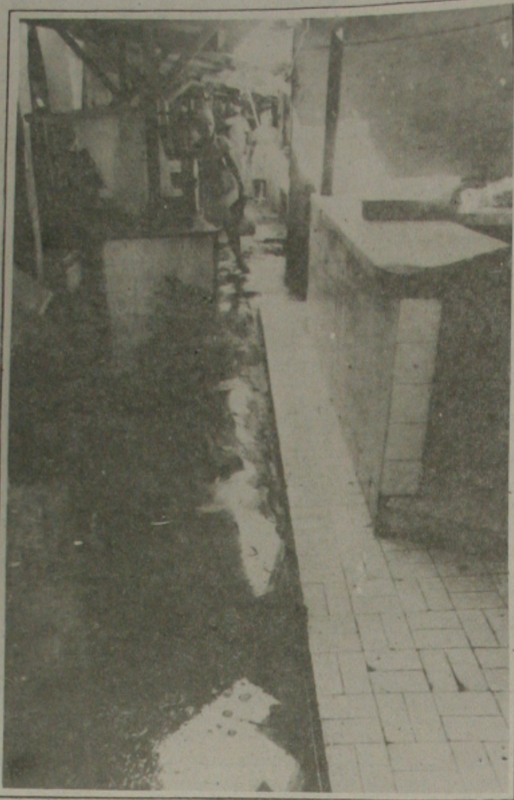
Consumidores criticam situação do Mercado Thales Ferraz.