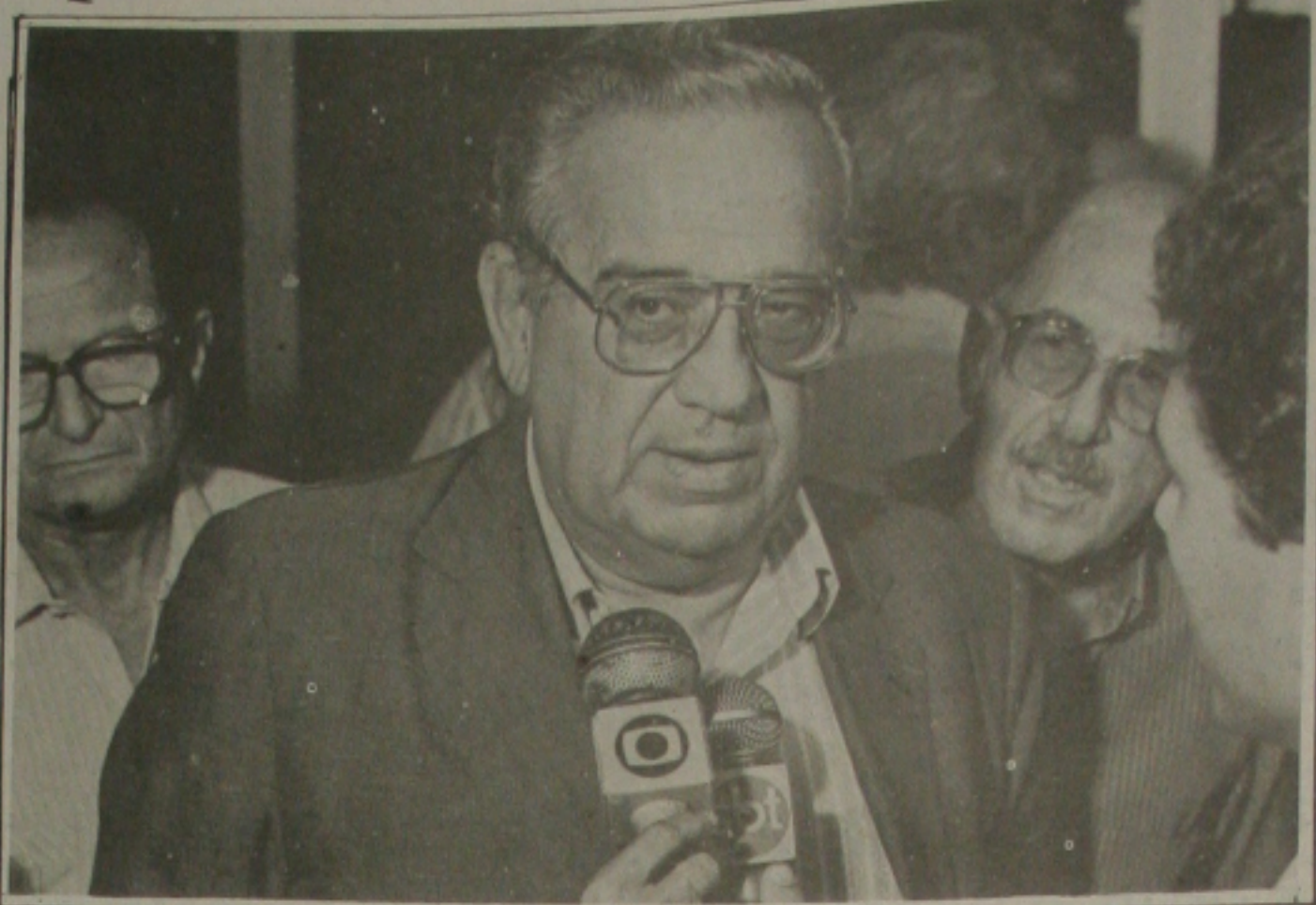
Calazans: uma incompreensível guinada para a direita.

A avaliação otimista do comportamento das contas públicas incluída no documento da Seplan considera também a relação receita-despesa do primeiro semestre, que é mais desfavorável ao governo, quando comparada ao mesmo período de 88. A receita bruta, excluindo o repasse de NCz$ 4 bilhões do Banco Central para o tesouro, teve uma queda real de 6,3% no primeiro semestre em relação ao ano anterior, enquanto as despesas cresceram por conta do aumento das transferências constitucionais aos Estados e Municípios. A queda da receita foi agravada pelo fim dos impostos únicos e pela inflação - já que neste ano os impostos foram indexados somente a partir de abril. Além disso, houve uma redução da arrecadação do imposto de renda.