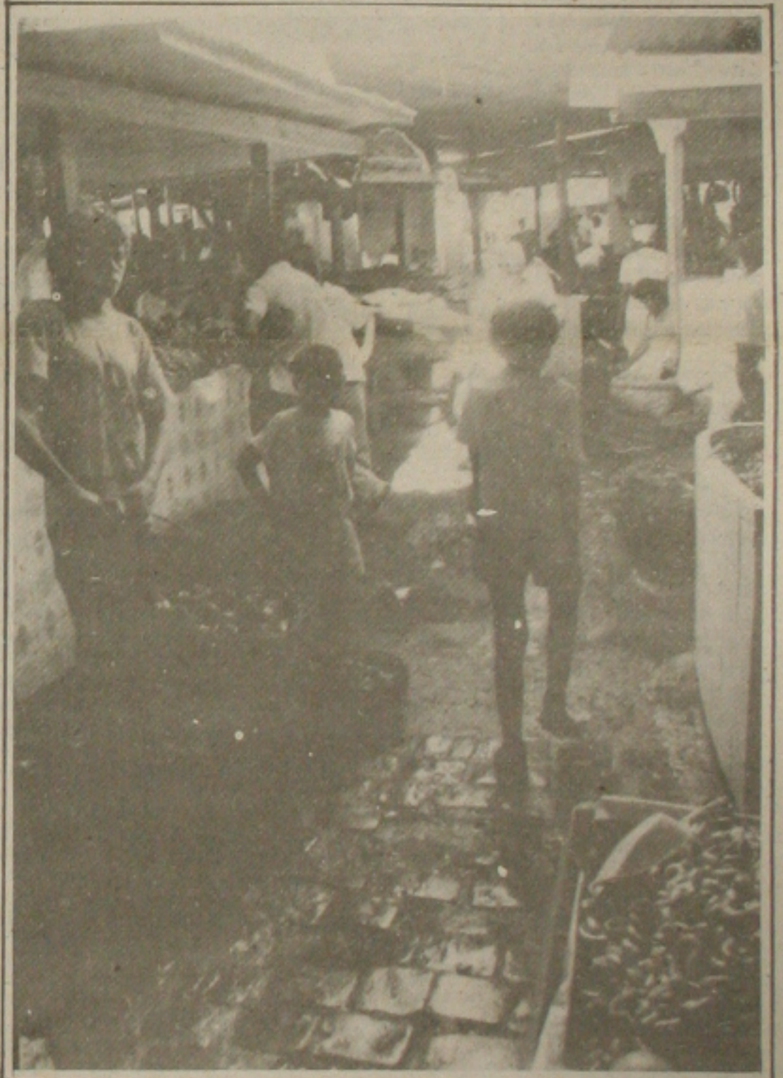
Mercado Thales Ferraz continua sendo problema com sua sujeira.

Hoje, reforça todo Governo, o Banco Central abandonou a idéia de divulgar um comunicado com a lista das prioridades na liberação dos pagamentos ao exterior retidos em decorrência da centralização do câmbio.