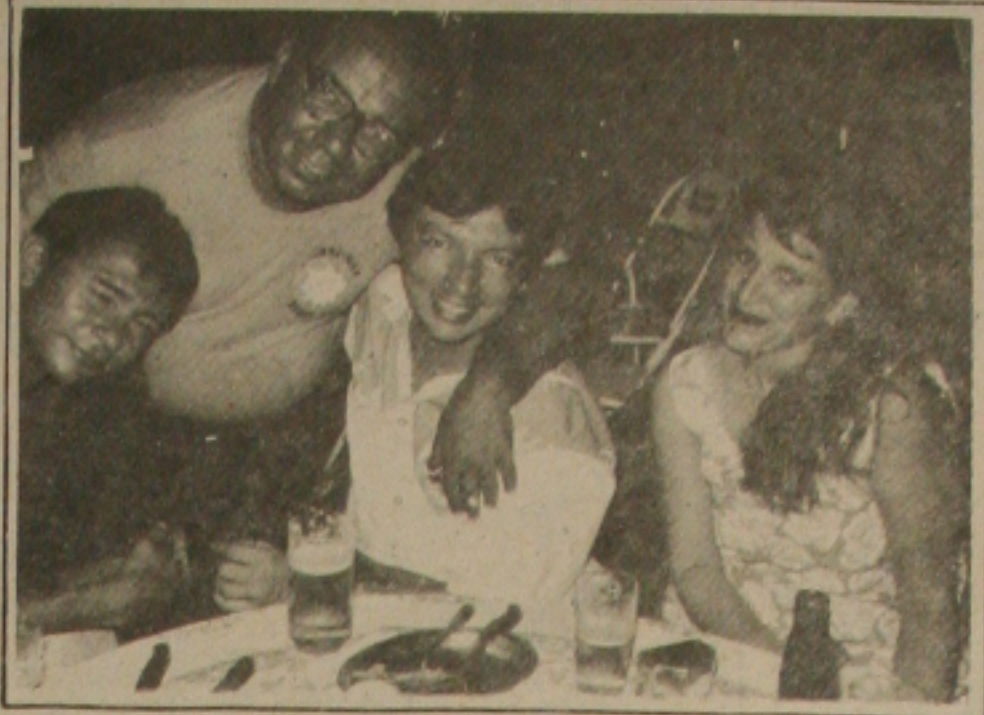
DINHEIRO & CRENÇAS

Com o correr dos tempos e pela importância que exercia, como intermediária na satisfação das necessidades do homem, a moeda estendeu sua influência além do âmbito utilitário. A atração pela moeda levou os homens à verdadeira adoração, criando-se crenças e mitos que atravessaram os séculos. Os gregos acreditavam que era necessário aos mortos levarem um óbolo ou uma dracma na boca, para pagar a Caronte a travessia de suas almas para a eternidade. Já, no Brasil, era uso popular pôr, no primeiro banho do recém-nascido, uma moeda de ouro, que se julgava garantir à criança uma vida de abundância. (Fonte: Dinheiro no Brasil - F. dos Santos Trigueiro.)