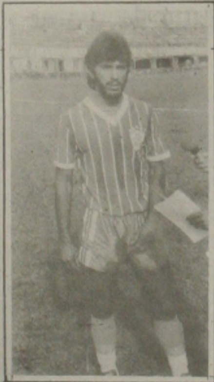
Zominho confia na vitória do itabaiana hoje em Lagarto. Se houver jogo.

como já está definido e o itabaiana na quinta-feira, uma determinação também da Federação.