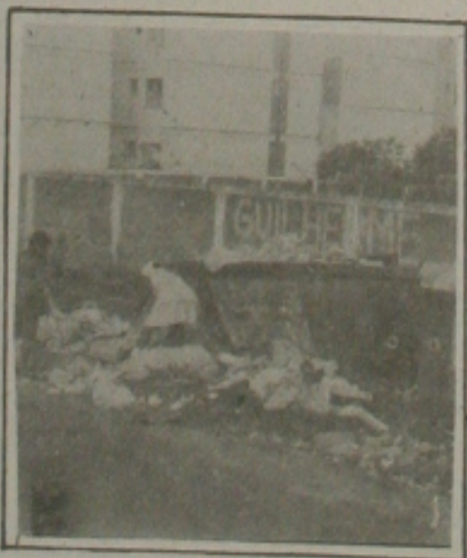
Acúmulo de lixo causa sérios problemas.