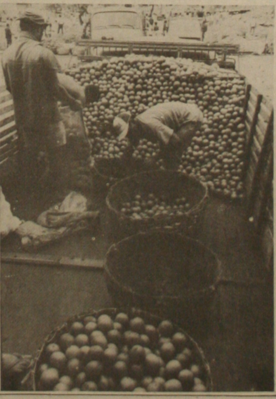
Indústrias querem pagar pouco pela laranja, que termina sendo vendida nos mercados de Aracaju.

Os últimos reajustes para a energia elétrica foram de 21% em junho e de 10% no dia 5 de julho (em caráter emergencial), que acarretou três aumentos, com intervalos de 15 dias entre um e outro nas contas de luz dos consumidores.