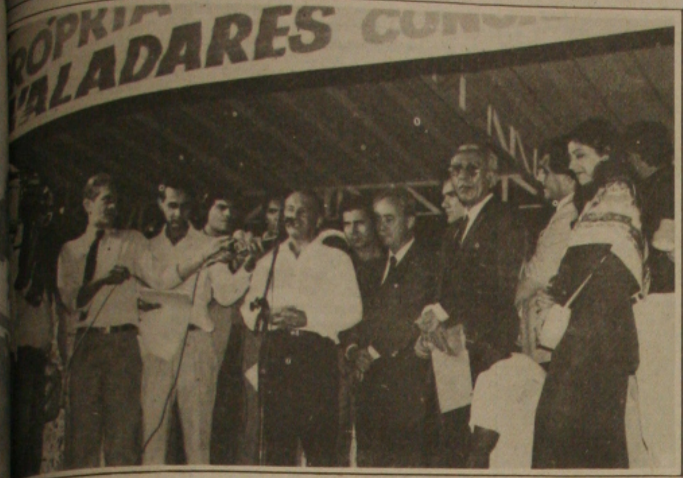
...temos promessa de campanha eleitoral na inauguração do Conjunto Marcos Freire.