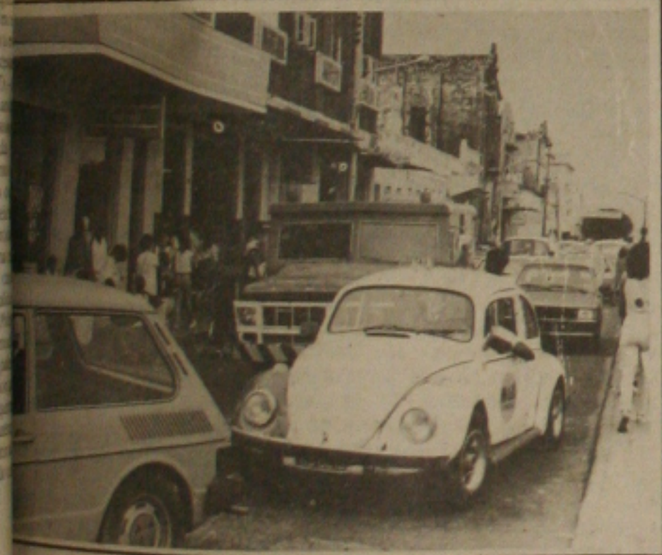
Estacionamento no centro será desligado com a Zona Azul.