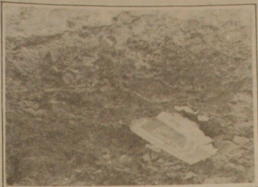
Pedaco de um dos ônibus da São Geraldo: a violência do impacto praticamente destruiu os veículos.