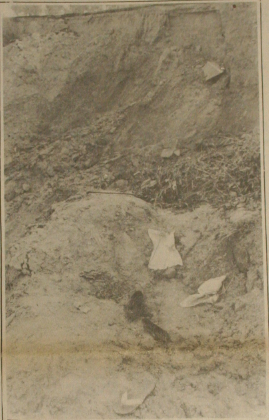
No interior da cratera aberta pelo deslizamento da pista, restaram apenas roupas e sapatos das vítimas.

Brasília - Quem passou ontem numa agência dos Correios foi surpreendido com o aumento de 23,08% nas tarifas postais. O reajuste, autorizado pelo Ministério da Fazenda, foi concedido pelo Conselho de Administração dos Correios