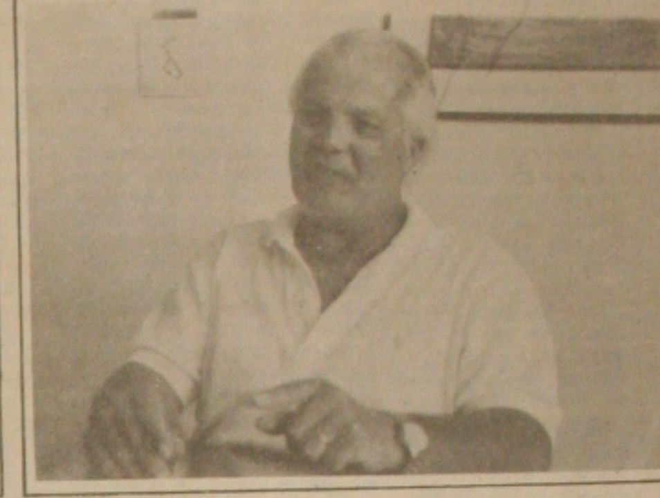
... Mas o gerente da São Geraldo, culpa o Governo pela falta de conservação das rodovias.