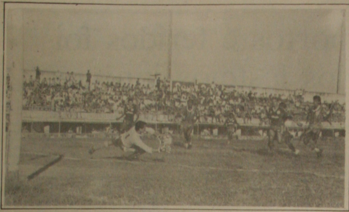
Pio defende parcialmente o chute de Edi...