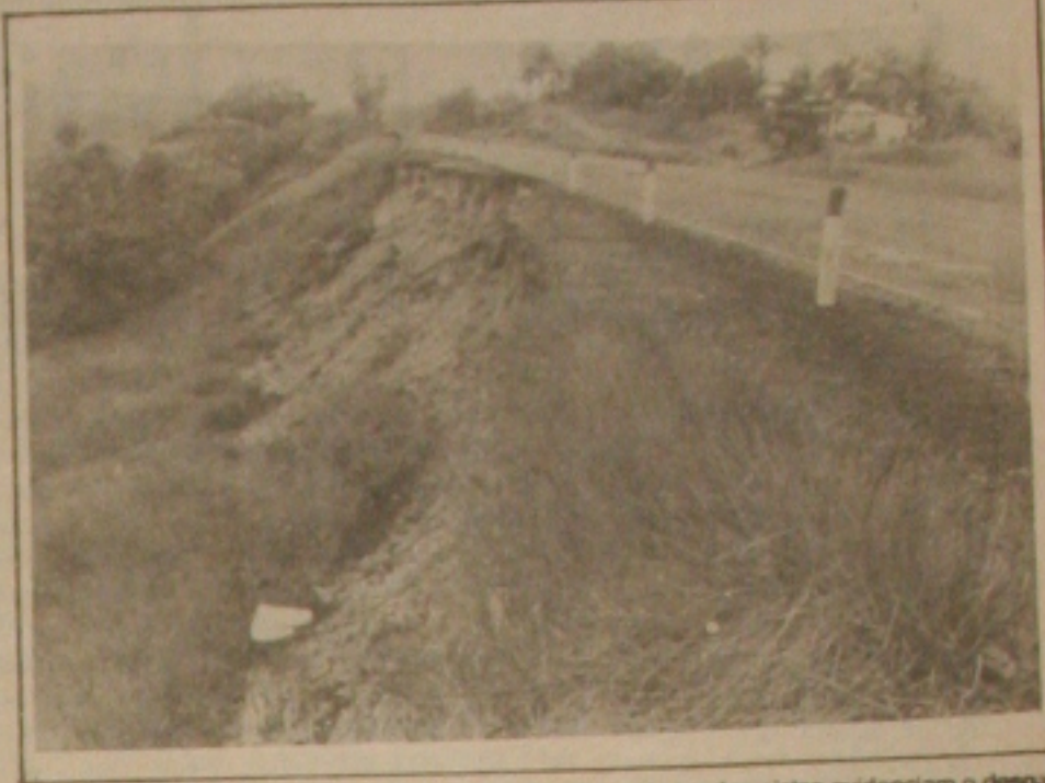
Nas proximidades do local do acidente, a erosão das margens das pistas evidenciam o desgaste provocado pela infiltração da água de chuva.