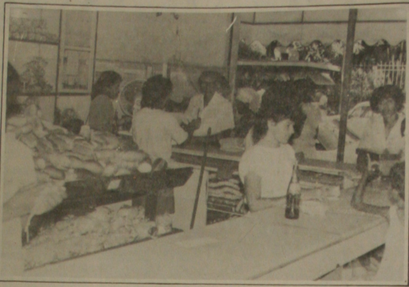
O aumento do pão não alterou o movimento nas padarias.

No entanto, o presidente da EMURB garante que os projetos de construção das empresas privadas serão submetidos à apreciação da EMURB para evitar que aconteçam agressões aos recursos ambientais do local.