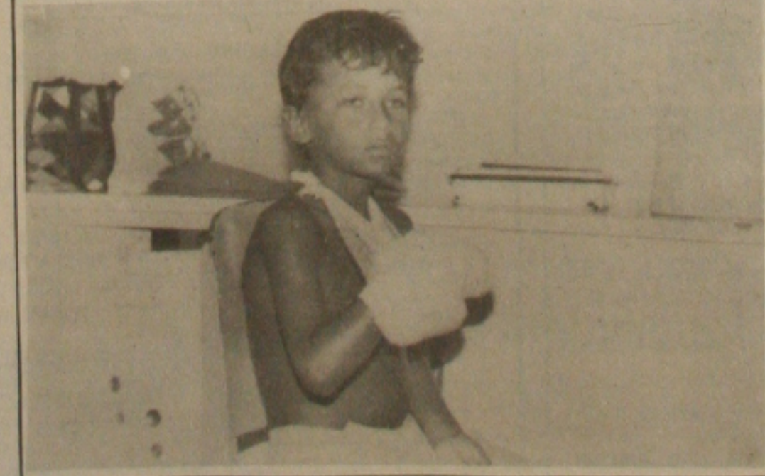
A maioria dos queimados como fogos de artifícios é de crianças na faixa de 8 a 12 anos.