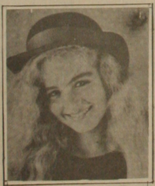
O Clube da Criança, apresentada por Angélica, tem novas atrações.