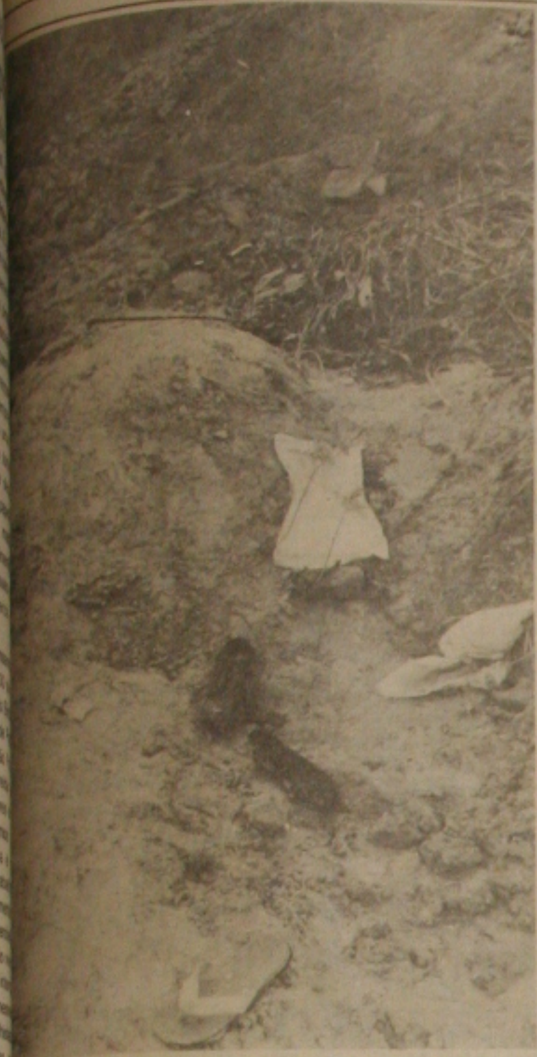
Corpos e pertences das vítimas espalhados no interior do buraco da tragédia.