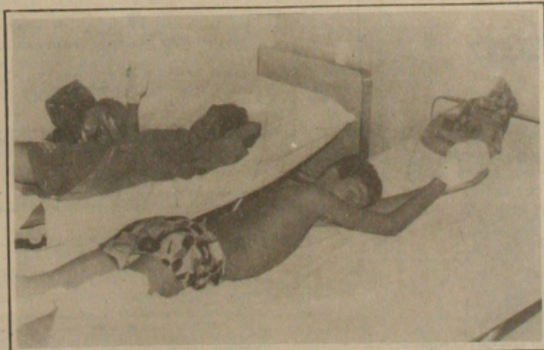
Mãos queimadas, com perda de alguns dedos, principal ferimento das vítimas dos fogos.