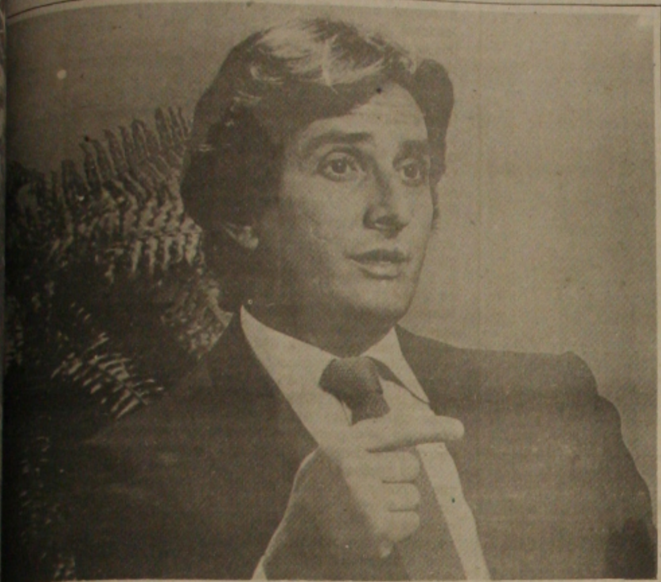
Fernando Collor, agredido em Niteroi pelos brizolistas.