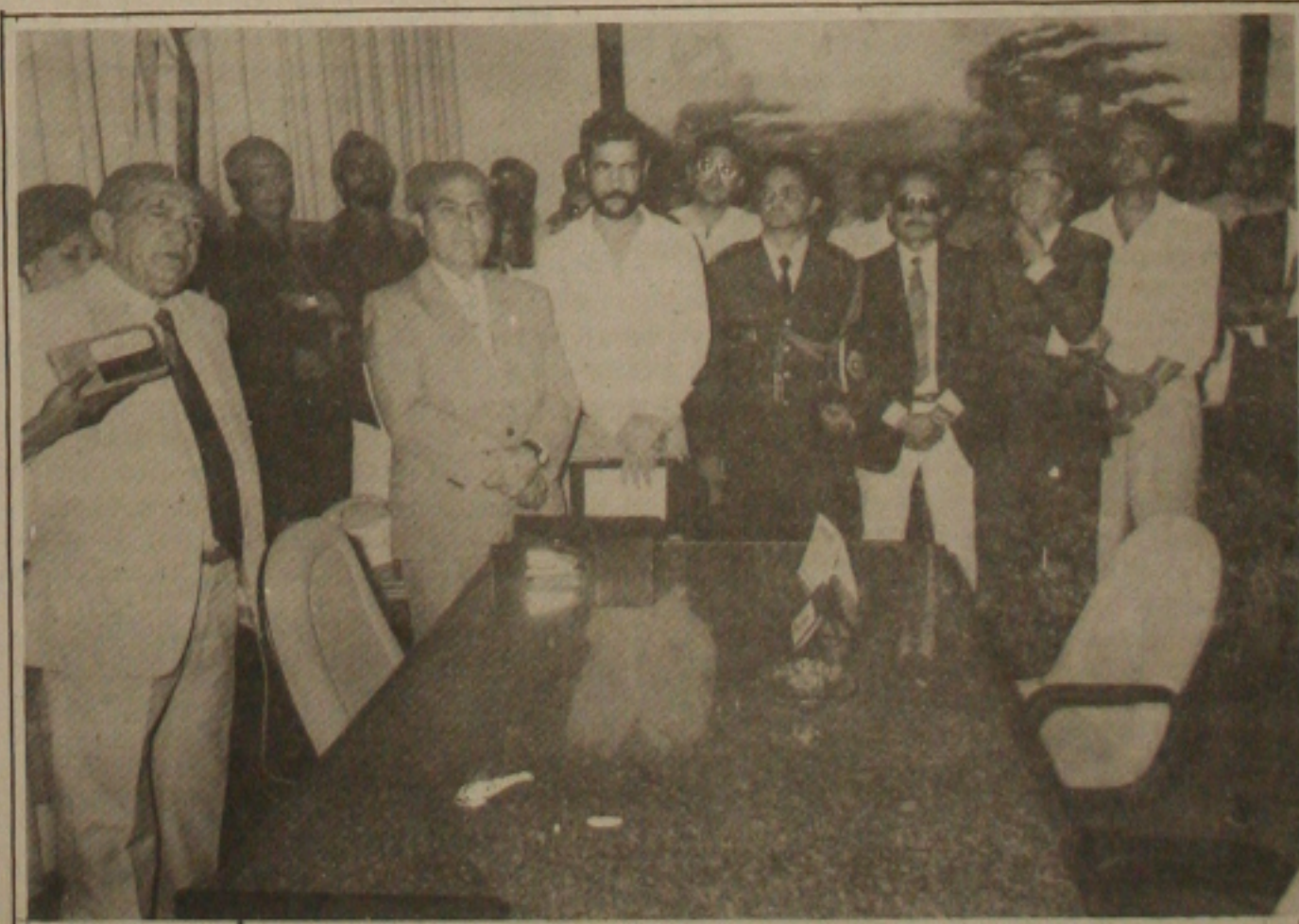
Barreto Mota é empossado e promete reduzir a violência.