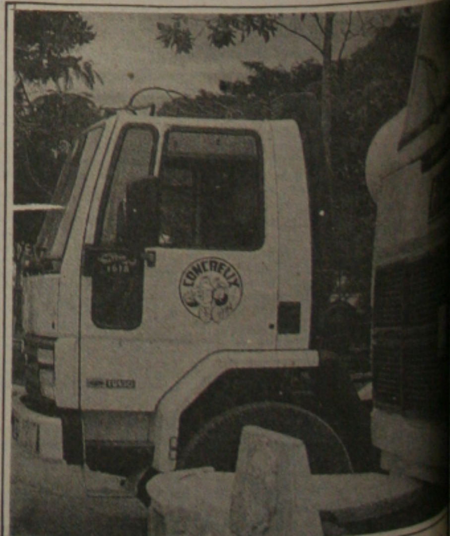
Bomba hidráulica escondida sob o capô e protegida pelo pára-choque: muito útil à engenharia da Ford

A julgar pelo relatório enviado à Ford, o motorista saiu satisfeito da experiência. Ele começa elogiando a cabine, em sua opinião "macia e fresca, ao contrário do forno do 2220"; a boa visibilidade, e maciez. "O caminhão é estável e o chassi não torce. De maneira que a suspensão, como a direção e os freios também são excelentes", escreveu o motorista.