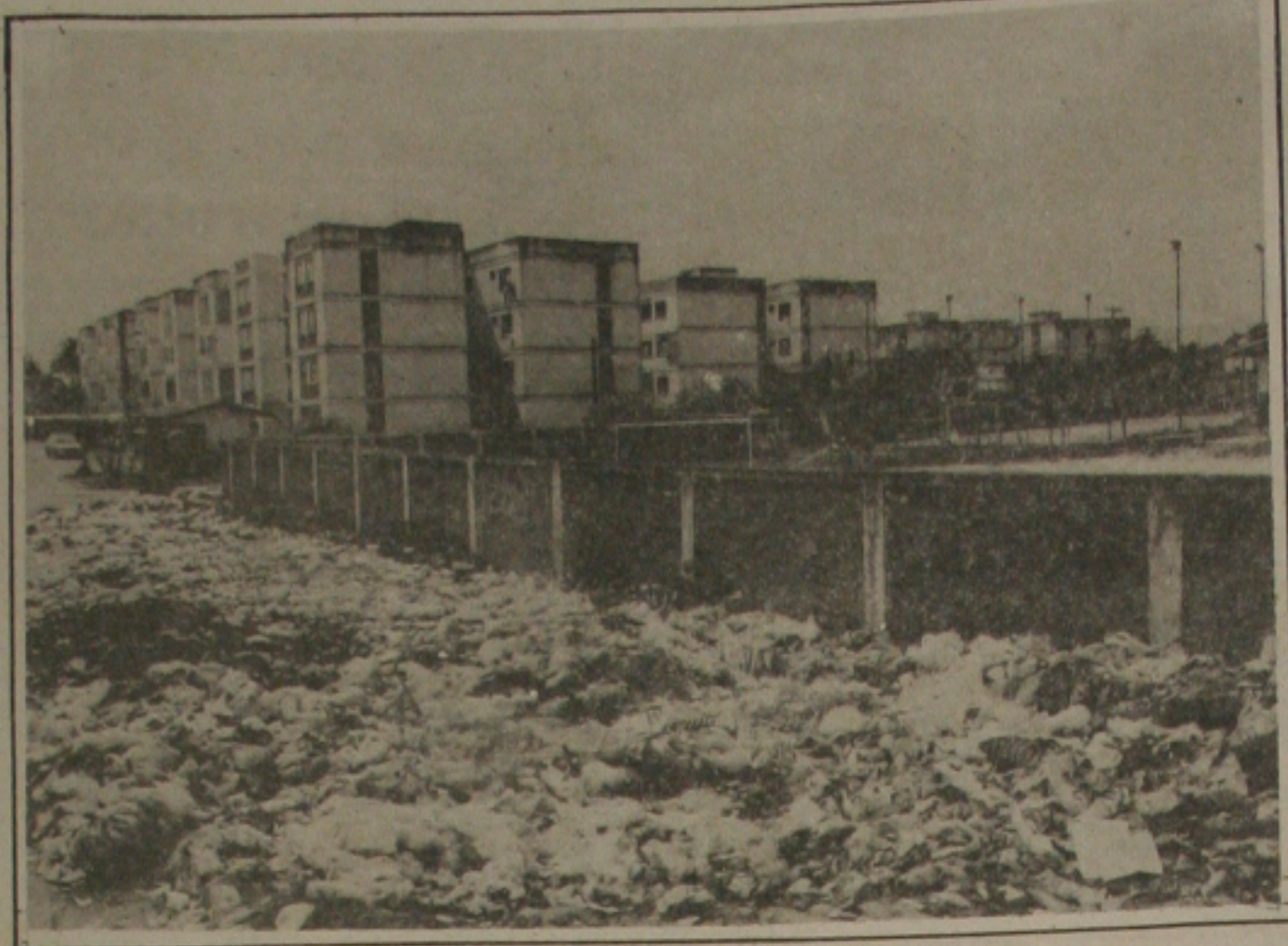
Coleta de lixo irregular é motivo de reclamações.