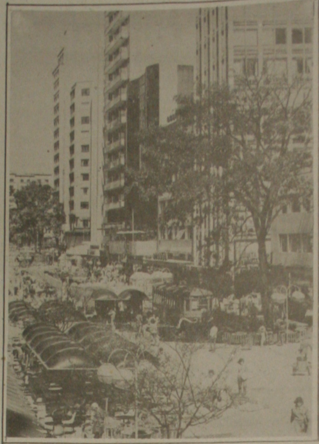
A Rua das Flores é cartão de visita de Curitiba.

Desde 1828, quando era uma pequena oficina, até tornar-se uma empresa de renome mundial com cerca de 1000 empregados, a KUHN sempre foi reconhecida pela sua competência e dedicação ao trabalho de qualidade - uma receita para a colheita das melhores safras no futuro.