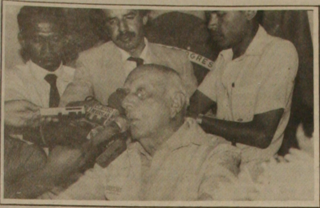
Ulysses disse que pode ser velho, mas não é velho e será o futuro presidente do Brasil, para acabar com a fome e a miséria.