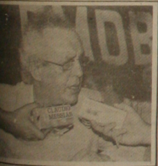
Jarbas garantiu que não haverá intervenção.