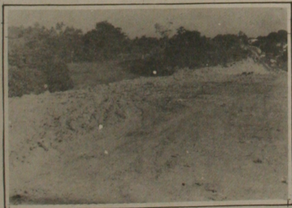
Retirada de barro causa prejuízos.