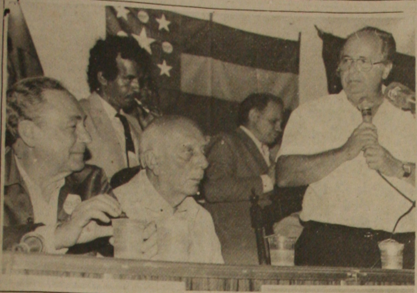
Em nome da bancada federal, o senador Francisco Rollemberg fez a saudação ao presidente Ulysses Guimarães.

Arredores do condomínio dos Bosques da Avenida Tancredo Neves se queixam da falta de recolhimento na coleta de lixo. As autoridades responsáveis pela limpeza pública. Apesar da existência de uma comissão para atender aos pedidos, por ser pequena, a limpeza não faz o lixo ser colocado em sacos improvisados e encostados na parede. Mas o lixo continua a fazer mau cheiro. (Página 2).