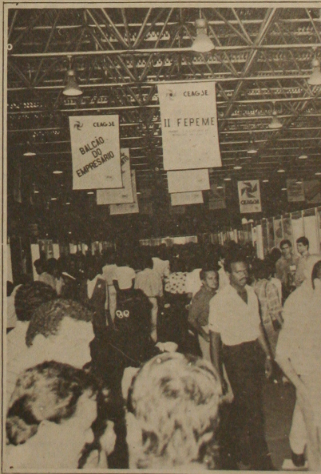
Bastante concorrida abertura da Feira de Moda Sergipe 89.

Brasília - O Conselho Interministerial de Preços (CIP) aprovou antontem reajustes para os preços de indústria do açúcar refinado, das massas alimentícias e dos pneus. O aumento do açúcar começa a vigorar hoje e é de 29,87%. O das massas é de 25,12% e o dos pneus varia de 12,01% para os convencionais a 19,75% para os especiais de ar também tiveram um aumento de 6,78%.