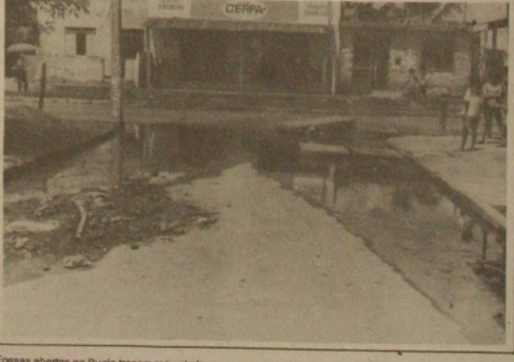
Fossas abertas no Bugio trazem mau cheiro.

cheque no valor de R.Cz$ 340,00 foi emitido em nome das Casas das Tintas por um policial civil, enquanto outro serviu para comprar um carro no valor de R.Cz$ 3.500,00. O policial Antônio Biquinho é acusado de ter ordenado as compras. (Página 2).