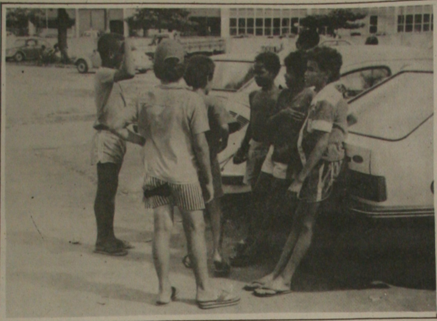
Aumenta o número de menores carentes nas ruas de Aracaju