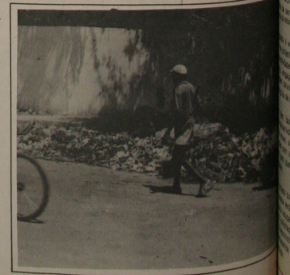
Rua do mercado no Conjunto Bugio está cheia de lixo.