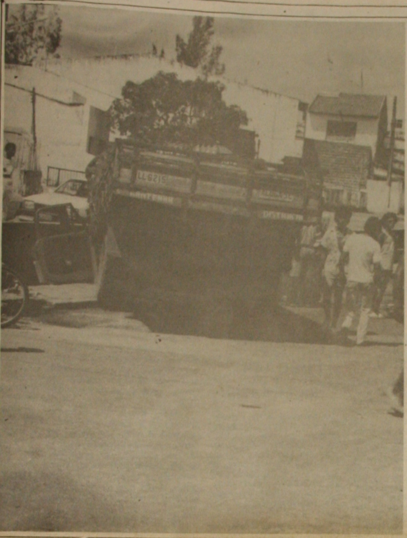
O caminhão caiu no canal por culpa da embriaguez de seu motorista.