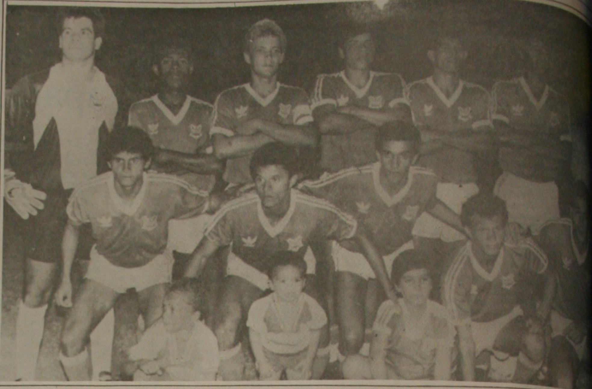
O time do Sergipe, campeão de 89 encerra sua participação na temporada, recebendo as faixas do time proletário.