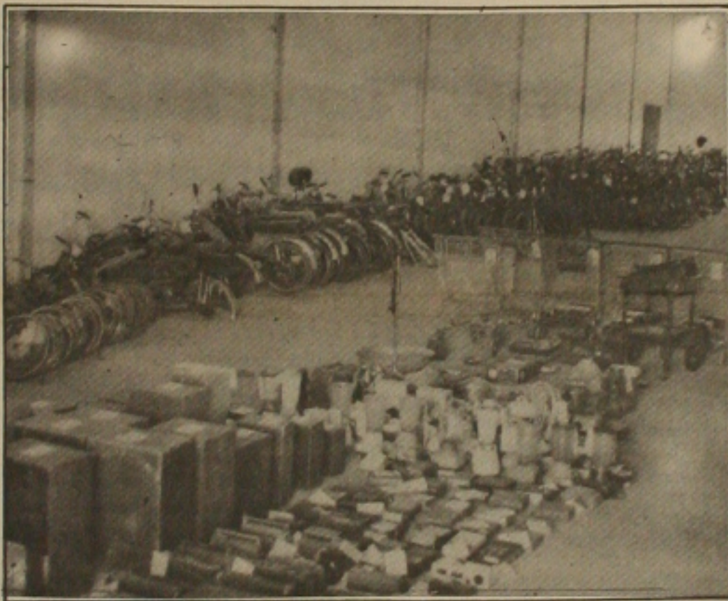
Objetos apreendidos e não entregues aos donos serão leiloados.

Um fato que desperta atenção dos moradores daquela área e também da própria polícia, é que dias atrás pouco mais de 50 metros foi assassinado o dentista conhecido por "Bené" e até agora a polícia investiga o caso e não chegou a nenhuma conclusão, no entanto, acredita-se que "Bené", morreu por crime passionai e envolve um alto comerciante.