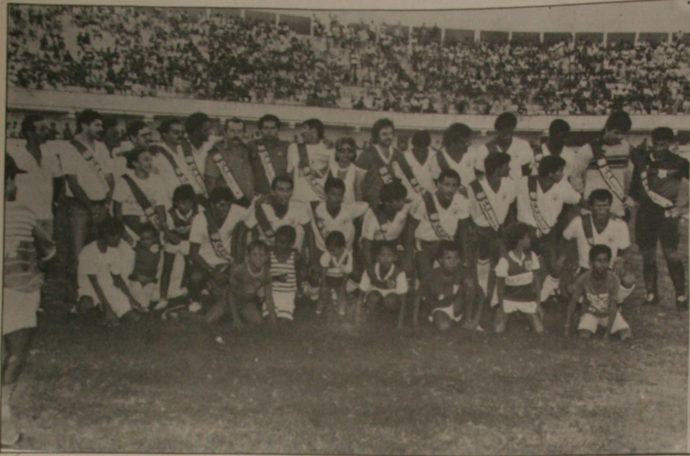
Os jogadores de 89 receberam as faixas e perderam para o Confiança por 2x1.