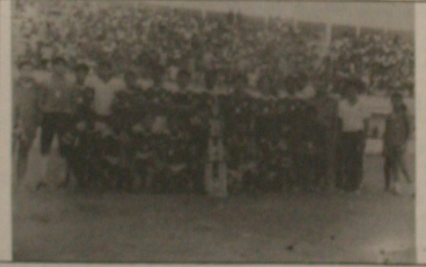
Os juniores do Sergipe, medalhas de ouro no peito, pousaram como campeões de 88.

O Confiança conseguiu vencer o Sergipe na festa das faixas do time rubro e conseguiu o melhor desempenho de futebol. A vitória no primeiro tempo, quando aproveitamos ainda a falta de equilíbrio do time proleptário, nos deu o primeiro gol. Os tentos foram marcados todos eles por Edson e Roberto Potiguar, para o Confiança. Na fase final, o time rubro recebeu na frente. Ganhou na corrida e na saída de Flávio chutou forte rastreado e diminuiu logo em seguida. Carlinhos para o Sergipe e aproveitando uma falha do goleiro Wellington.