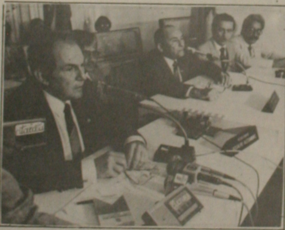
Deputado federal Bernardo Cabral fez palestra na Câmara de Vereadores.

Bernardo Cabral falou ainda a respeito do voto em branco e do voto nulo. Para ele, estes dois tipos de voto é um desestímulo para o processo democrático.