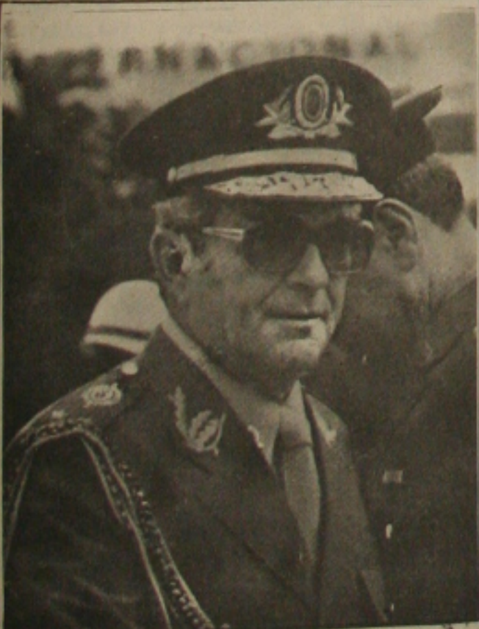
General Ludwig; sepultamento hoje.

entação asfálti- quilômetros da da acesso a de Piram- quilômetros da cipiana, será próxima semana concluída 10 dias. Foi o ontem o Departamento de Rodagem, ao confirmar a contrato en- do Estado e ora Limoeiro, a concorrência valor de 3 cruzados, para da obra. (Página 2).