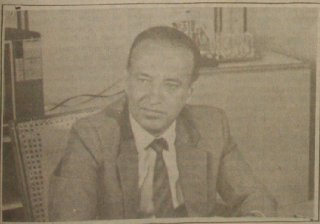
Valadares: mostrando Sergipe aos japoneses.

Segundo ainda o governador, são prioridades a implantação, ampliação e revitalização de polos de menores portes e dos distritos industriais já existentes no Estado. Ele prioriza também o sistema de irrigação para beneficiar a agricultura; a implantação, ampliação e melhoria do sistema de abastecimento de água em setores industriais. Os japoneses se mostraram interessados em virem a Sergipe e ver "in loco" tudo o que foi apresentado pelo governador, a fim de iniciar contatos (Página 05).