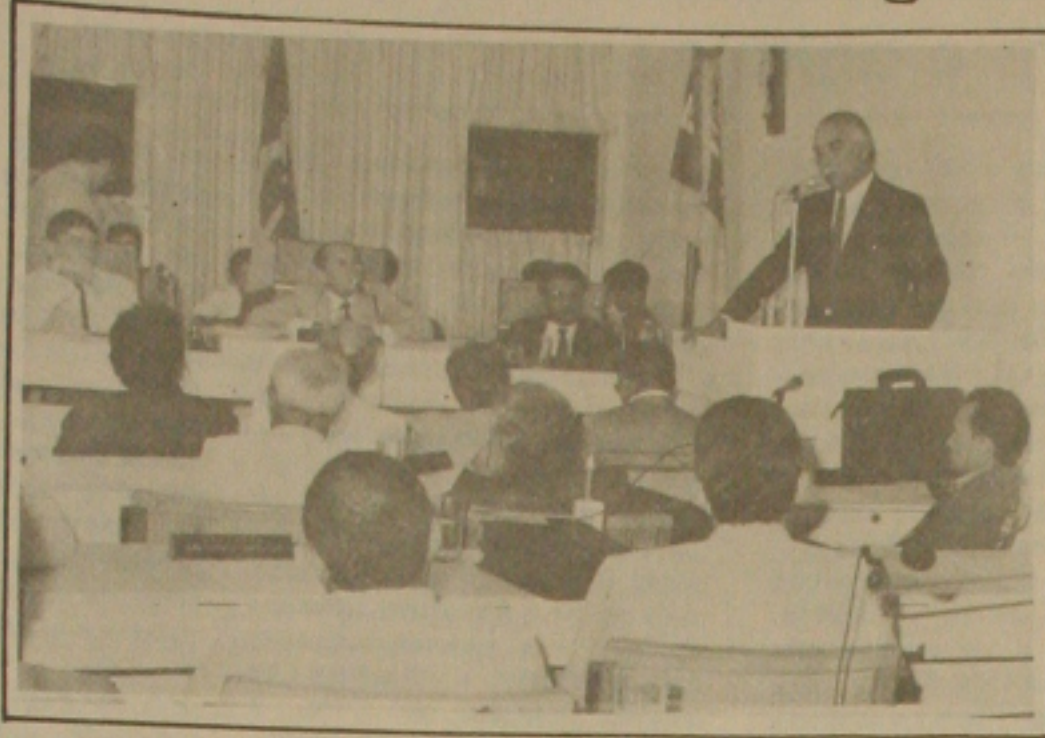
Paixão vai explicar hoje as reais situações da PMA e pedir o apoio de todos aqueles que querem, realmente, ajudar para saída da crise.