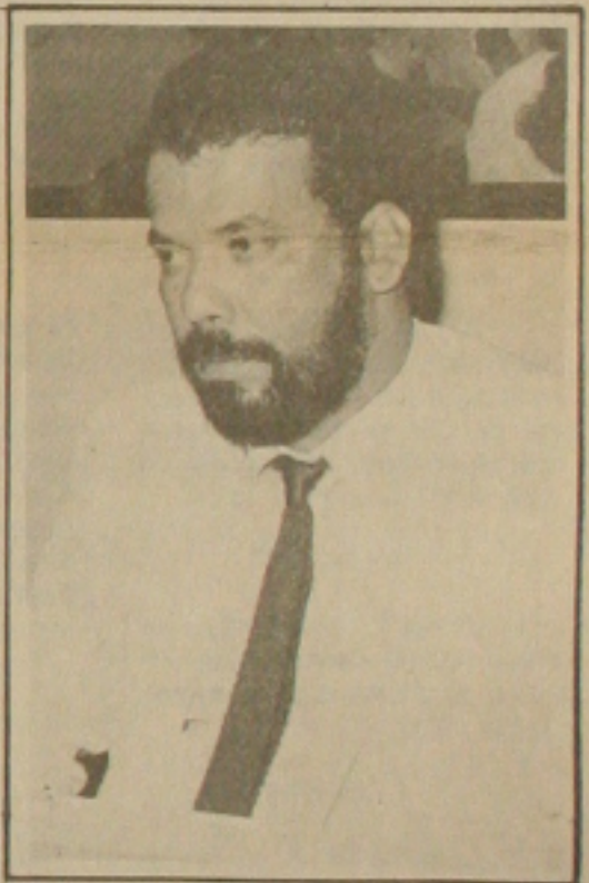
Nascimento quer coerência na distribuição de casas.

Muitos deputados e outros políticos ligados ao grupo de Valadares serão beneficiados com essas casas. Os deputados e lideranças políticas e o governador estão doando aquilo que não lhes pertencem, que é construído com o dinheiro do povo e deve ser repassado com coerência e honestidade.