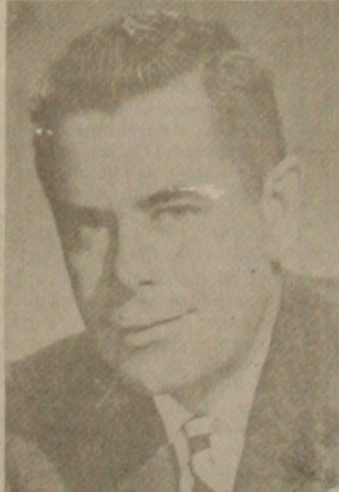
Glenn Ford ... pois o bandido queimou o seu rosto durante uma discussão. P. 5 & 89'

Bannion passa a investigar as atividades de Lagana e, pouco depois, sua mulher, Katie (Brando), é morta num atentado endereçado a ele. Seus superiores ordenam que ele abandone o caso, mas Bannion continua a seguir Lagana, homem poderoso e que controla toda a cidade. Sem ter em quem confiar, a não ser em uns poucos amigos com quem deixa a sua filha, Bannion recebe a inesperada ajuda de Debby Marsh (Grahame), a ex-namorada de Vince Stone (Marvin), braço direito de Lagana, desejosa de vingança.