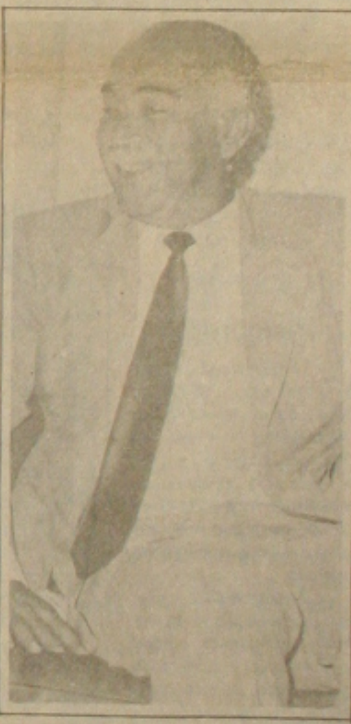
Patção: atrasando os salários.

Hoje, na Delegacia Regional do Trabalho, acontecerá a primeira reunião de mediação entre o Sindicato dos Trabalhadores no Município de Aracaju (Página 2)