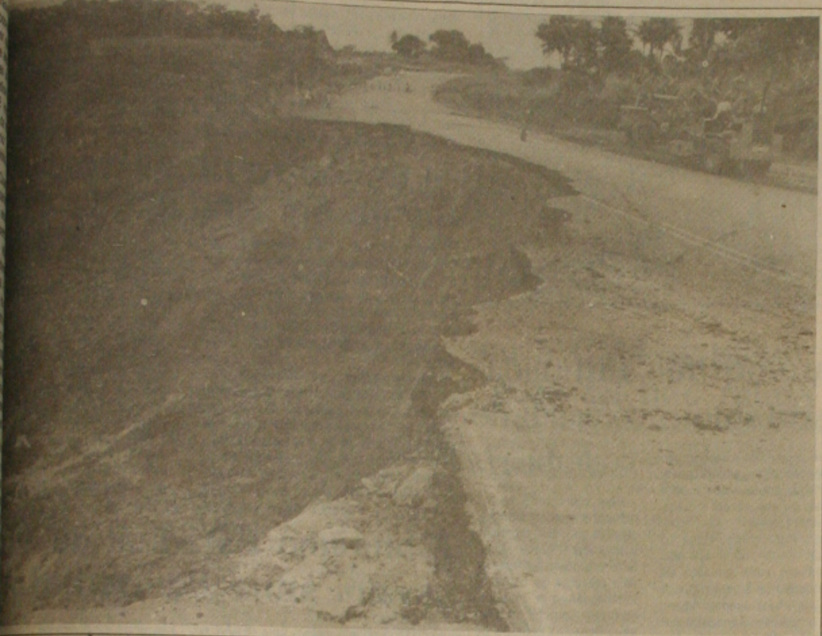
Manter e recuperar as rodovias, para que se evitem situações como essa, é o que está sendo discutido em Aracaju por técnicos e dirigentes de órgãos rodoviários.