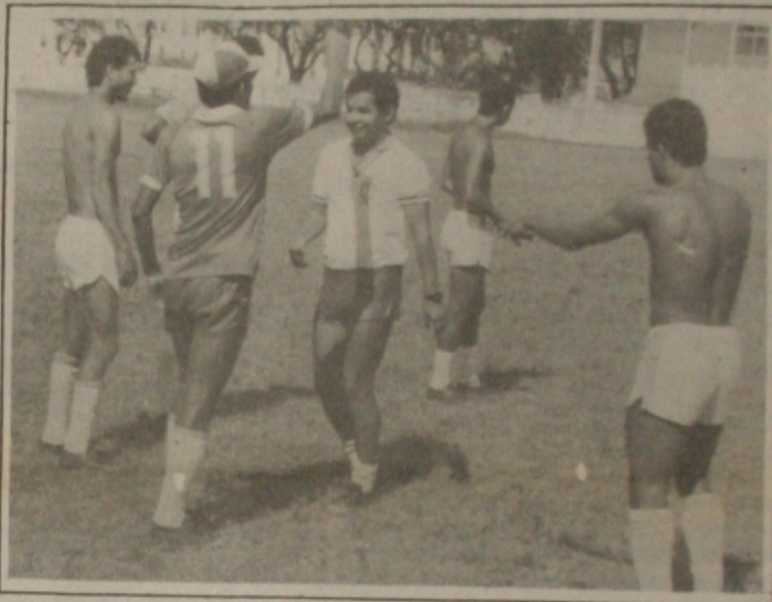
Jogadores do Sergipe treinam motivados, pensando na estréia do Campeonato Brasileiro, contra o Flu de Feira.